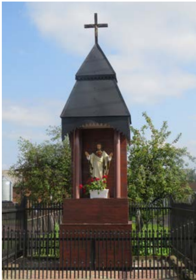
Lokalizacja: Wola Mystkowska;

K apliczka murowana z figurą Serce Jezusa we wnęce. Daszek zwieńczony krzyżem.