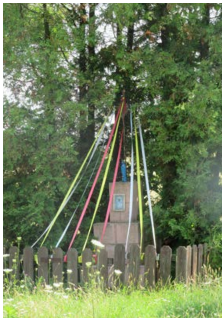
Lokalizacja: Jackowo Górne;

K apliczka drewniana wisząca na drzewie z wizerunkiem Pana Jezusa Dobrego Pasterza.