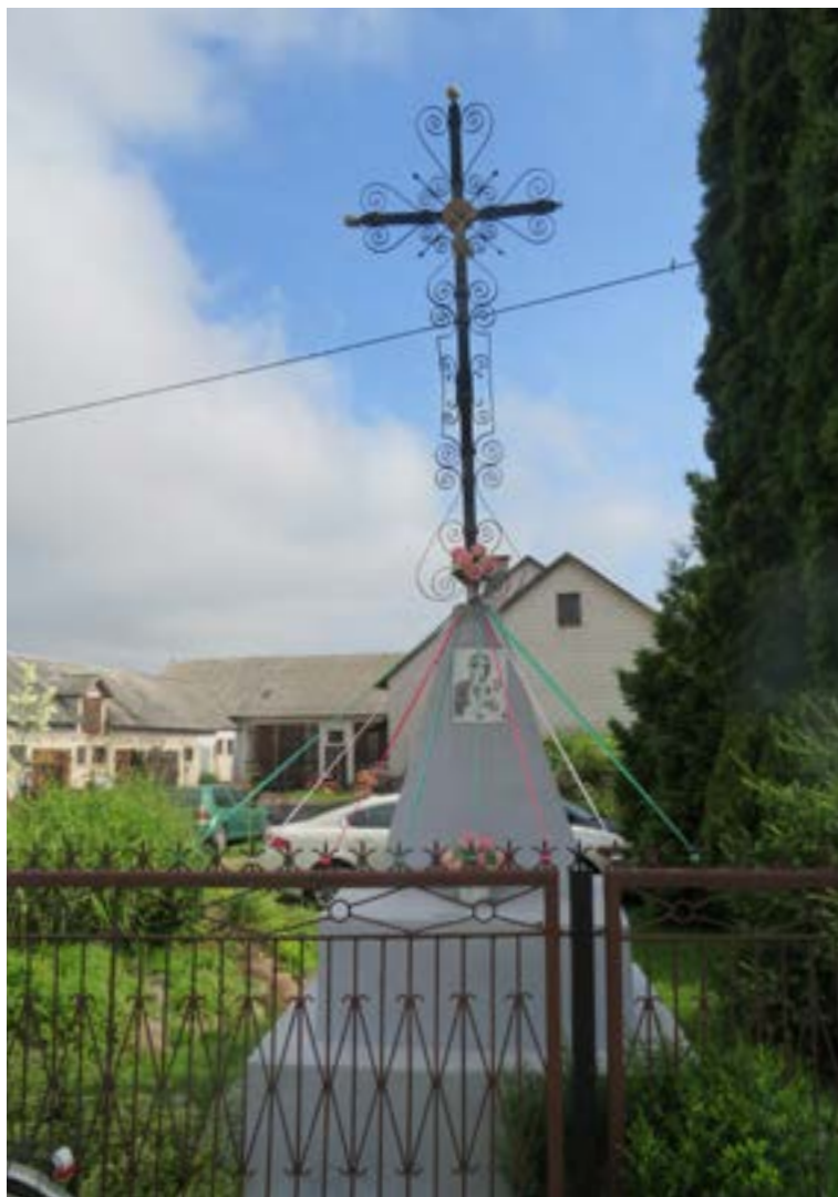
Lokalizacja: Wólka Somiankowska;

K rzyż żelazny na murowanym, trójstopniowym cokole. Krzyż gałkowy, z ornamentami wzdłuż obydwu belek. Na cokole od frontu obraz z wizerunkiem Matki Bożej Częstochowskiej.