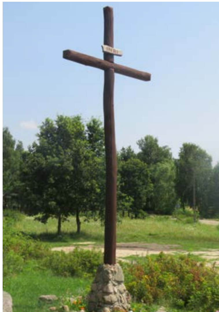
Lokalizacja: Popowo Kościelne;

K apliczka drewniana kolumnowa, wewnątrz pieta, czyli figura Matki Bożej trzymającej zmarłego, ukrzyżowanego Jezusa Chrystusa.