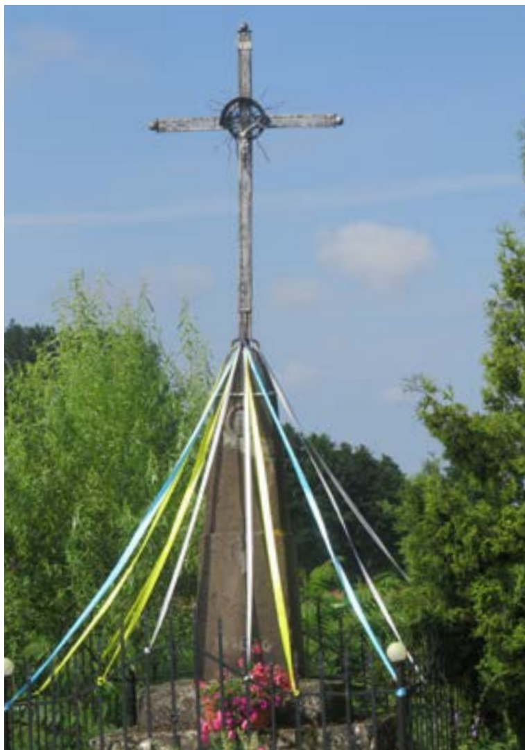
Lokalizacja: Wola Mystkowska;

K rzyż żelazny na murowanym cokole. Krzyż z figurą Chrystusa, gałkowy. Na zwężającym się do góry cokole data „1916 2 0”. Ogrodzony żelaznym płotkiem.