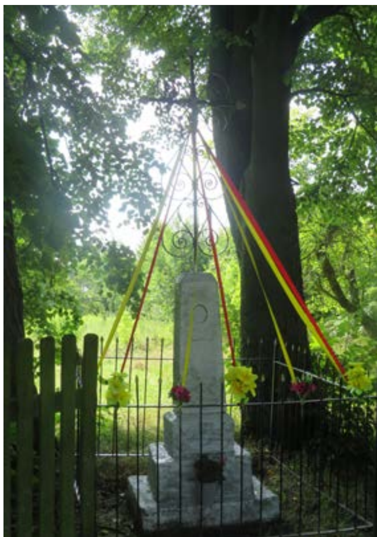
Lokalizacja: Nowe Wypychy;

Krzyż żelazny na murowanym cokole. Krzyż przestrzennej konstrukcji, z figurą Chrystusa. Na wielostopniowym, zwężającym się do góry cokole napis: „SZCZĘŚĆ NAM BOŻE 1838 R.” Ogrodzony żelaznym płotkiem.