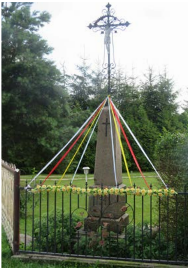
Lokalizacja: Stare Płudy;

K rzyż żelazny na murowanym cokole. Krzyż promienisty z figurą Chrystusa osłoniętą blaszanym daszkiem. Ramiona zakończone sercowato, wzdłuż obydwu belek ozdobne relingi. Na wielostopniowym cokole data: „1945”.