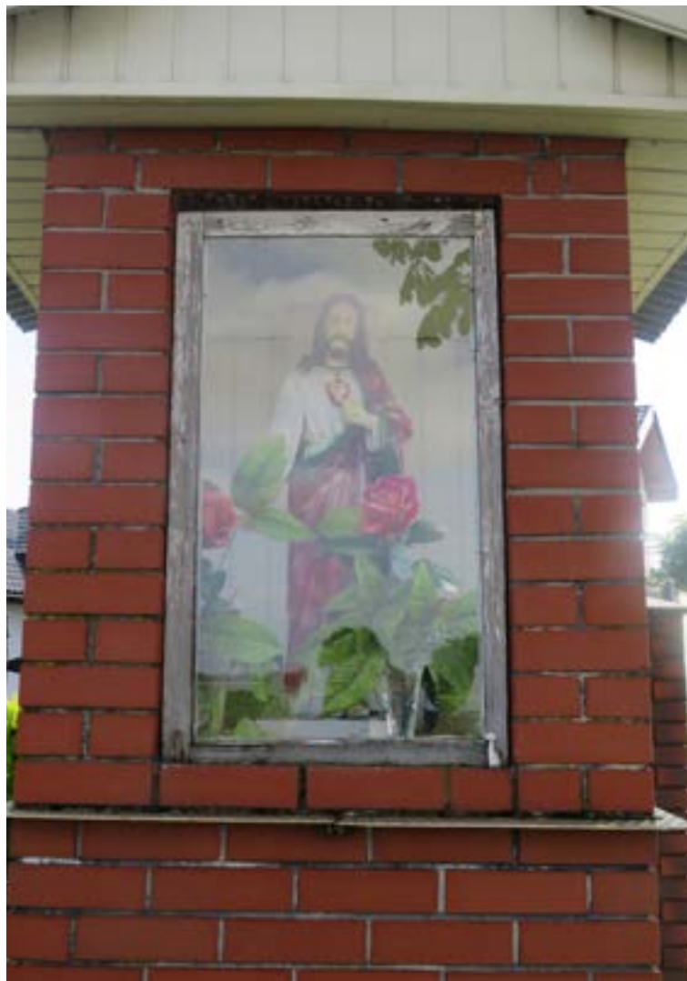
Lokalizacja: Stare Kozłowo;

K rzyż żelazny z kapliczką. Krzyż z figurą Chrystusa, gałkowy, promienisty. Przy pionowej belce żelazna, przeszklona kapliczka z figurą Matki Bożej Różańcowej.