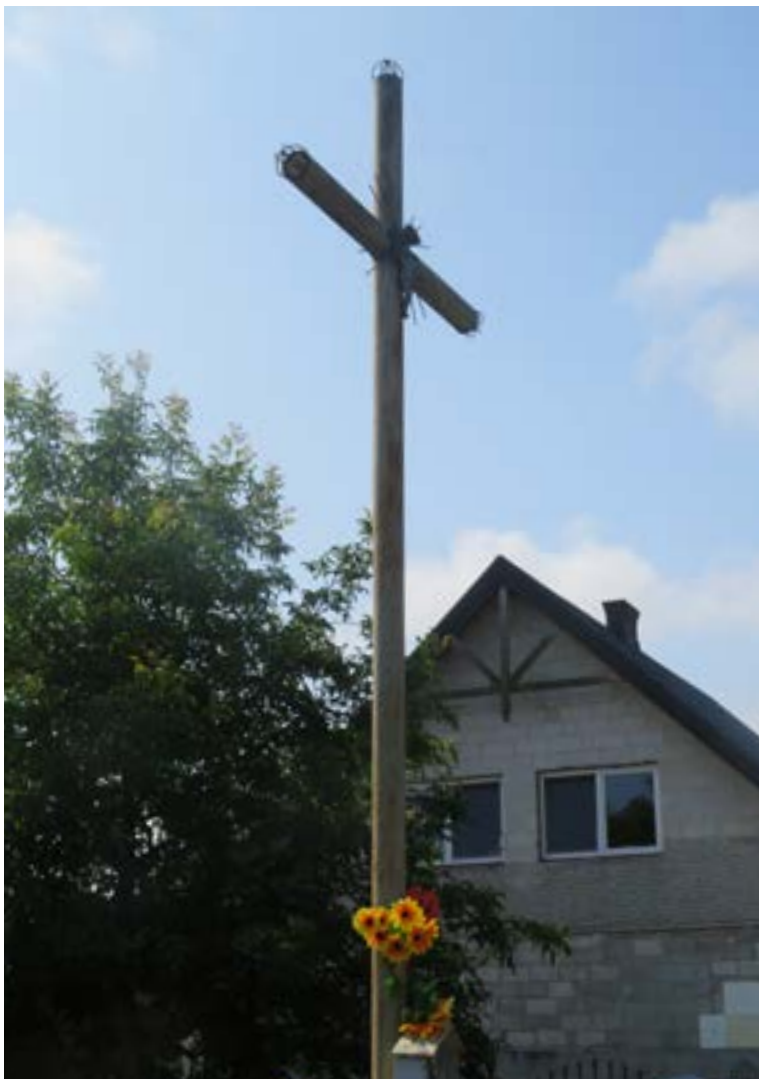
Lokalizacja: Stare Kozłowo;

K rzyż żelazny z kapliczką. Krzyż z figurą Chrystusa, gałkowy, promienisty. Przy pionowej belce żelazna, przeszklona kapliczka z figurą Matki Bożej Różańcowej.