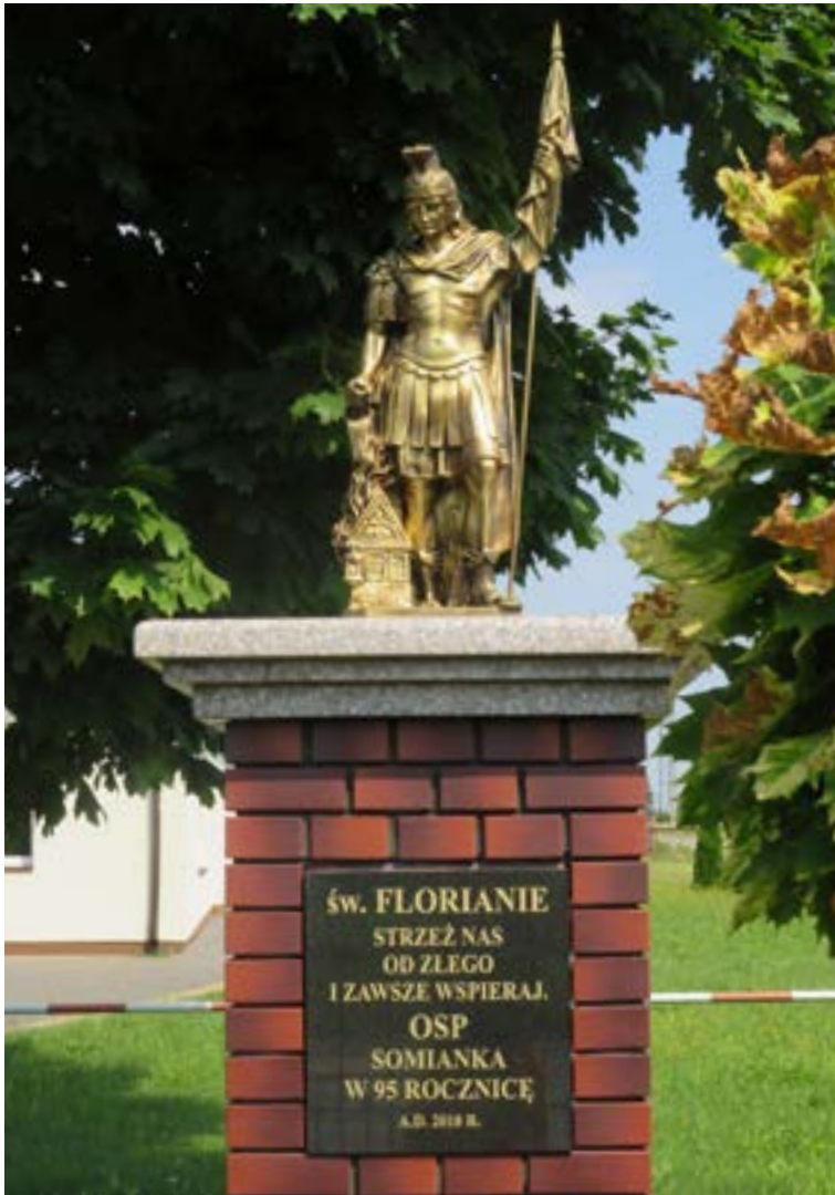
Lokalizacja: Somianka Parcele;

F igura Św. Floriana na murowanym cokole. Na tablicy napis: „ŚW. FLORIANIE, STRZEŻ NAS OD ZŁEGO I ZAWSZE WSPIERAJ. OSP SOMIANKA W 95. ROCZNICĘ A.D. 2018 R.”