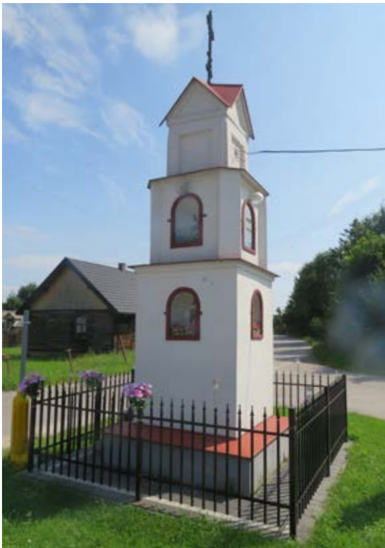
Lokalizacja: Stary Mystkówiec;

K apliczka murowana, wielopoziomowa, wnąkowa. Łamany daszek zwieńczony krzyżem żelaznym przestrzennej konstrukcji. We wnąkach: obraz z wizerunkiem Matki Bożej Częstochowskiej oraz figury: MB Fatimskiej, MB Różańcowej, Najświętszego Serca Jezusa, Św. Franciszka, Św. Józefa i Św. Ojca Pio (?). Na tablicy od frontu napis: „JEZU UFAM TOBIE”. Ogrodzona żelaznym płotkiem