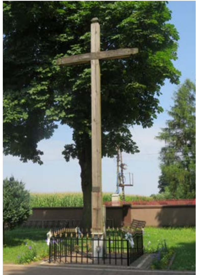
Lokalizacja: Somianka Parcele;

F igura Św. Floriana na murowanym cokole. Na tablicy napis: „ŚW. FLORIANIE, STRZEŻ NAS OD ZŁEGO I ZAWSZE WSPIERAJ. OSP SOMIANKA W 95. ROCZNICĘ A.D. 2018 R.”