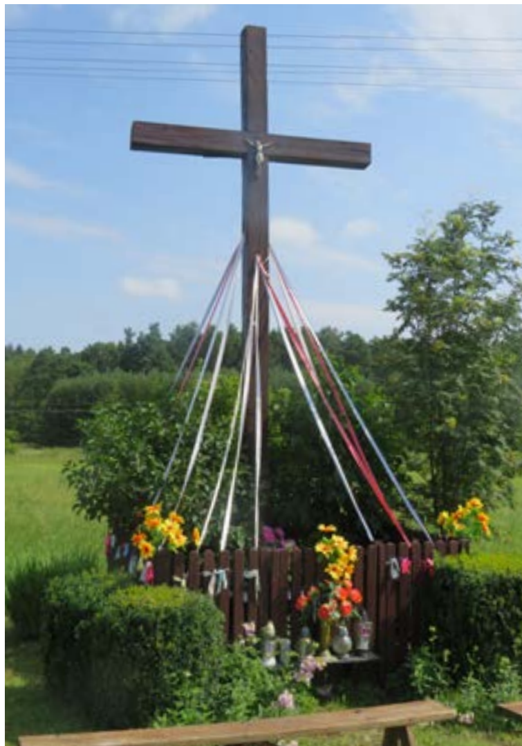
Lokalizacja: Stary Mystkówiec;

K apliczka murowana, wielopoziomowa, wnąkowa. Łamany daszek zwieńczony krzyżem żelaznym przestrzennej konstrukcji. We wnąkach: obraz z wizerunkiem Matki Bożej Częstochowskiej oraz figury: MB Fatimskiej, MB Różańcowej, Najświętszego Serca Jezusa, Św. Franciszka, Św. Józefa i Św. Ojca Pio (?). Na tablicy od frontu napis: „JEZU UFAM TOBIE”. Ogrodzona żelaznym płotkiem