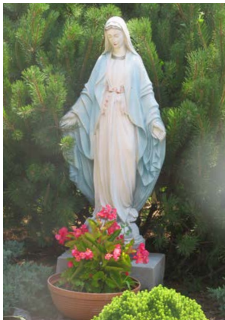
Lokalizacja: Somianka Parcele;