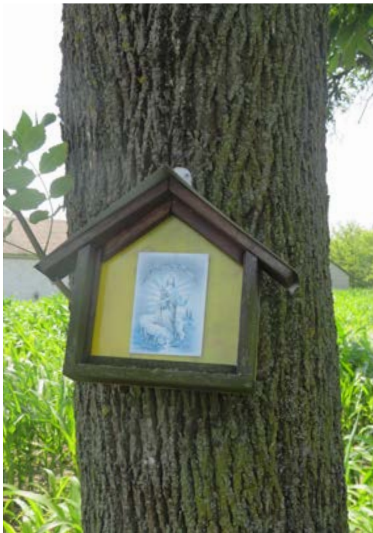
Lokalizacja: Jackowo Górne;

K apliczka drewniana wisząca na drzewie z wizerunkiem Pana Jezusa Dobrego Pasterza.