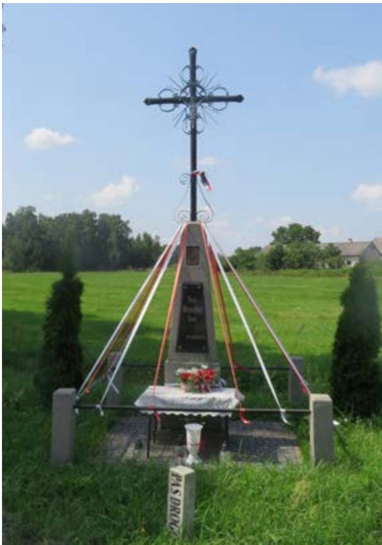
Lokalizacja: Nowe Płudy;

K rzyż żelazny z figurą Chrystusa osłoniętą blaszanym daszkiem. Krzyż promienisty, z ażurowymi zdobieniami wzdłuż obydwu ramion. Na murowanym, zwężającym się do góry cokole tablica z napisem: „BOŻE BŁOGOSŁAW NAM A.D. 15.06.1957 R.” Nad tablicą rzyngraf z wizerunkiem Matki Bożej Ostrobramskiej.