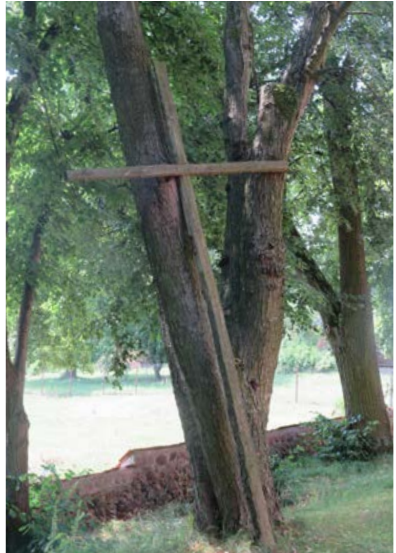
Lokalizacja: Popowo Kościelne;

D rewniane popiersie św. Jakuba przy Sanktuarium MB Popowskiej. Na tabliczce napis: „CAMINO DE SANTIAGO”. Przy cokole z pnia drzewa tabliczka z modlitwą do św. Jakuba Apostoła.