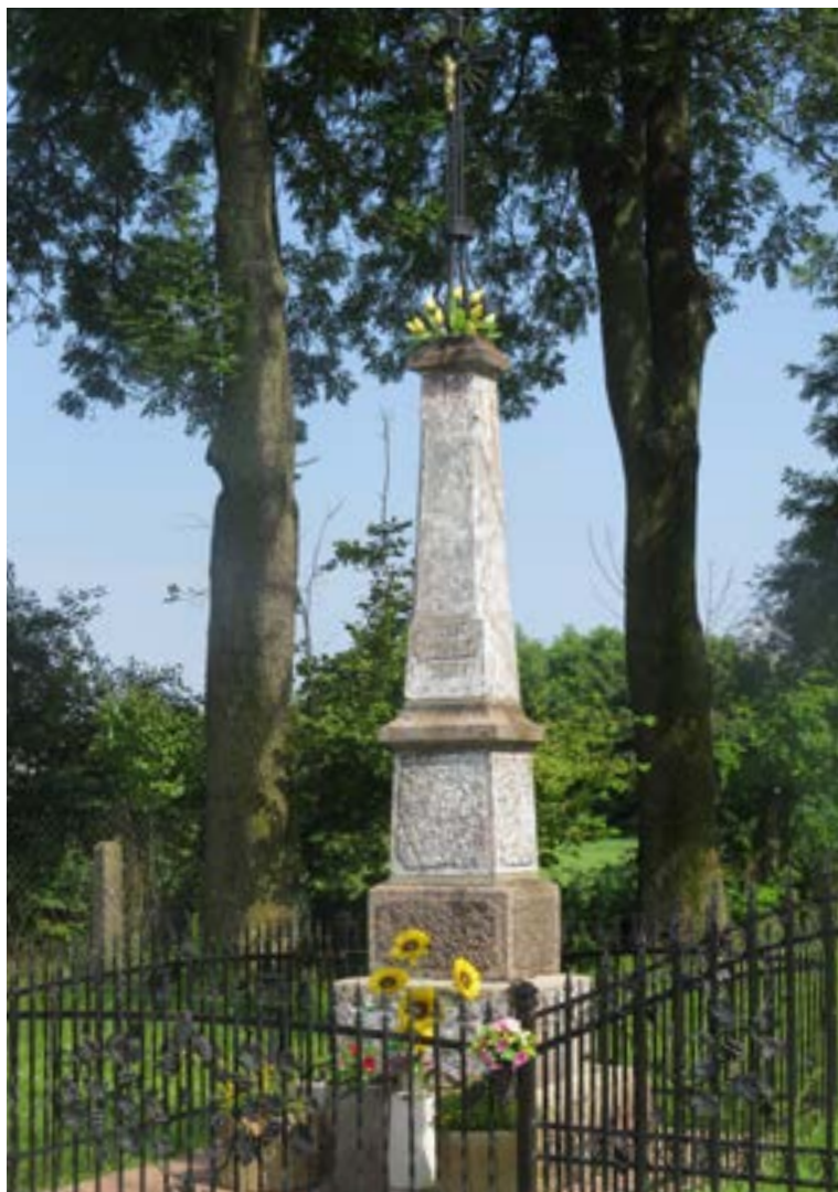
Lokalizacja: Nowe Wypychy;

Krzyż żelazny na murowanym cokole. Krzyż przestrzennej konstrukcji, z figurą Chrystusa. Na wielostopniowym, zwężającym się do góry cokole napis: „SZCZĘŚĆ NAM BOŻE 1838 R.” Ogrodzony żelaznym płotkiem.