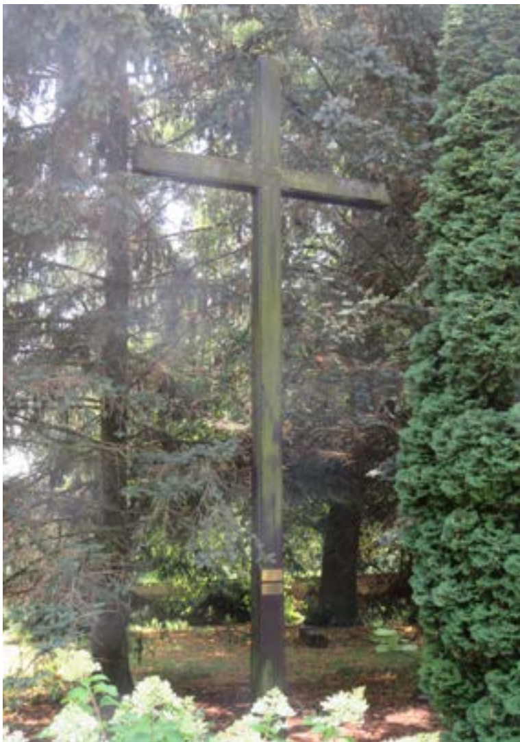
Lokalizacja: Popowo Kościelne;

K rzyż drewniany przy Sanktuarium MB Popowskiej. Krzyż jest pamiątką Misji św., które odbywały się w Popowie w dniach 13-20 maja 1989 r. oraz 1-8 września 2013 r.