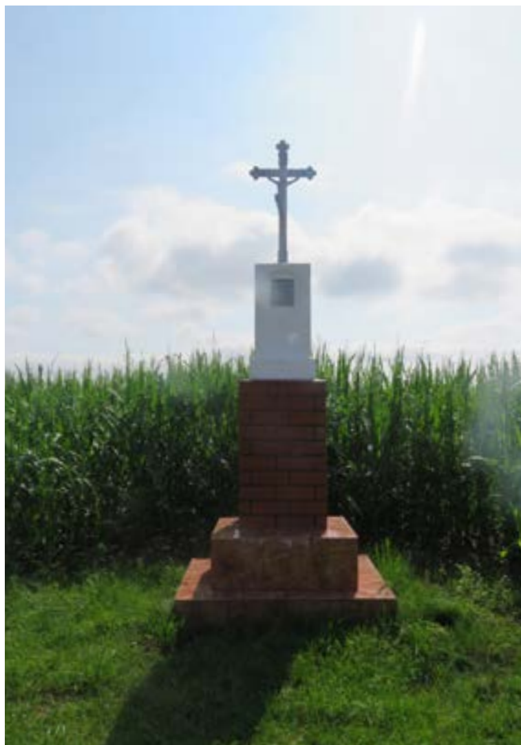
Lokalizacja: Stare Kozłowo;

K rzyż z figurą Chrystusa na kamiennym cokole. Krzyż żelazny, z sercowatymi zakończeniami ramion oraz ozdobnymi relingami wzdłuż obydwu belek.