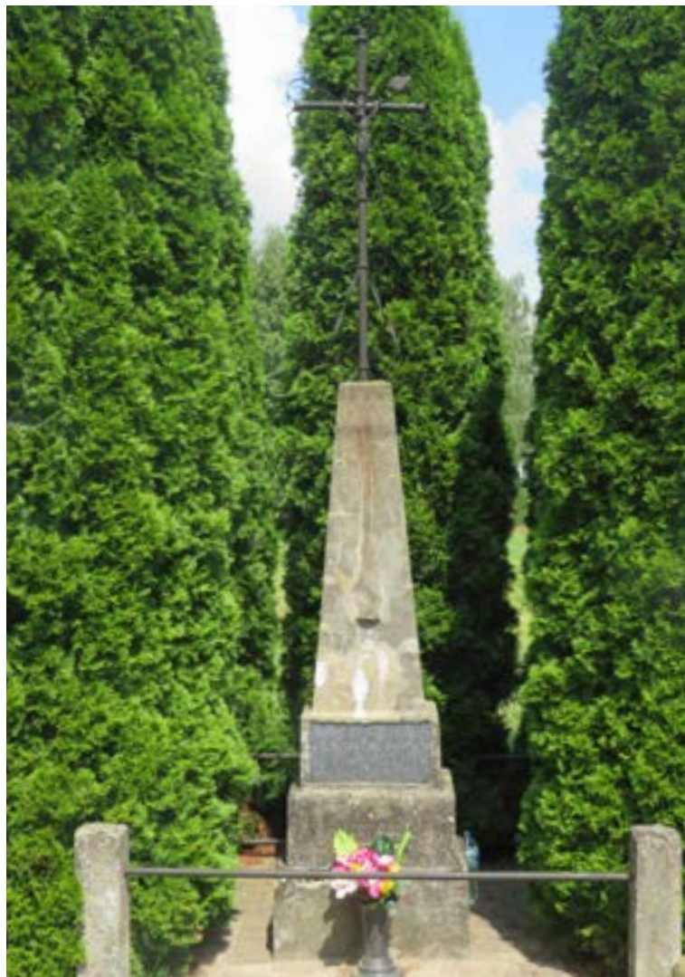
Lokalizacja: Stare Płudy;