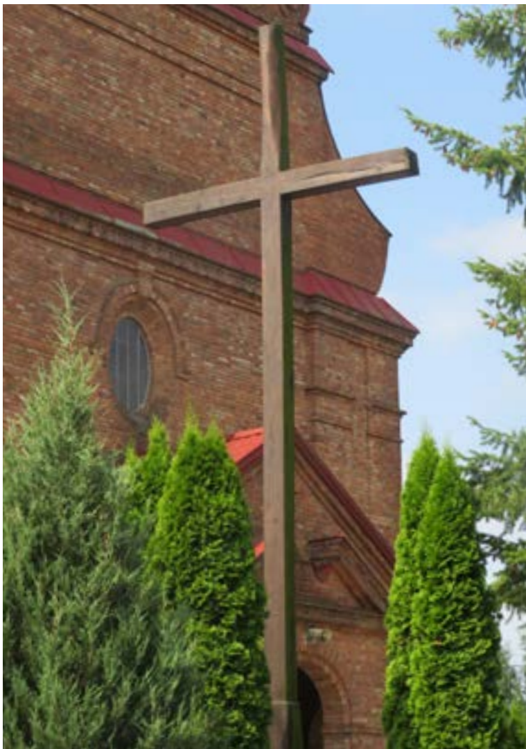
Lokalizacja: Wola Mystkowska;