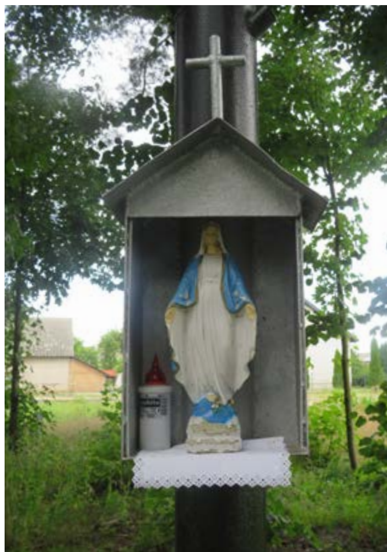
Lokalizacja: Wólka Somiankowska;

K rzyż żelazny na murowanym, trójstopniowym cokole. Krzyż gałkowy, z ornamentami wzdłuż obydwu belek. Na cokole od frontu obraz z wizerunkiem Matki Bożej Częstochowskiej.