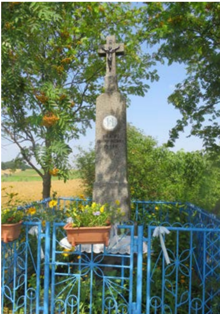
Lokalizacja: Jackowo Dolne;

K rzyż murowany z figurą Chrystusa, Na cokole od frontu medalion z wizerunkiem Matki Bożej Częstochowskiej, poniżej napis: „KRÓLOWO KORONY POLSKIEJ 1937 R”. Ogradzony żelaznym płotkiem.