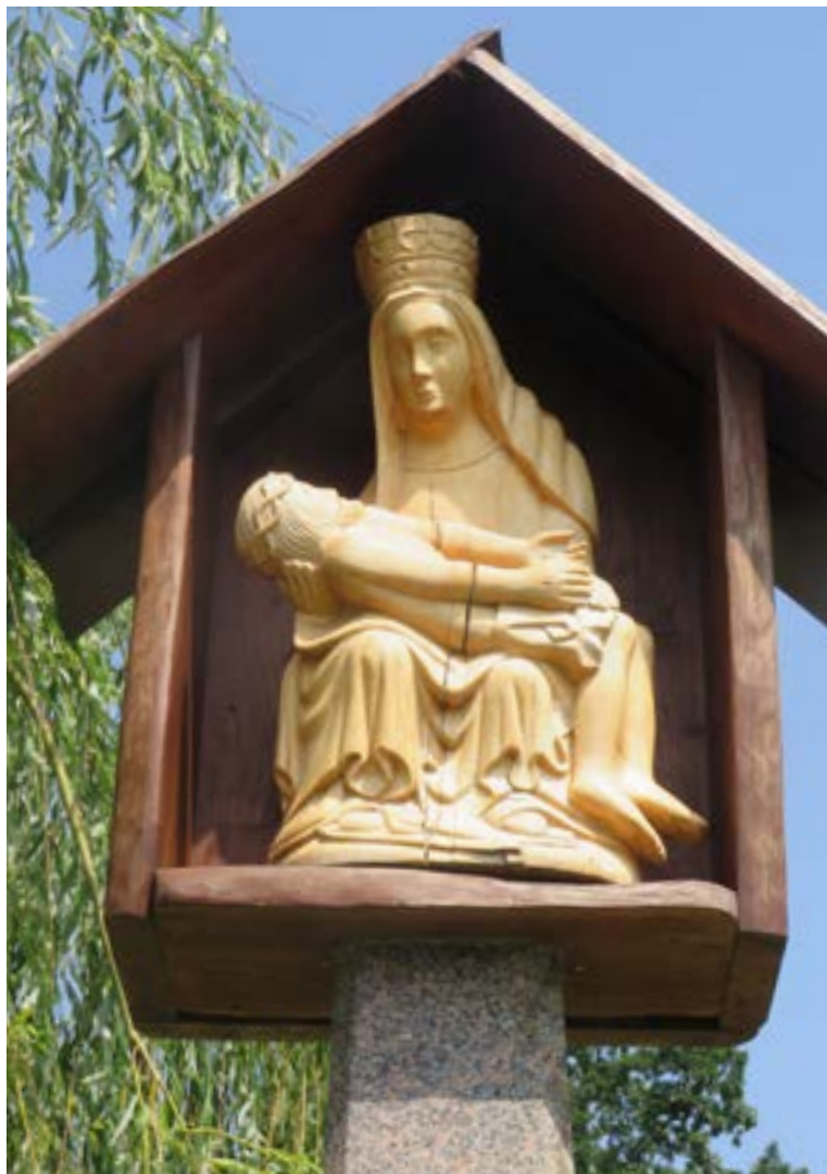
Lokalizacja: Popowo Kościelne;

K apliczka drewniana kolumnowa, wewnątrz pieta, czyli figura Matki Bożej trzymającej zmarłego, ukrzyżowanego Jezusa Chrystusa.