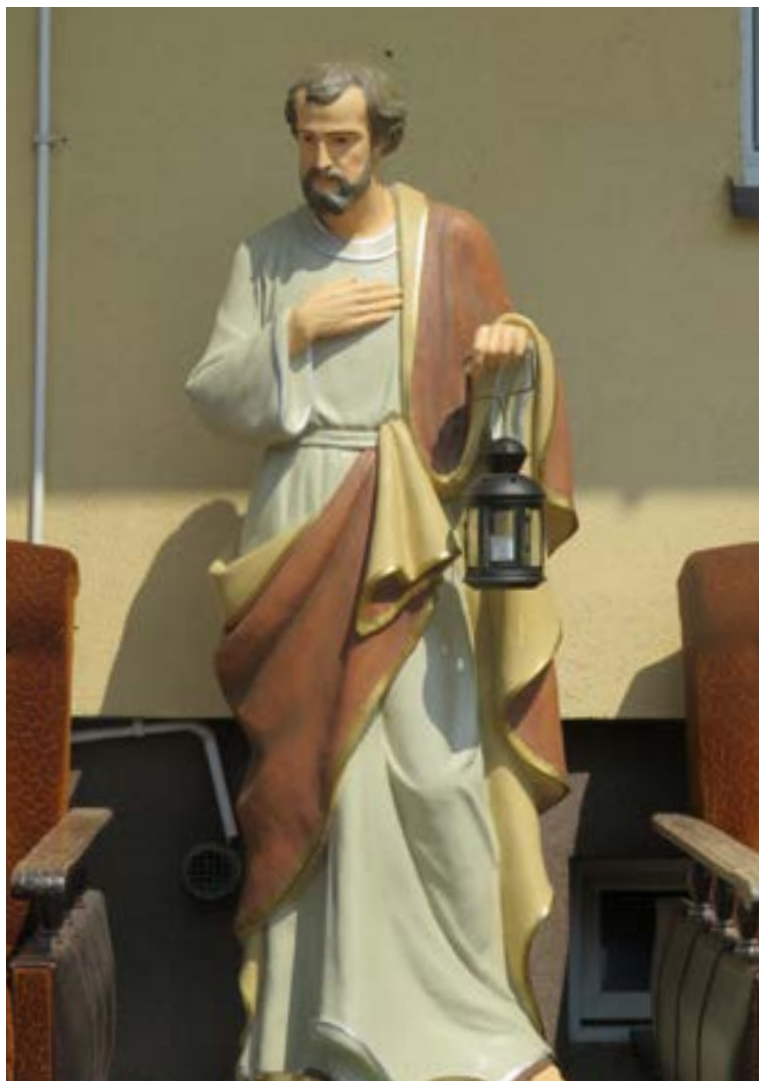
Lokalizacja: Somianka Parcele;