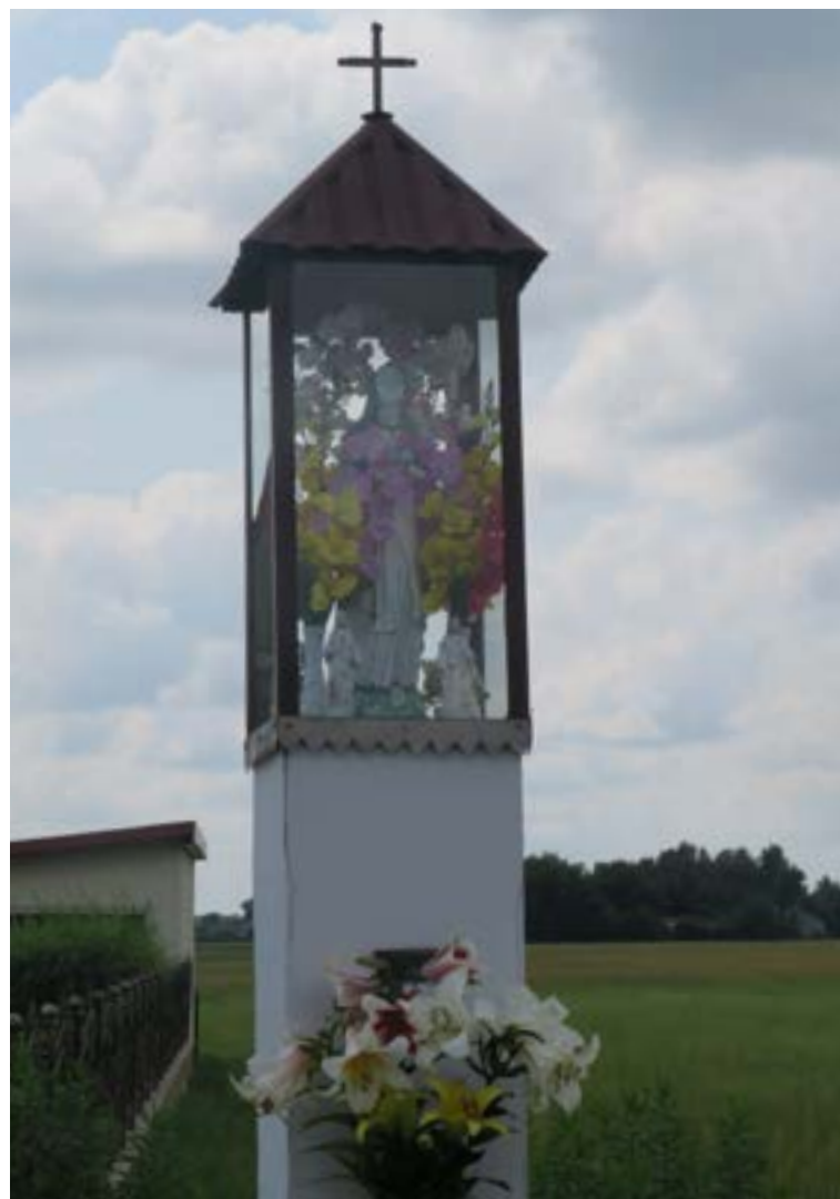
Lokalizacja: Stare Płudy;

K rzyż żelazny na murowanym cokole. Krzyż promienisty z figurą Chrystusa osłoniętą blaszanym daszkiem. Ramiona zakończone sercowato, wzdłuż obydwu belek ozdobne relingi. Na wielostopniowym cokole data: „1945”.