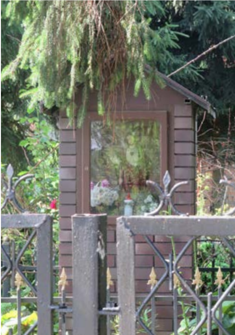
Lokalizacja: Nowe Wypychy;

K apliczka murowana. W zamkniętej szybie wewnątrz figura Najświętszego Serca Pana Jezusa.