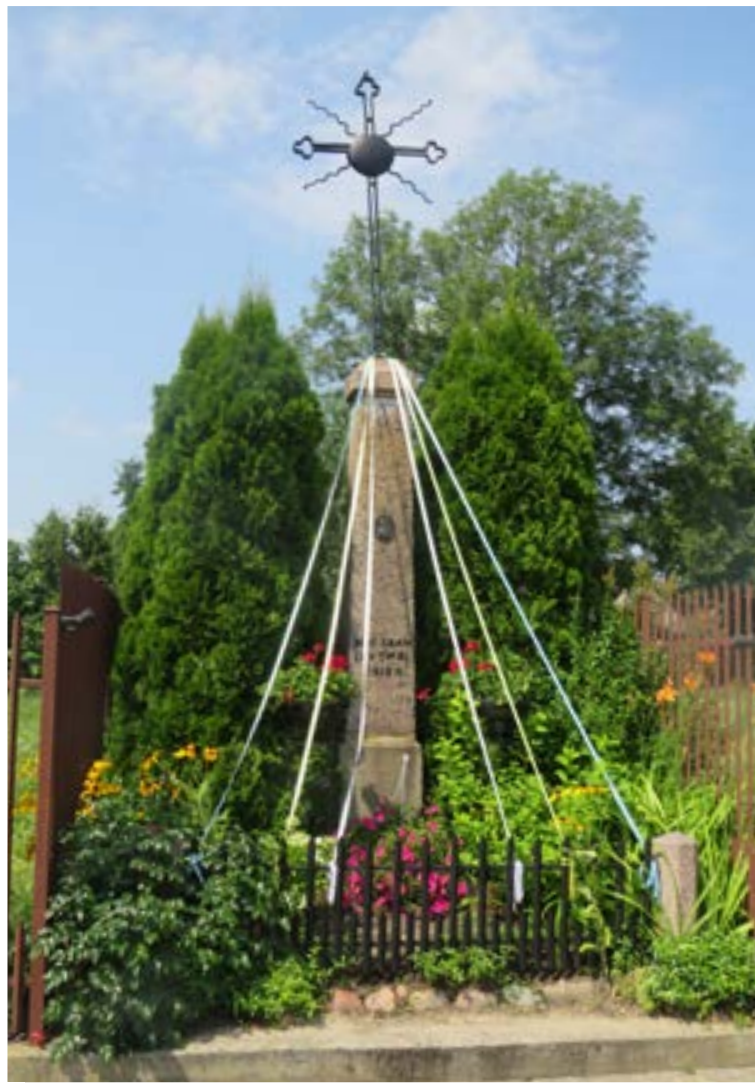
Lokalizacja: Popowo Kościelne;

K rzyż drewniany przy Sanktuarium MB Popowskiej. Krzyż jest pamiątką Misji św., które odbywały się w Popowie w dniach 13-20 maja 1989 r. oraz 1-8 września 2013 r.