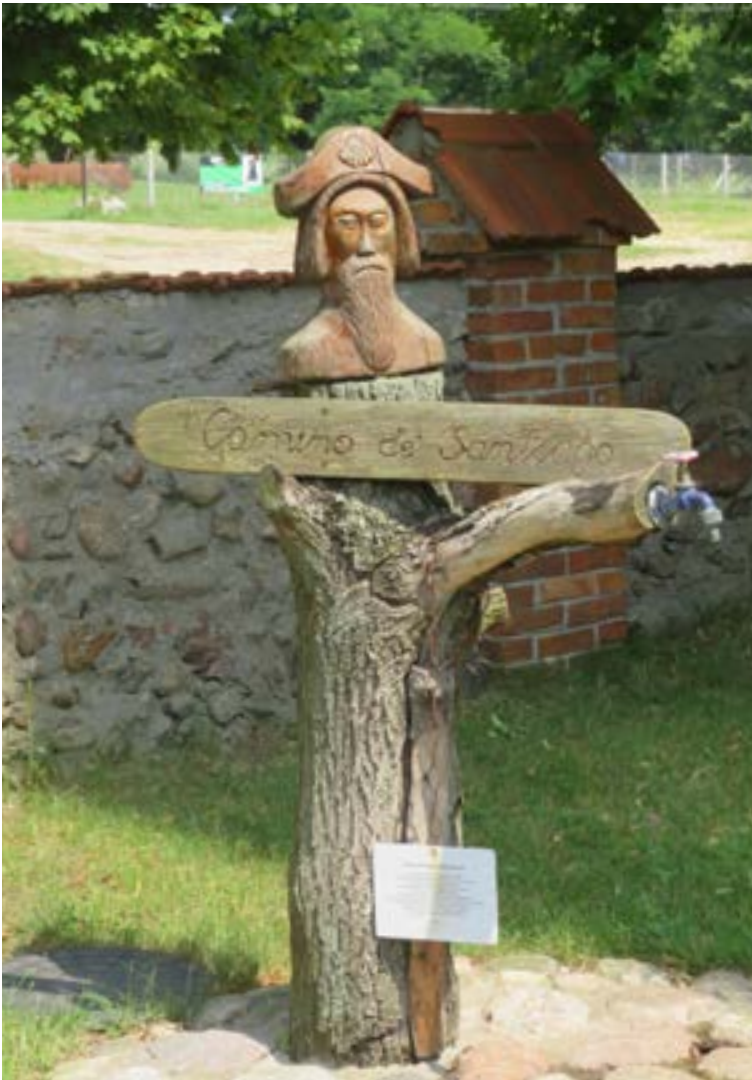
Lokalizacja: Popowo Kościelne;

D rewniane popiersie św. Jakuba przy Sanktuarium MB Popowskiej. Na tabliczce napis: „CAMINO DE SANTIAGO”. Przy cokole z pnia drzewa tabliczka z modlitwą do św. Jakuba Apostoła.