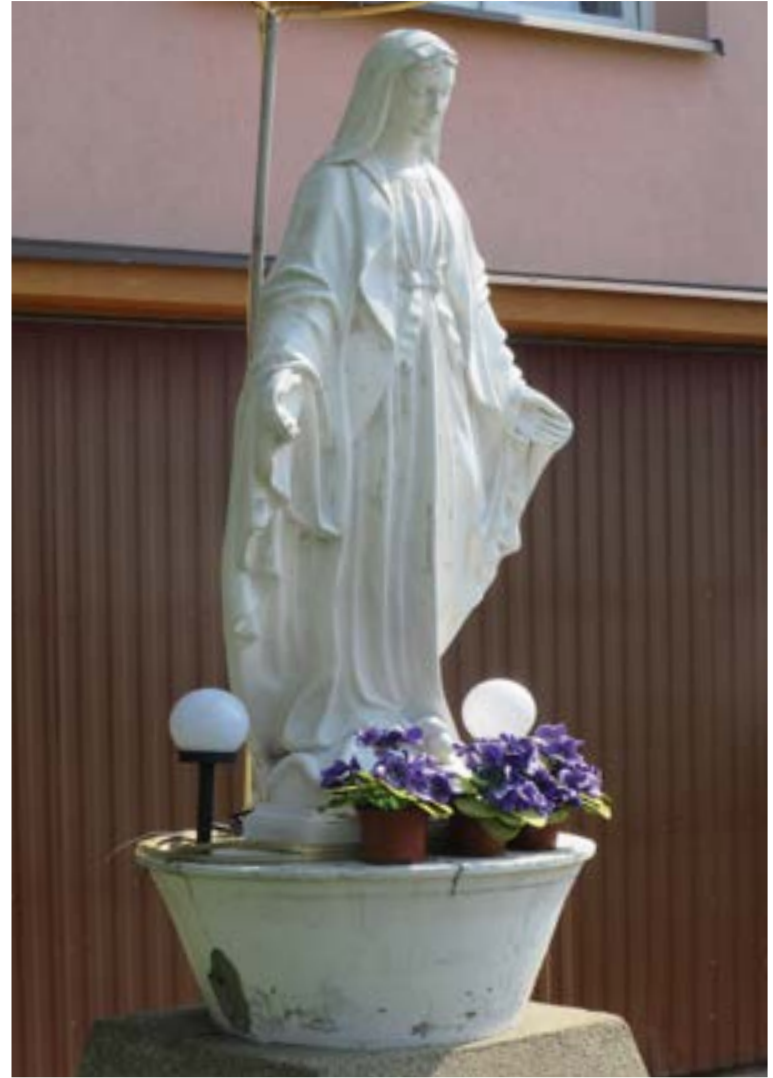
Lokalizacja: Nowe Wypychy;

K apliczka murowana. W zamkniętej szybie wewnątrz figura Najświętszego Serca Pana Jezusa.