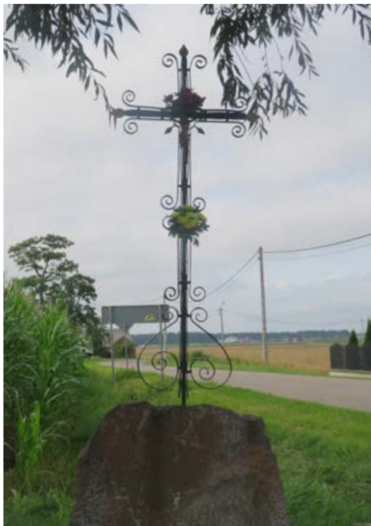
Lokalizacja: Stare Kozłowo;

K rzyż z figurą Chrystusa na kamiennym cokole. Krzyż żelazny, z sercowatymi zakończeniami ramion oraz ozdobnymi relingami wzdłuż obydwu belek.