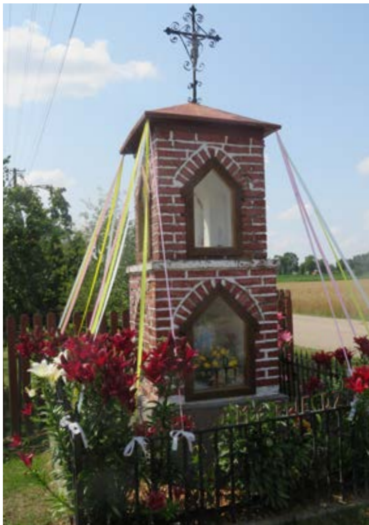
Lokalizacja: Nowe Płudy;

K apliczka murowana, wnekowa, wielopoziomowa. Daszek zwieńczony krzyżem żelaznym z sercowatymi zakończeniami ramion i ażurowymi zdobieniami. W zamkniętych szybą dwóch wnękach dwie figury Matki Bożej Różańcowej. Na żelaznym ogrodzeniu, ozdobionym roślinnymi motywami, napis: „MARYJO MY TWE DZIECI”.