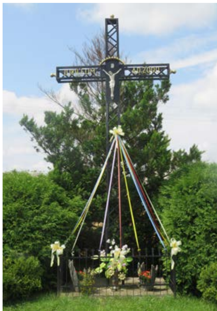
Lokalizacja: Wola Mystkowska;

K rzyż żelazny na murowanym cokole. Krzyż z figurą Chrystusa, gałkowy. Na zwężającym się do góry cokole data „1916 2 0”. Ogrodzony żelaznym płotkiem.