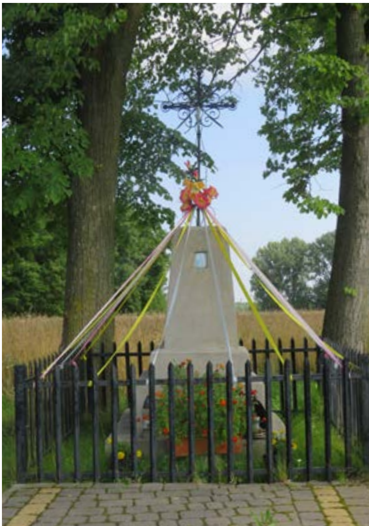
Lokalizacja: Nowe Wypychy;

K rzyż żelazny z figurą Chrystusa na trójstopniowym, murowanym cokole. Krzyż gałkowy, z ażurowymi zdobieniami wzdłuż obydwu ramion. Na najwyższym stopniu cokołu wewnątrz, w niej obrazek z wizerunkiem Matki Bożej Częstochowskiej. Ogrodzony żelaznym płotkiem.