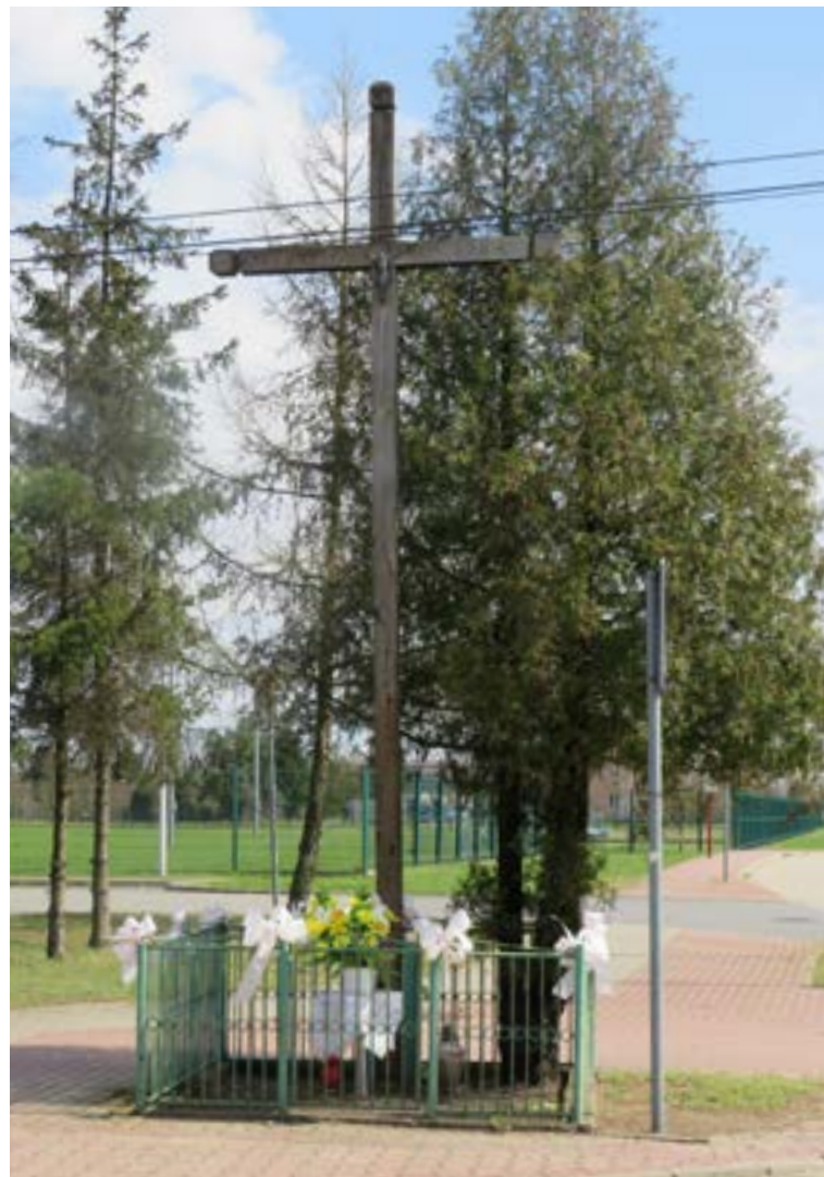
Lokalizacja: Wieliszew, ul. Kościelna 517; Czas powstania: brak danych;

K rzyż żelazny z sercowatymi zakończeniami ramion i ażurowymi zdobieniami wzdłuż pionowej belki. Na murowanym, kilkustopniowym, zwężającym się do góry cokole napis: „ŚW. BOŻE ZMIŁUJ SIĘ NAD NAMY FUNDATORY WIELISZEWA W 1929 ROKU”.