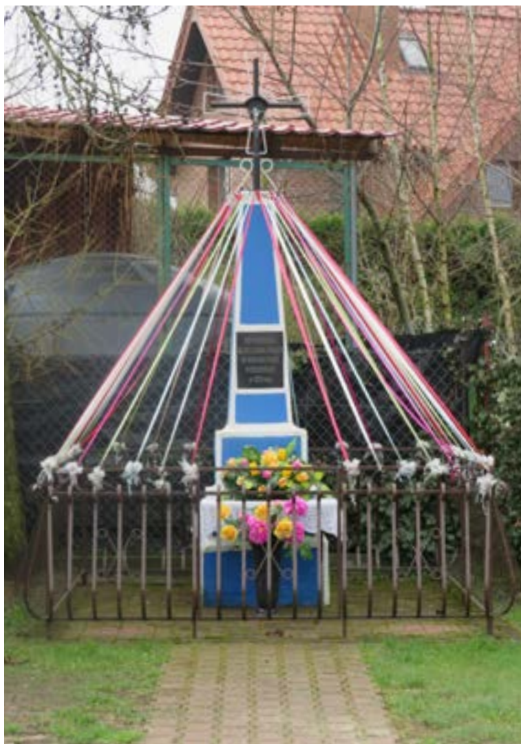
Lokalizacja: Wieliszew, ul. Niepodległości 24; Czas powstania: 1929 r.;

K rzyż żelazny z figurą Chrystusa osłoniętą blaszanym daszkiem. Wzdłuż ramion krzyża relingi i ażurowe zdobienia. Na murowanym, wielostopniowym zwężającym się do góry cokole napis: „OD POWIETRZA GŁODU OGNIA I WOJNY WYBAW NAS PANIE WYBUDOWA-NO W 1929 ROKU”. Ogrodzony żelaznym płotkiem.