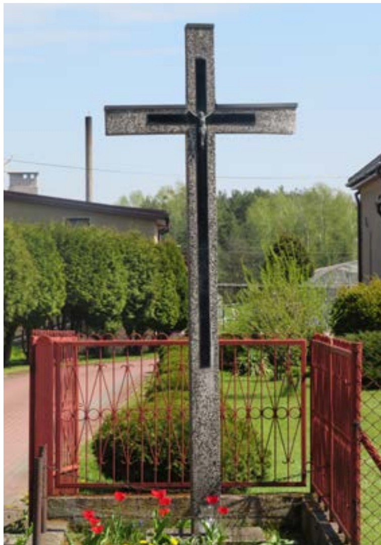
Lokalizacja: Olszewnica Stara, ul. Wiejska/Długa; Czas powstania: 1948 r.;

F igury Św. Rodziny na murowanym cokole.