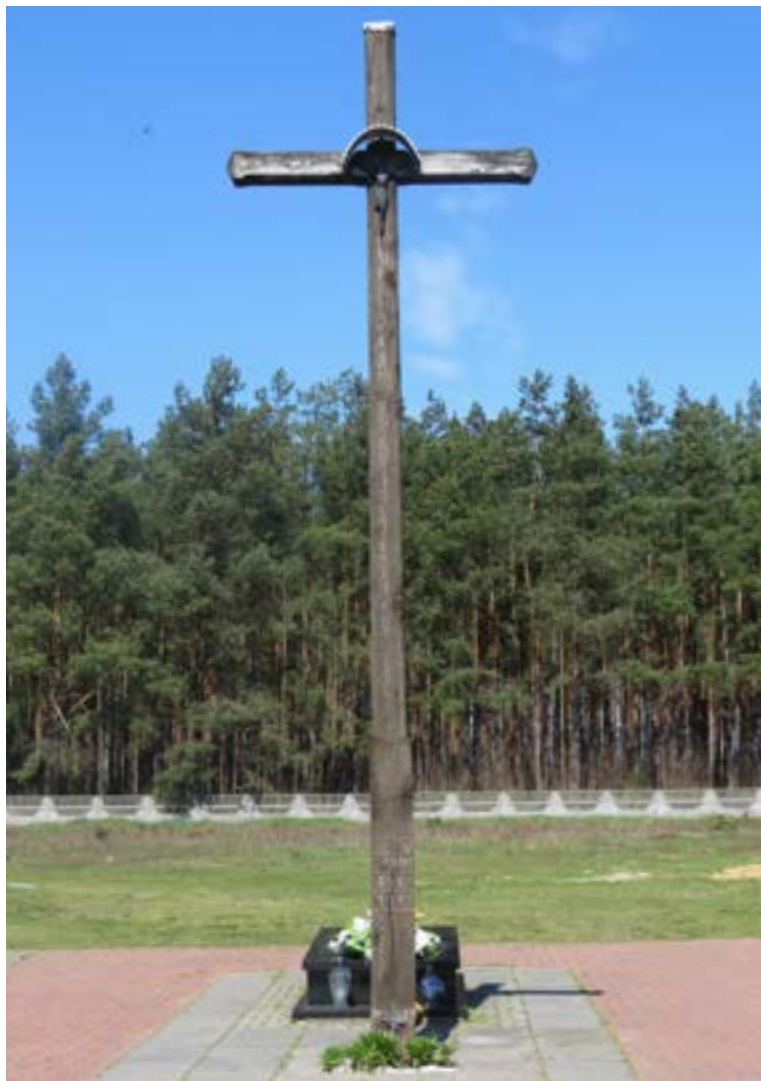
Lokalizacja: Krubin (na terenie cmentarza); Czas powstania: 1943 r., 1947 r., 2000 r.

K rzyż drewniany z figurą Chrystusa osłoniętą blaszonym daszkiem. Na pionowej belce daty: „22 V 2000, 1947, 1943”. Ustawiony na betonowym podłożu.