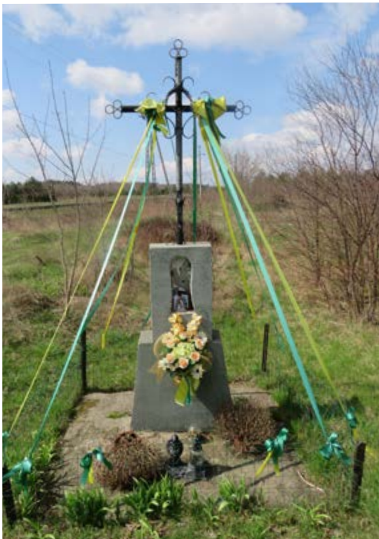
Lokalizacja: Łajski, ul. Kościelna (przy torach kolejowych); Czas powstania: brak danych;

K rzyż żelazny z figurą Chrystusa osłoniętą blaszanym daszkiem. Krzyż gałkowy, z ażurowymi zdobieniami wzdłuż obydwu ramion. Ustawiony na dwustopniowym cokole z wnęką. We wnęce m.in. obrazek z wizerunkiem św. Antoniego z Padwy.