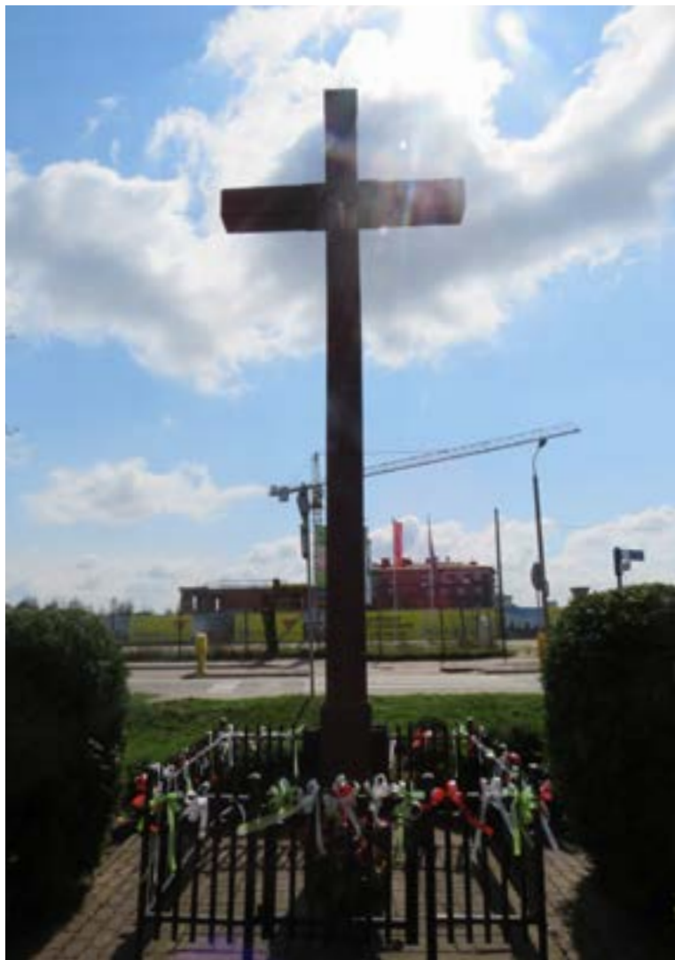
Lokalizacja: Skrzeszew, ul. Modlińska/Słoneczna; Czas powstania: brak danych;

K rzyż drewniany z figurą Chrystusa osłoniętą blaszanym daszkiem.