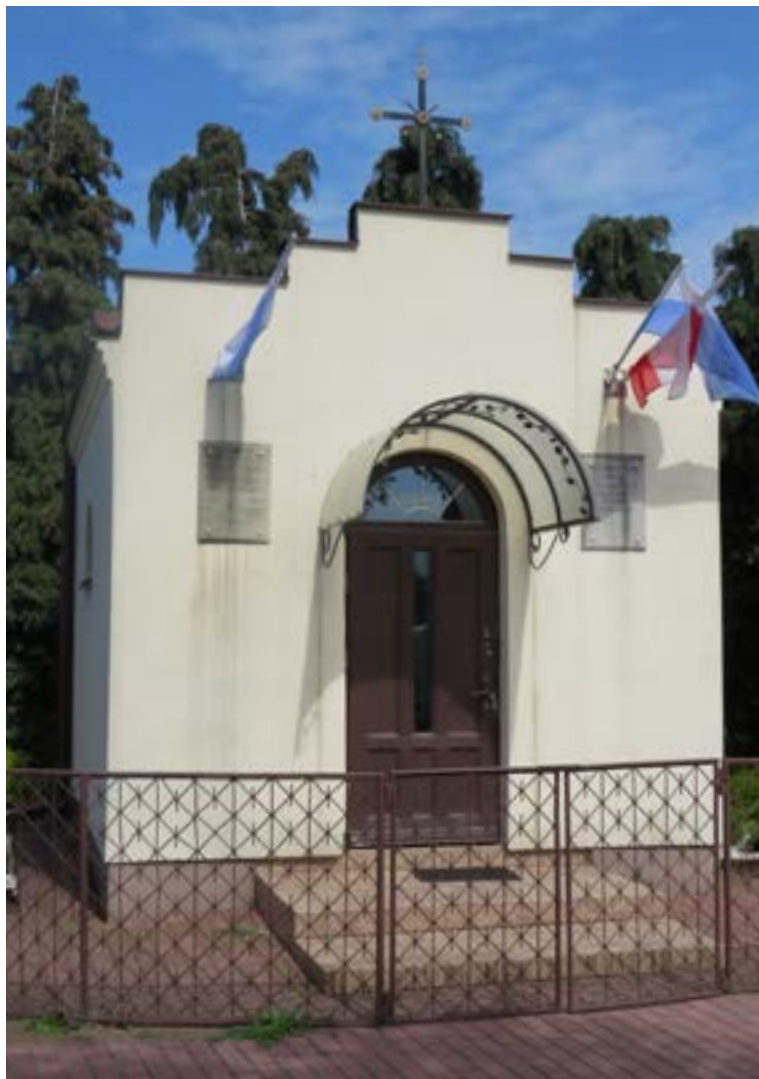
Lokalizacja: Olszewnica Stara, ul. 11 listopada; Czas powstania: 1857 r., 1984 r.;

K apliczka murowana domkowa. Dach zwieńczony krzyżem żelaznym, promienistym, gałkowym. Wewnątrz m.in. figury Matki Bożej Niepokalanej i św. Jana Nepomucena.