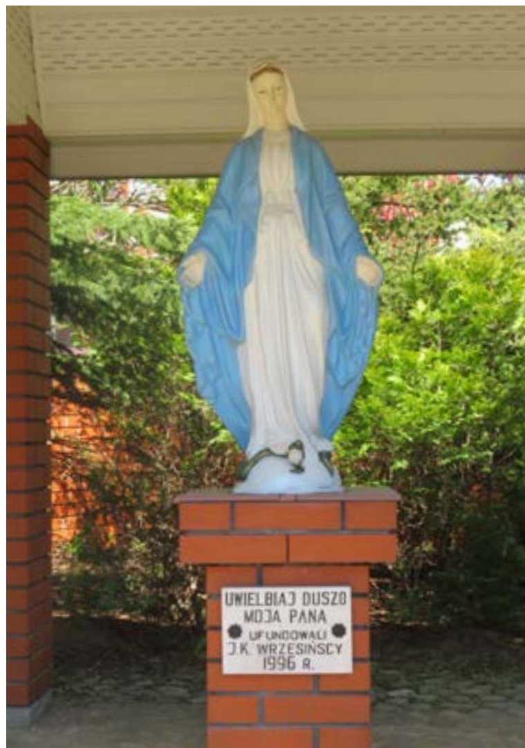
Lokalizacja: Janówek Pierwszy, ul. Jaśminowa; Czas powstania: 1996 r.

K rzyż drewniany. Na poziomej belce napis: „MISJE ŚWIĘTE”. Na pionowej belce wyryta data: 10-17.02.2002 R.