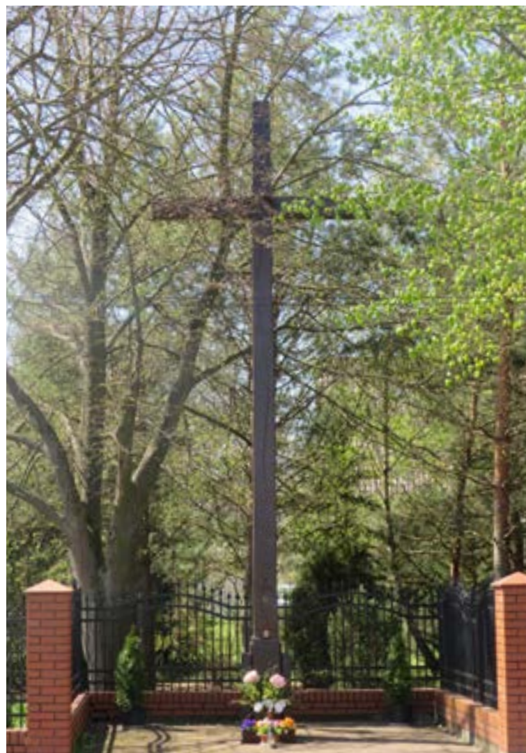
Lokalizacja: Olszewnica Stara (na końcu miejscowości przy granicy z Chotomowem, gm. Jabłonna) Czas powstania: 2008 r.;

K rzyż drewniany z figurą Chrystusa. Na pionowej belce data: „1959”.