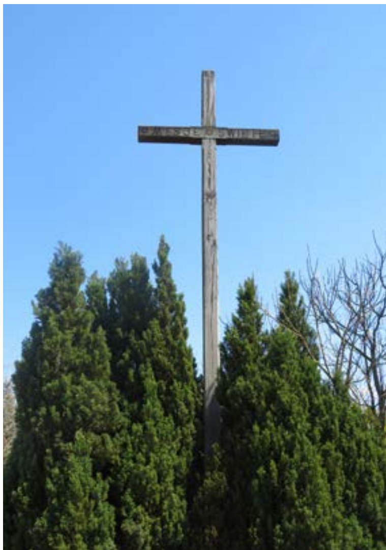
Lokalizacja: Janówek Pierwszy, ul. Jaśminowa (przy kościele); Czas powstania: 2002 r.

K rzyż drewniany. Na poziomej belce napis: „MISJE ŚWIĘTE”. Na pionowej belce wyryta data: 10-17.02.2002 R.