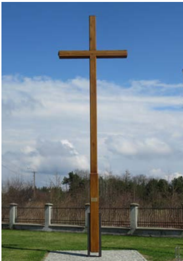
Lokalizacja: Skrzeszew, ul. Dojazdowa (przy kościele p.w. Jana Marii Vianneya); Czas powstania: 2019 r.

K rzyż drewniany. Na pionowej belce tabliczka z napisem: „PAMIĄTKA PIERWSZYCH MISJI ŚWIĘTYCH 5-9 GRUDNIA 2019”.