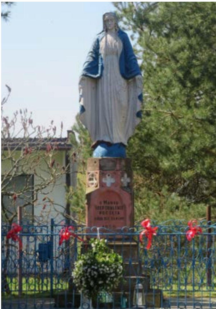
Lokalizacja: Olszewnica Stara, ul. Warszawska; Czas powstania: 1904 r., 1950 r.;

F igura Matki Bożej Niepokalanej na murowanym, wielostopniowym cokole. Od frontu na cokole napis: „O MARIO NIEPOKALENIE PO-CZĘTA MÓDL SIĘ ZA NAMI 1950”. Poniżej data: „1904”. Ogrodzona żelaznym płotkiem.