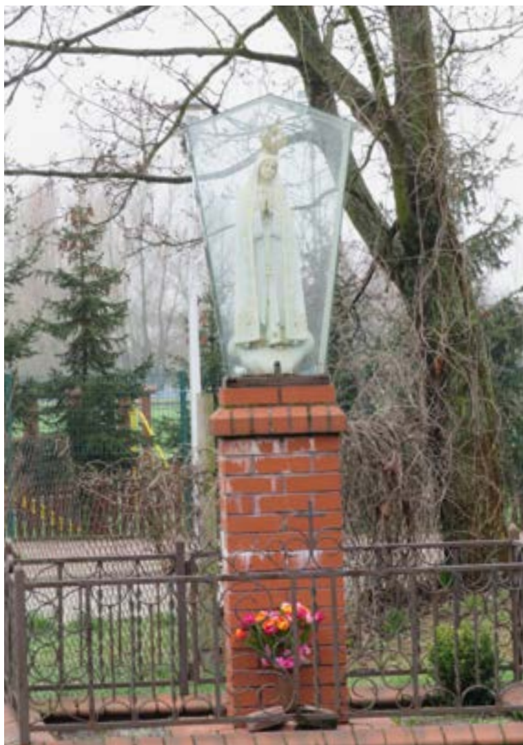
Lokalizacja: Wieliszew, ul. Modlińska; Czas powstania: brak danych;

K apliczka w typie przeszklonej latarni z figurą Matki Bożej Fatimskiej. Ustawiona na murowanym cokole. Ogrodzona żelaznym płotkiem.