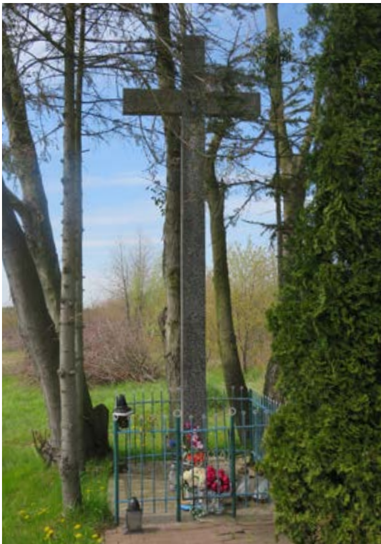
Lokalizacja: Sikory; Czas powstania: 1984 r.

K rzyż betonowy z figurą Chrystusa. Na żelaznym ogrodzeniu od frontu data: „1984”.