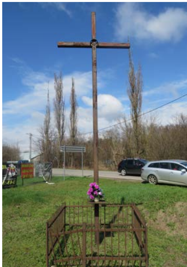
Lokalizacja: Skrzyszew, ul. Kościelna (koniec miejscowości przy granicy z N. Dworem Maz.) Czas powstania: brak danych;

K rzyż drewniany z figurą Chrystusa. Na pionowej belce mało czytelny napis: „NAJŚWIĘTSZE SERCE JEZUSOWE”, a na belce poziomej: „ZMIŁUJ SIĘ NAD NAMI”. Na pionowej belce nieczytelna data oraz niewielki krzyż drewniany z figurą Chrystusa i medalion z wizerunkiem Matki Bożej, orła i datą 2000. Przy krzyżu figura nn świętego z czaszką. Ogrodzony żelaznym płotkiem.