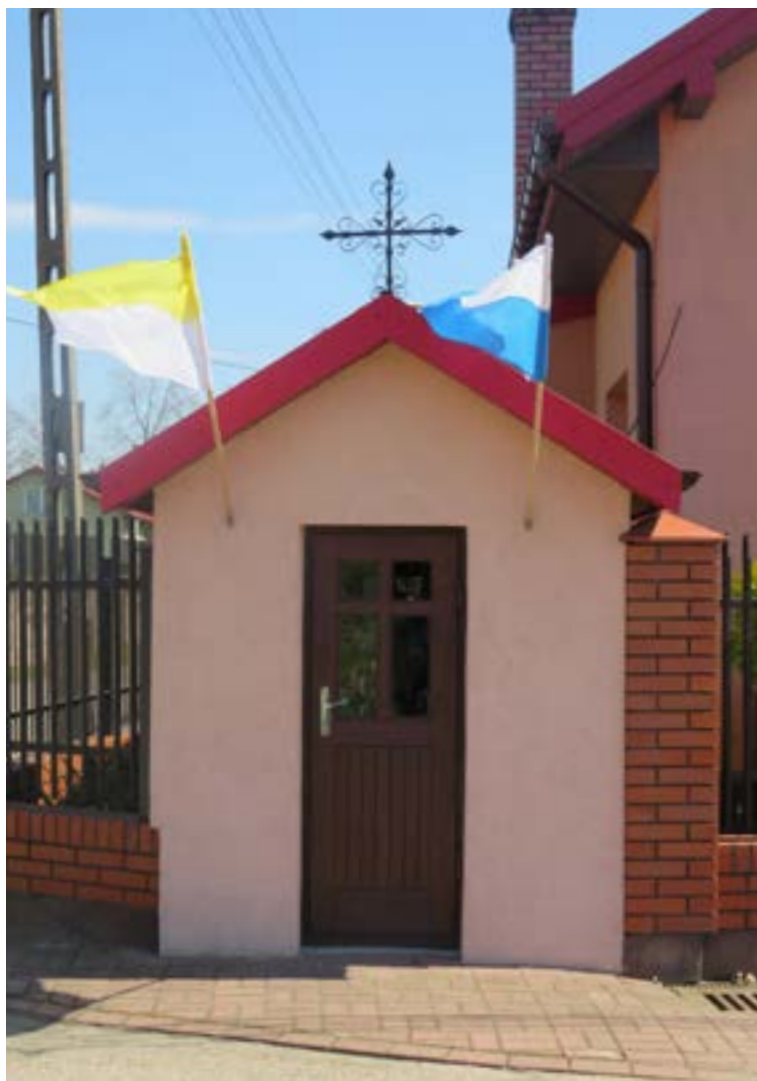
Lokalizacja: Kałuszyn, ul. Jeziorna; Czas powstania: brak danych;

K apliczka murowana domkowa z daszkiem dwuspadowym, zwieńczonym krzyżem żelaznym. Krzyż z ażurowymi zdobieniami i sercowatymi zakończeniami ramion. Wewnątrz obrazy m.in. z wizerunkami Matki Bożej Częstochowskiej, Matki Bożej Karmiącej, św. Jana Pawła II oraz figury MB Niepokalanej, MB Fatimskiej i aniołków.