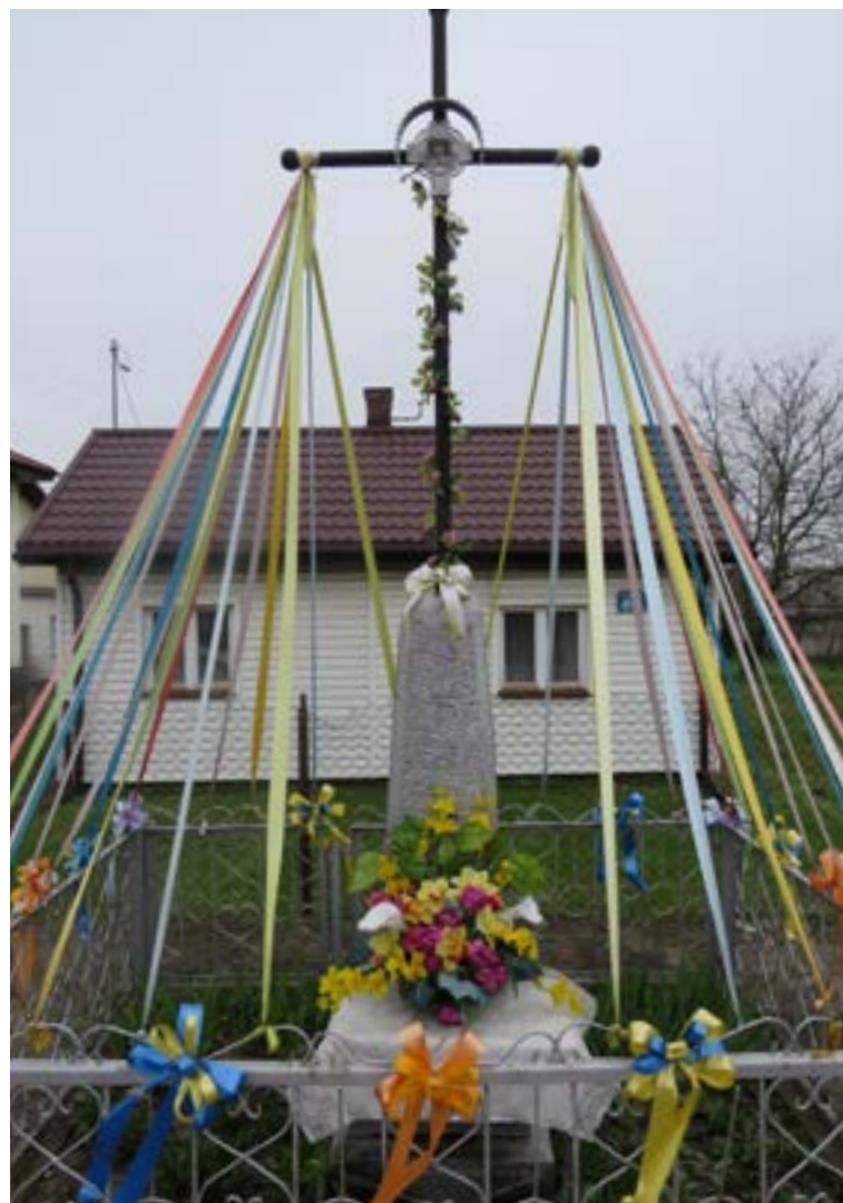
Lokalizacja: Wieliszew, ul. Modlińska 64; Czas powstania: brak danych;

F igura Św. Jana Pawła II na murowanym cokole. Na cokole napis: „JAN PAWEŁ II 1920 – 2005”.