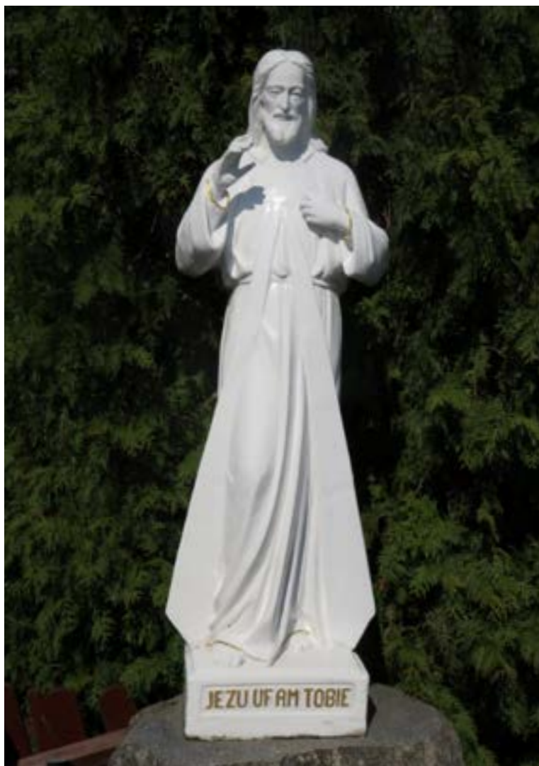
Lokalizacja: Skrzeszew, ul. Kościelna 60; Czas powstania: brak danych;

F igura Pana Jezusa na murowanym cokole. Na cokole napis: „JEZU UFAM TOBIE”.