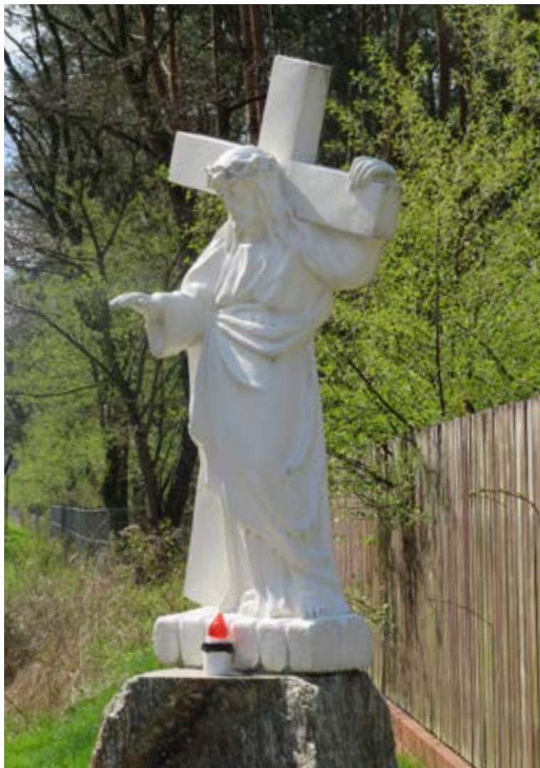
Lokalizacja: Kałuszyn, ul. Wiosenna 2; Czas powstania: 2019 r.

F igura Chrystusa dźwigającego krzyż na kamiennym cokole. Od frontu na cokole słowa: „WIESZ, ŻE CIĘ KOCHAM”. Poniżej na tablicy napis: „CZŁOWIEK JEST MOCNY WTEDY KIEDY WIE, ŻE JEST KOCHANY”. Pod tablicą data: „14.09.2019”.