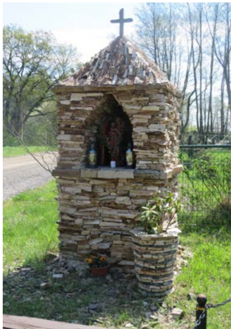
Lokalizacja: Skrzyszew, ul. Janiny Czas powstania: brak danych;

K rzyż żelazny z figurą Chrystusa osłoniętą blaszanym daszkiem. Krzyż z ażurowymi zdobieniami wzdłuż obydwu ramion. Cokół murowany, wielostopniowy. Od frontu na najwyższym stopniu cokołu napis: „1914 1918 1920 W KRZYŻU CIERPIENIE PRZEZ KRZYŻ ZMARTWYCH- WSTANIE WYBUDOWA-NY 1922 R.” Ustawiony na betonowym podłożu. Ogródzony żelaznym płotkiem.