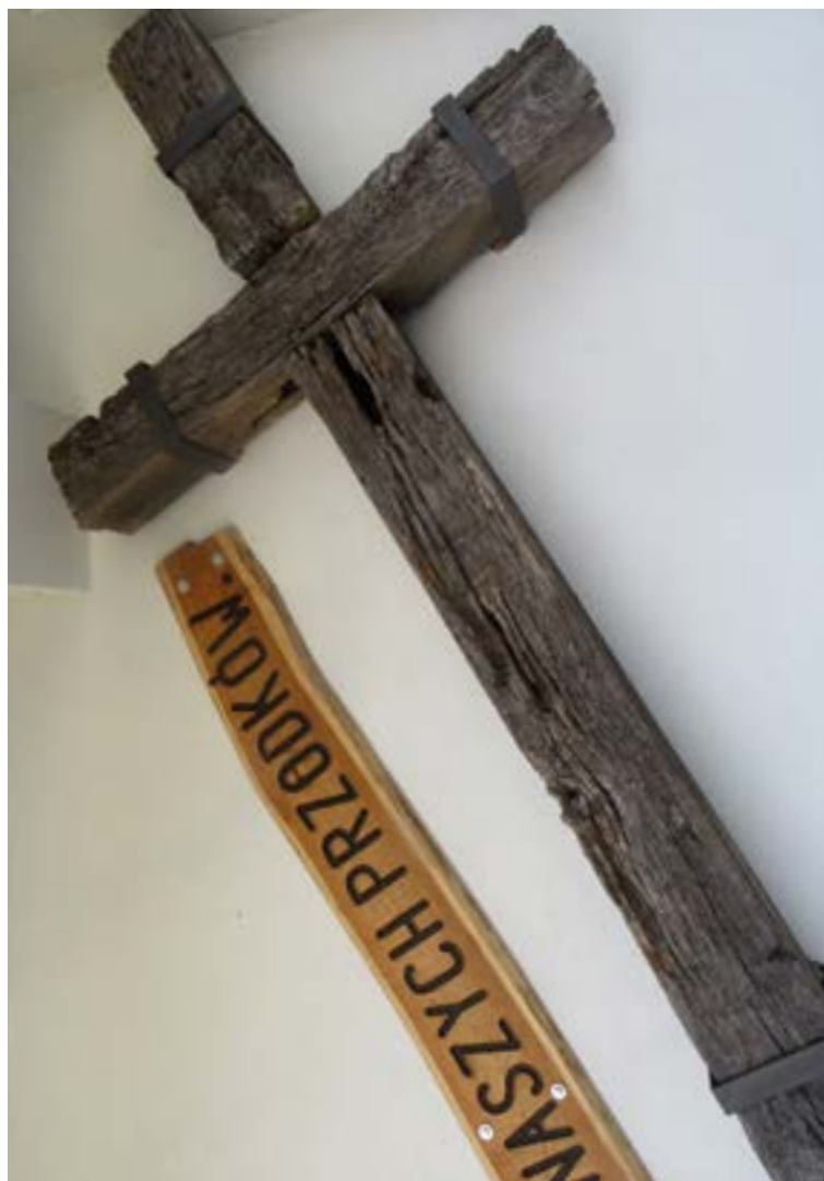
Lokalizacja: Skrzeszew, ul. Dojazdowa (przy kościele p.w. Jana Marii Vianneya); Czas powstania: brak danych;

K rzyż drewniany. Na pionowej belce tabliczka z napisem: „PAMIĄTKA PIERWSZYCH MISJI ŚWIĘTYCH 5-9 GRUDNIA 2019”.