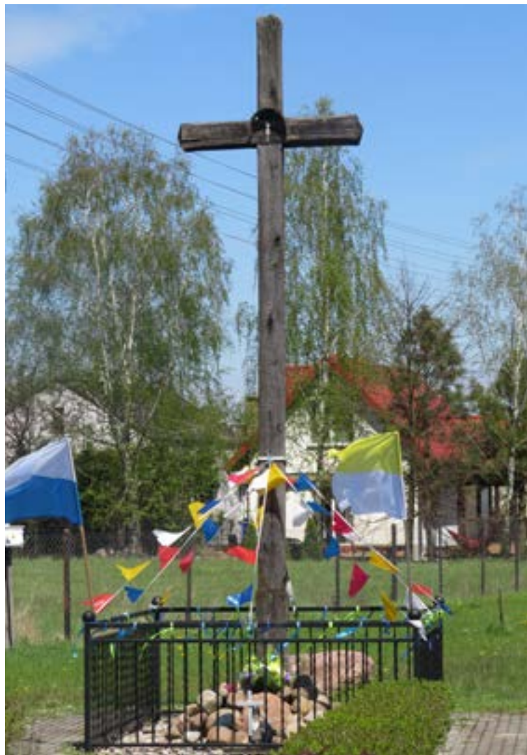
Lokalizacja: Krubin, ul. Witosa; Czas powstania: brak danych;

K rzyż drewniany z figurą Chrystusa osłoniętą blaszonym daszkiem. Na pionowej belce daty: „22 V 2000, 1947, 1943”. Ustawiony na betonowym podłożu.