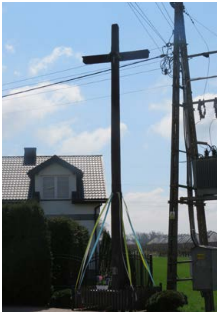
Lokalizacja: Skrzeszew, ul. Kościelna; Czas powstania: 1981 r.;

F igura Pana Jezusa na murowanym cokole. Na cokole napis: „JEZU UFAM TOBIE”.