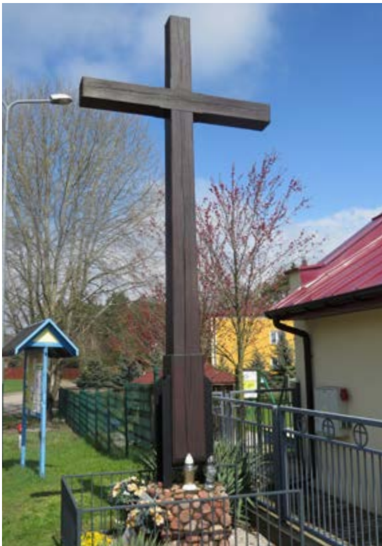
Lokalizacja: Katuszyn, ul. Mickiewicza; Czas powstania: brak danych;

K rzyż drewniany na cokole z kamieni polnych. Ogrodzony żelaznym płotkiem.