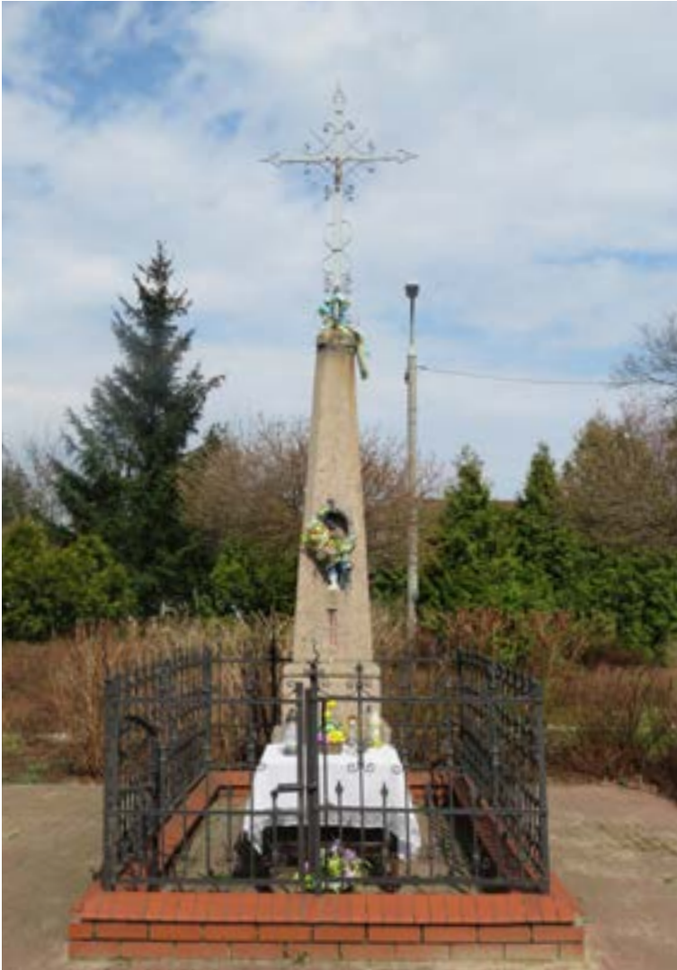
Lokalizacja: Łajski, ul. Kościelna/Nowodworska, skwer im. St. Pączkowskiego; Czas powstania: 1906 r.

K rzyż żelazny promienisty z figurą Chrystusa. Wzdłuż ramion krzyża ażurowe zdobienia. Cokół granitowy z wnęką, zwężający się ku górze. We wnęce figura Matki Bożej Niepokalanej. Poniżej na cokole data: „1906”. Ustawiony na betonowym podłożu. Ogródzony żelaznym płotkiem.