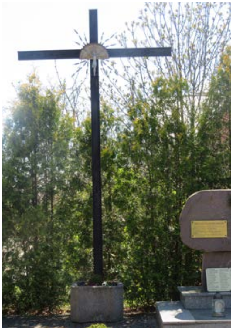
Lokalizacja: Janówek Pierwszy, ul. Jaśminowa (przy kościele); Czas powstania: brak danych;

K rzyż żelazny, promienisty, z figurą Chrystusa osłoniętą blaszanym daszkiem. Ustawiony na betonowym podłożu.