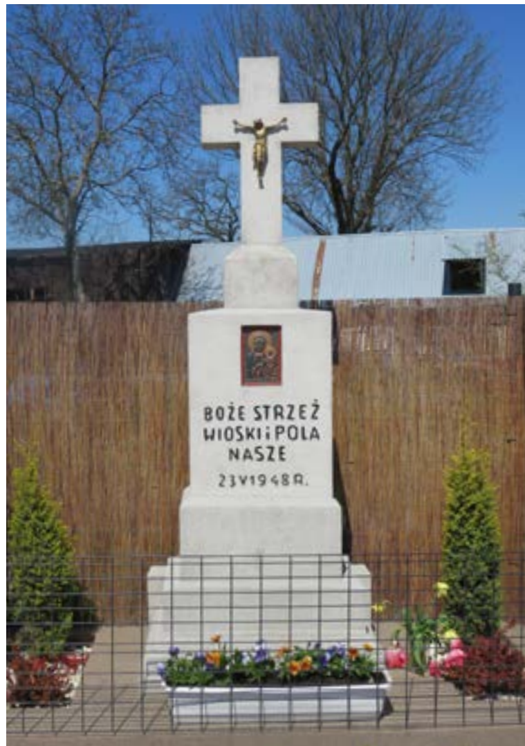
Lokalizacja: Góra; Czas powstania: 1948 r.

K rzyż murowany z figurą Chrystusa na murowanym cokole. Od frontu na cokole wnęka z obrazem z wizerunkiem Matki Bożej Częstochowskiej. Pod wnęką napis „BOŻE STRZEŻ WIOSKI I POLA NASZE 23 V 1948 R.”