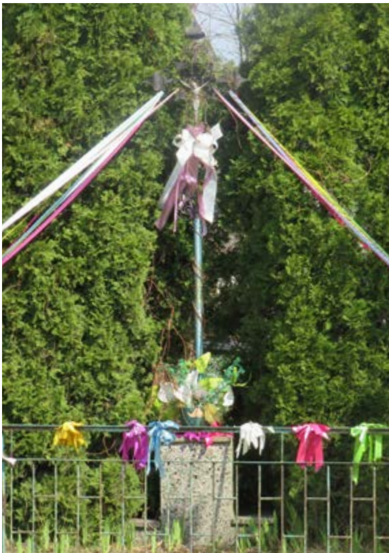
Lokalizacja: Michałów Reginów, ul. Nowodworska; Czas powstania: brak danych;

K rzyż żelazny z figurą Chrystusa na murowanym cokole. Figura osłonięta blaszanym daszkiem. Krzyż promienisty, z sercowatymi zakończeniami ramion, ażurowymi zdobieniami oraz relingami wzdłuż pionowej belki.