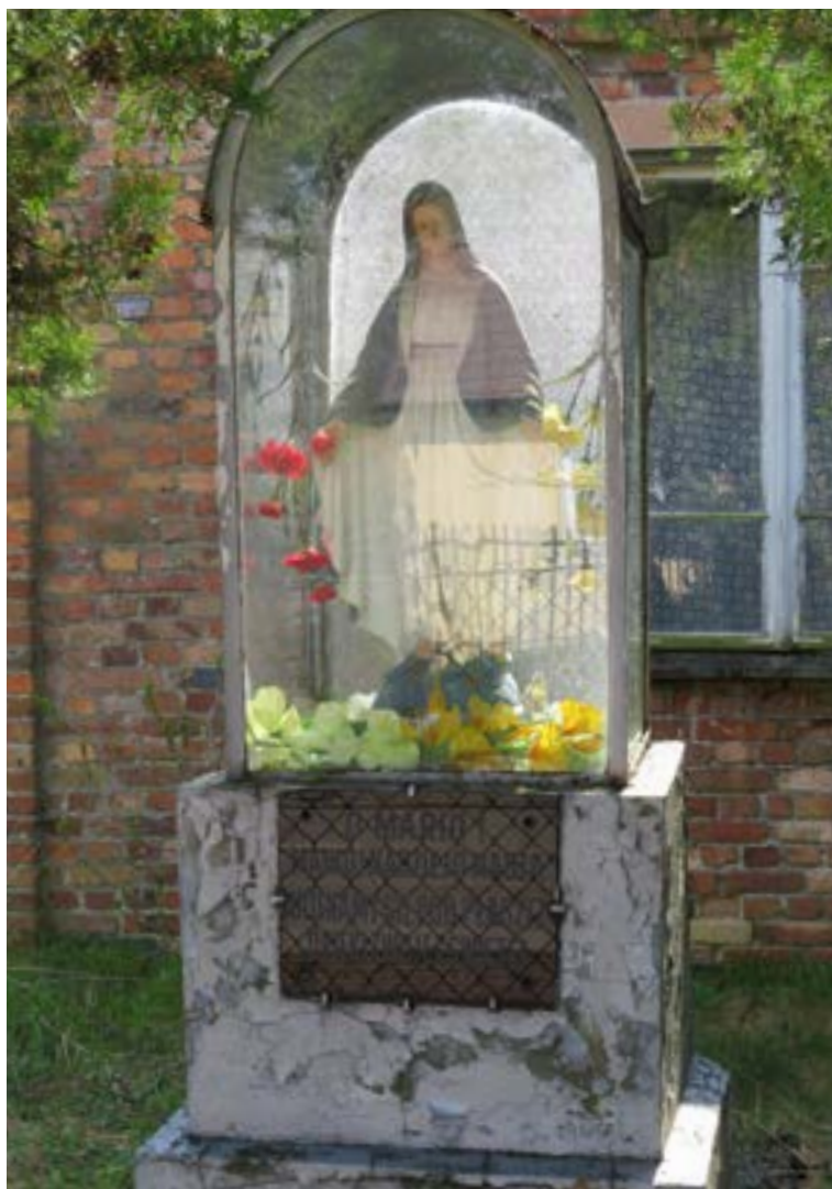
Lokalizacja: Kałuszyn, ul. Mickiewicza; Czas powstania: brak danych;

K apliczka w typie przeszklonej latarni z półokrągłym daszkiem. We wnętrzu figura Matki Bożej Niepokalanej. Od frontu pod wnęką tablica z napisem: „O MARIO! MATKO NADZIEJO NASZA UCIEKAMY SIĘ POD PŁASZCZ OPIEKI TWOJEJ ŚWIĘTEJ”.