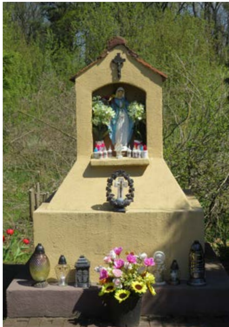
Lokalizacja: Góra; Czas powstania: brak danych;

K apliczka drewniana wisząca na drzewie. Dwuspadowy daszek zwieńczony krzyżem. We wnęce obraz z wizerunkiem Jezusa w cierniowej koronie.