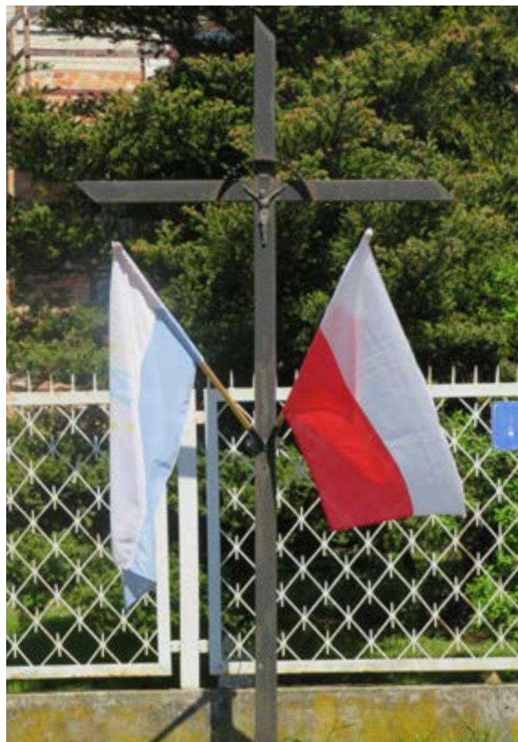
Lokalizacja: Kałuszyn, ul. Łabędziowa; Czas powstania: brak danych;

K apliczka murowana domkowa z daszkiem dwuspadowym, zwieńczonym krzyżem żelaznym. Krzyż z ażurowymi zdobieniami i sercowatymi zakończeniami ramion. Wewnątrz obrazy m.in. z wizerunkami Matki Bożej Częstochowskiej, Matki Bożej Karmiącej, św. Jana Pawła II oraz figury MB Niepokalanej, MB Fatimskiej i aniołków.