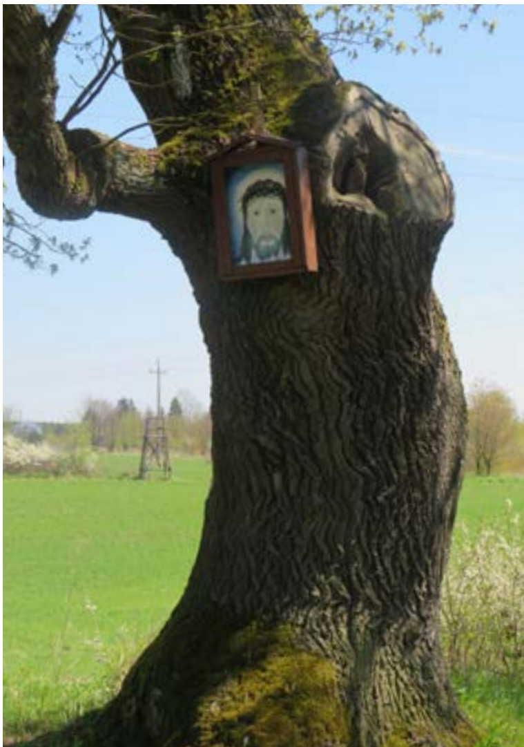
Lokalizacja: Góra; ul. Rzeczna; Czas powstania: brak danych;

K apliczka drewniana wisząca na drzewie. Dwuspadowy daszek zwieńczony krzyżem. We wnęce obraz z wizerunkiem Jezusa w cierniowej koronie.