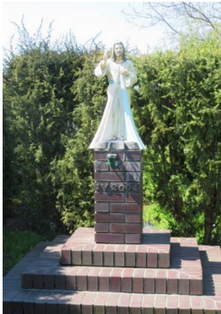
Lokalizacja: Olszewnica Stara, ul. Warszawska 48; Czas powstania: 2004 r.;

K apliczka murowana domkowa. Dach zwieńczony krzyżem żelaznym, promienistym, gałkowym. Wewnątrz m.in. figury Matki Bożej Niepokalanej i św. Jana Nepomucena.