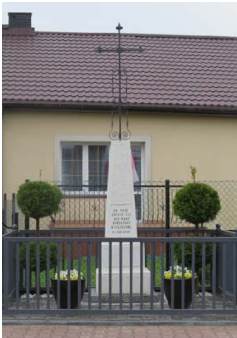
Lokalizacja: Wieliszew, ul. Niepodległości 63; Czas powstania: 1929 r.;

K rzyż żelazny z sercowatymi zakończeniami ramion i ażurowymi zdobieniami wzdłuż pionowej belki. Na murowanym, kilkustopniowym, zwężającym się do góry cokole napis: „ŚW. BOŻE ZMIŁUJ SIĘ NAD NAMY FUNDATORY WIELISZEWA W 1929 ROKU”.