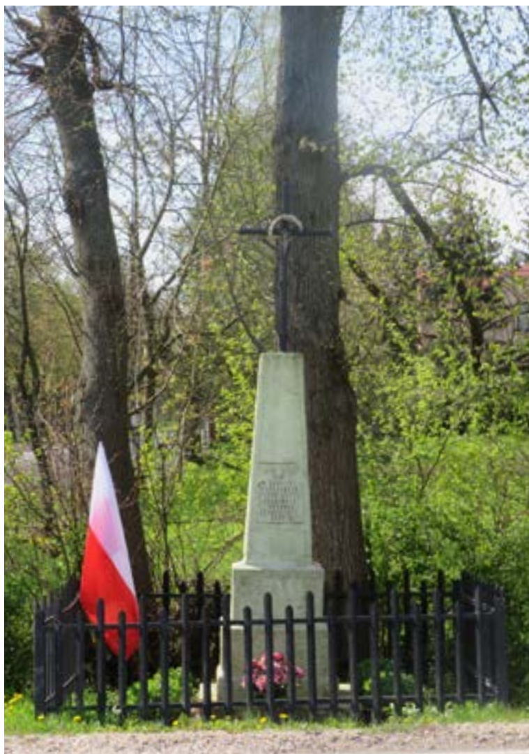
Lokalizacja: Skrzyszew, ul. Nowodworska/ Szkolna; Czas powstania: 1922 r.

K rzyż żelazny z figurą Chrystusa osłoniętą blaszanym daszkiem. Krzyż z ażurowymi zdobieniami wzdłuż obydwu ramion. Cokół murowany, wielostopniowy. Od frontu na najwyższym stopniu cokołu napis: „1914 1918 1920 W KRZYŻU CIERPIENIE PRZEZ KRZYŻ ZMARTWYCH- WSTANIE WYBUDOWA-NY 1922 R.” Ustawiony na betonowym podłożu. Ogródzony żelaznym płotkiem.