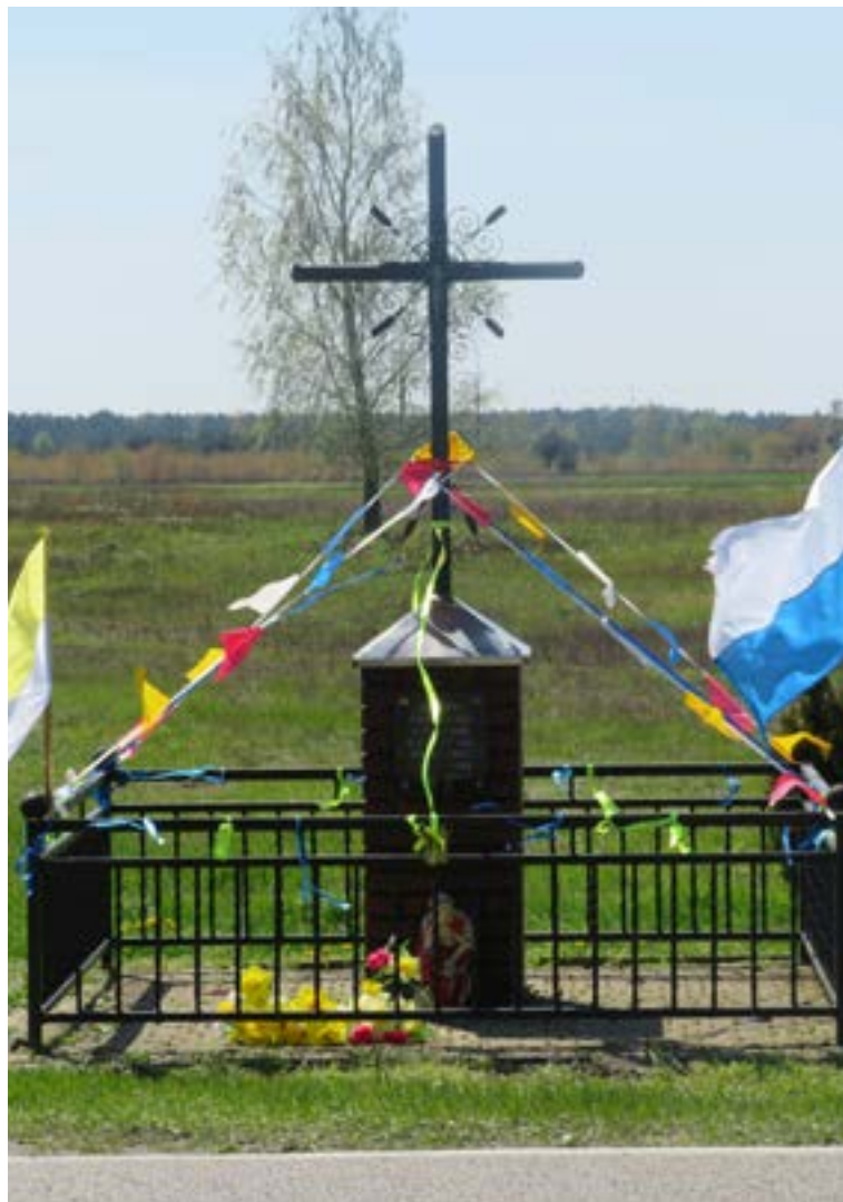
Lokalizacja: Krubin, ul. Nowodworska 5; Czas powstania: 1953 r.

K rzyż żelazny, promienisty z figurą Chrystusa, z ozdobnymi ornamentami wzdłuż obydwu belek: pionowej i poziomej. Ustawiony na murywanym cokole. Od frontu na cokole tablica z napisem: „O JEZU ZMIŁUJ SIĘ NAD NAMI, KTÓRZY SIĘ DO CIEBIE UCIEKAMY 20 V 1953 R.” Przy cokole figurka Chrystusa Frasobliwego.