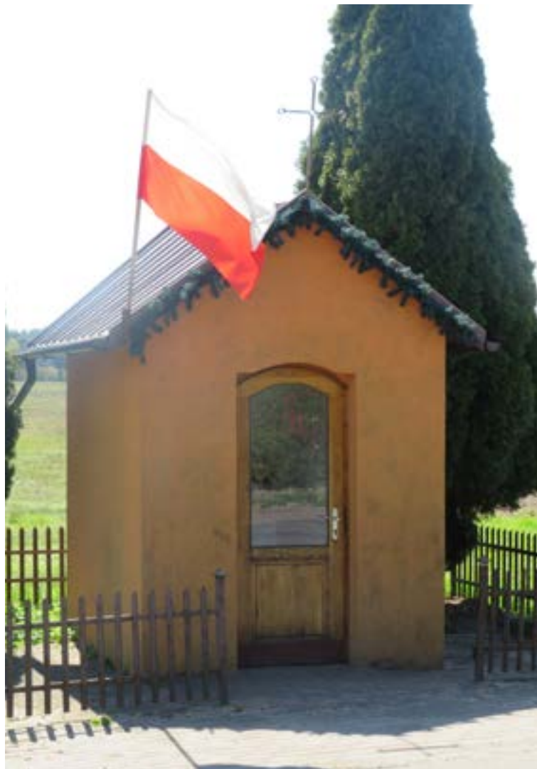
Lokalizacja: Olszewnica Nowa, ul. Spacerowa/Nowodworska; Czas powstania: brak danych;

K apliczka murowana domkowa. Dwuspadowy daszek zwieńczony żelaznym krzyżem. Wewnątrz figura Matki Bożej Różańcowej oraz obraz w wizerunkiem Najświętszego Serca Jezusa.