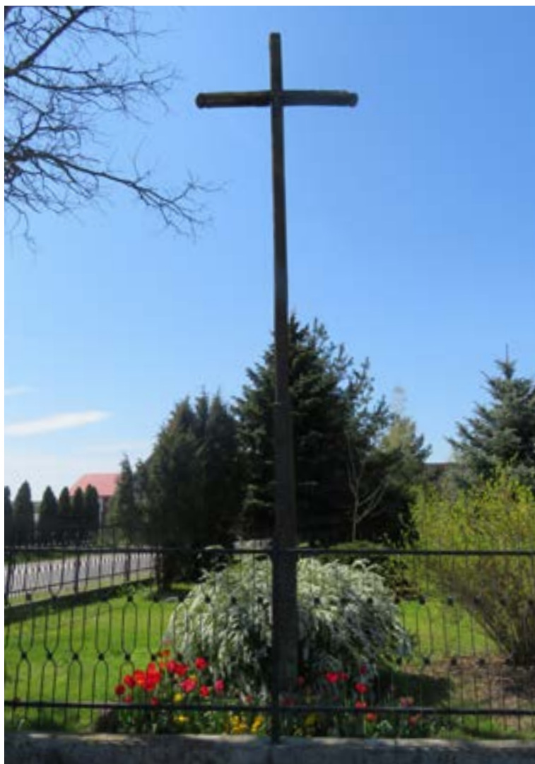
Lokalizacja: Olszewnica Stara, ul. Warszawska/Polna; Czas powstania: 1959 r.;

K rzyż drewniany z figurą Chrystusa. Na pionowej belce data: „1959”.