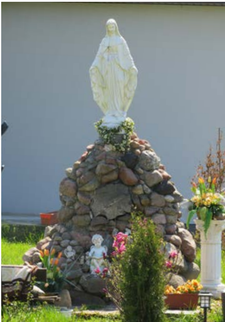
Lokalizacja: Skrzeszew; Czas powstania: brak danych;

F igura Najświętszej Maryi Panny na cokole z kamieni polnych.