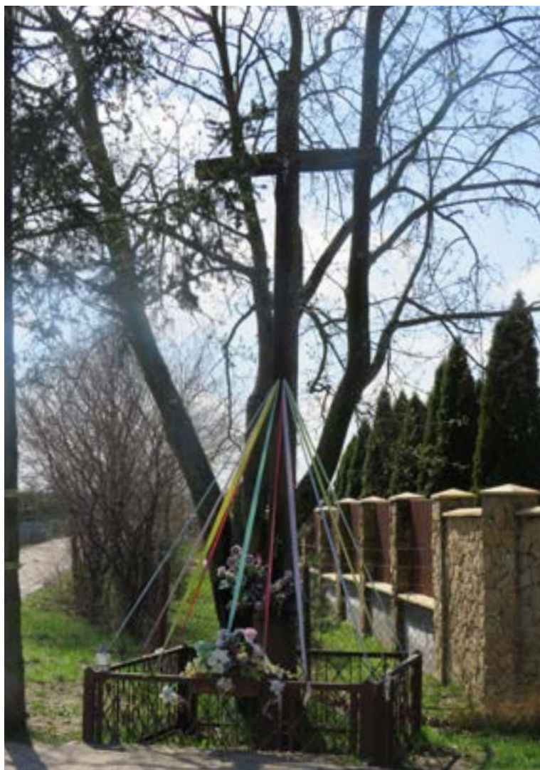
Lokalizacja: Skrzyszew, ul. Kościelna/Rozwojowa; Czas powstania: brak danych;

K rzyż drewniany z figurą Chrystusa. Na pionowej belce mało czytelny napis: „NAJŚWIĘTSZE SERCE JEZUSOWE”, a na belce poziomej: „ZMIŁUJ SIĘ NAD NAMI”. Na pionowej belce nieczytelna data oraz niewielki krzyż drewniany z figurą Chrystusa i medalion z wizerunkiem Matki Bożej, orła i datą 2000. Przy krzyżu figura nn świętego z czaszką. Ogrodzony żelaznym płotkiem.