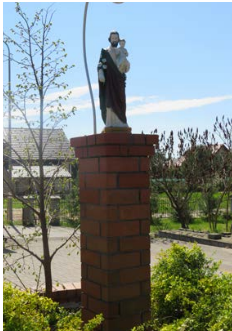
Lokalizacja: Janówek Pierwszy, ul. Jaśminowa (przy kościele); Czas powstania: brak danych;

K rzyż żelazny, promienisty, z figurą Chrystusa osłoniętą blaszanym daszkiem. Ustawiony na betonowym podłożu.