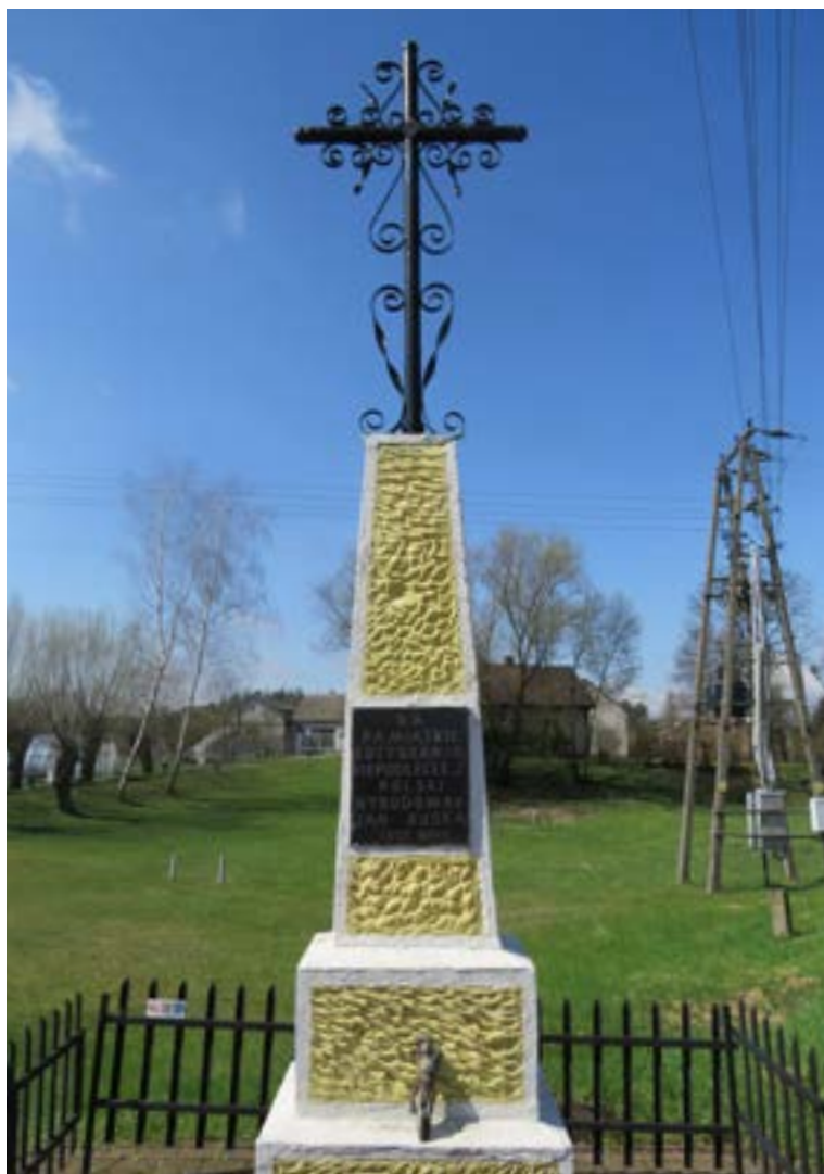
Lokalizacja: Skrzyszew; Czas powstania: 1922 r.;