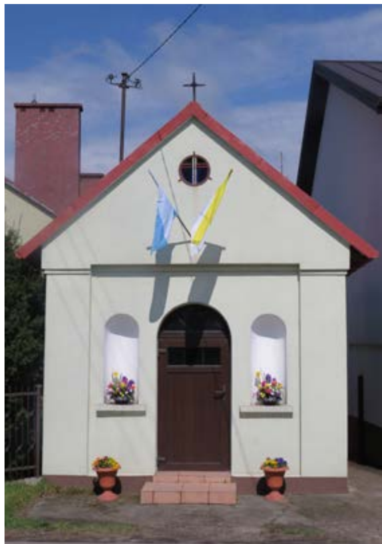
Lokalizacja: Skrzyszew, ul. Kościelna 73; Czas powstania: 2008 r.;