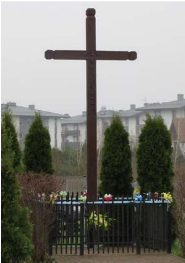
Lokalizacja: Wieliszew, ul. Modlińska/ al. Solidarności; Czas powstania: 1995 r.

K rzyż drewniany gałkowy z figurą Chrystusa. Po obu stronach figury data „1995”. Poniżej figury symbole Męki Pańskiej. Ogrodzony żelaznym płotkiem.