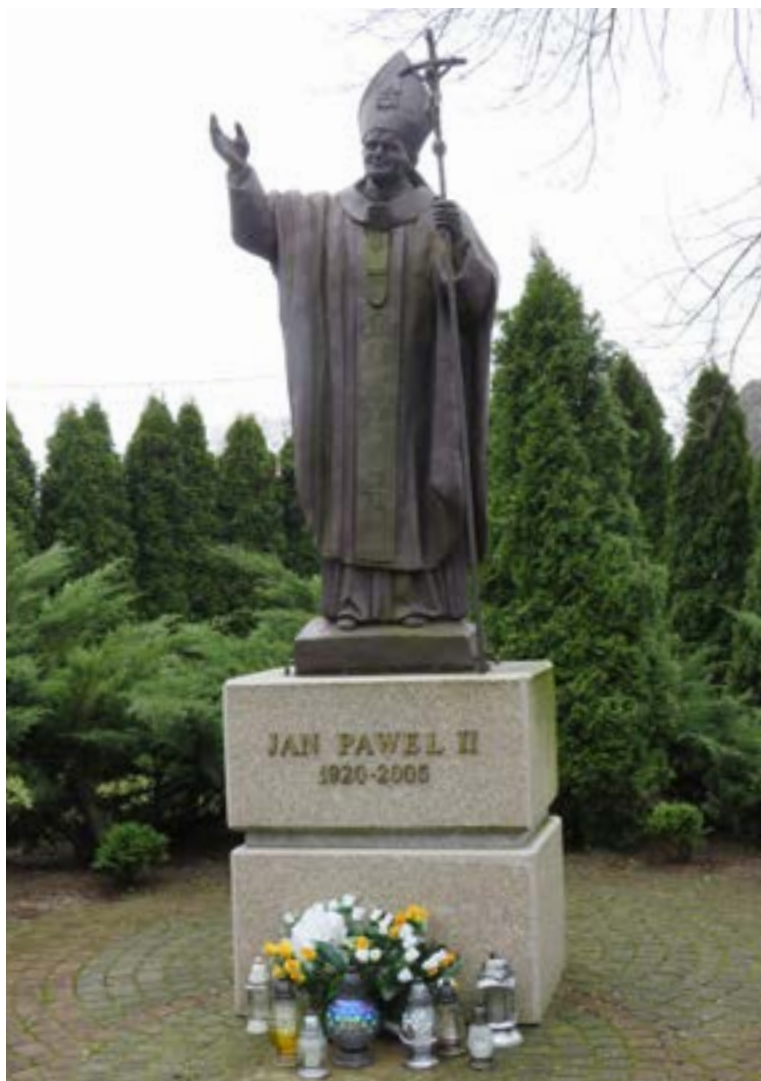
Lokalizacja: Wieliszew, ul. Modlińska (przy kościele Przemienienia Pańskiego) Czas powstania: brak danych;

F igura Św. Jana Pawła II na murowanym cokole. Na cokole napis: „JAN PAWEŁ II 1920 – 2005”.