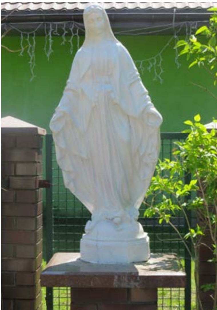
Lokalizacja: Janówek Pierwszy, ul. Słoneczna; Czas powstania: brak danych;

F igura Matki Bożej Niepokalanej na murowanym cokole.