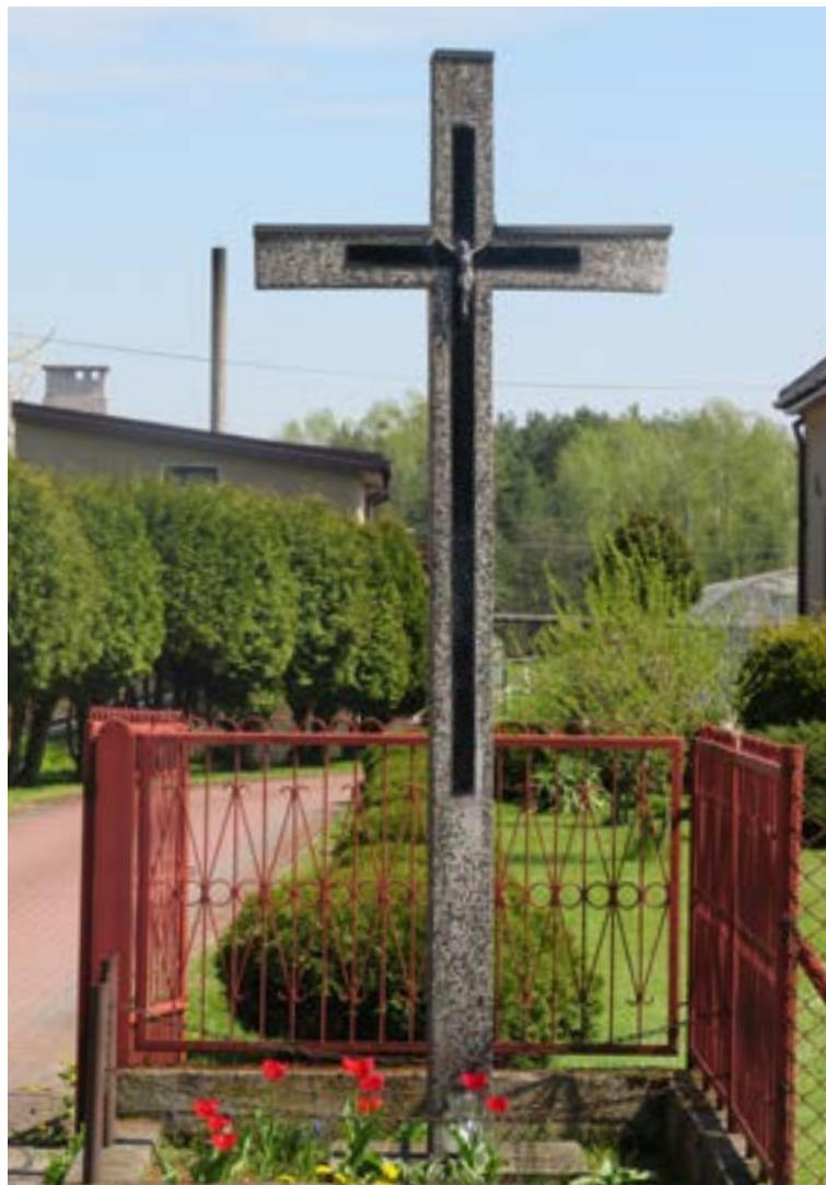
Lokalizacja: Olszewnica Stara, ul. Warszawska; Czas powstania: 1904 r., 1950 r.;

F igura Matki Bożej Niepokalanej na murowanym, wielostopniowym cokole. Od frontu na cokole napis: „O MARIO NIEPOKALENIE PO-CZĘTA MÓDL SIĘ ZA NAMI 1950”. Poniżej data: „1904”. Ogrodzona żelaznym płotkiem.