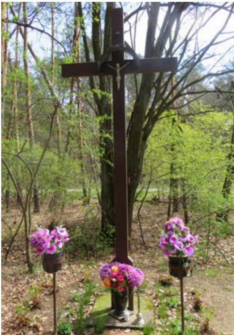
Lokalizacja: Katuszyn, ul. Wczasowa; Czas powstania: brak danych;

K rzyż z figurą Chrystusa osłoniętą blaszanym daszkiem.