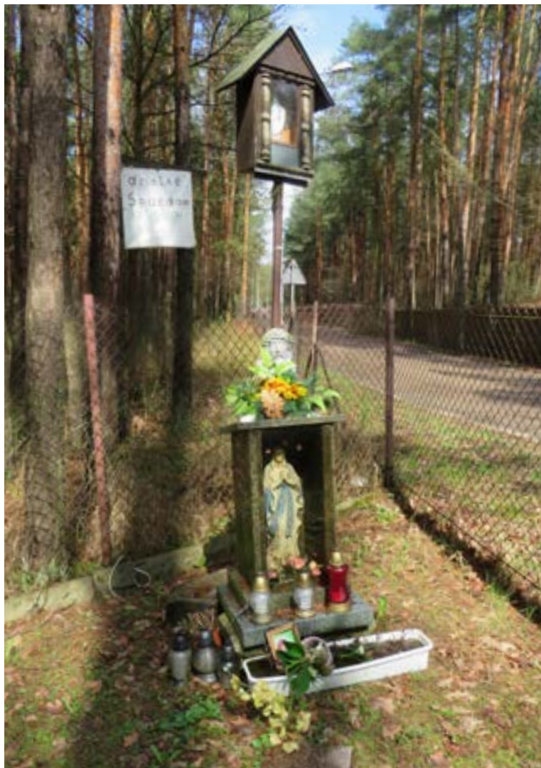
Lokalizacja: Poddębnie, ul. Radosna/Konwaliowa; Czas powstania: brak danych;

K apliczka drewniana, słupowa na murowanym cokole stanowiącym kapliczkę-wnękę z figurą Matki Bożej Różańcowej. Kapliczka z dwuspadowym daszkiem, w zamkniętej szybie wewnątrz figura Matki Bożej Niepokalanej. Na stojącej na ziemi, murowanej kapliczce rzeźba przedstawiająca Chrystusa w cierniowej koronie.