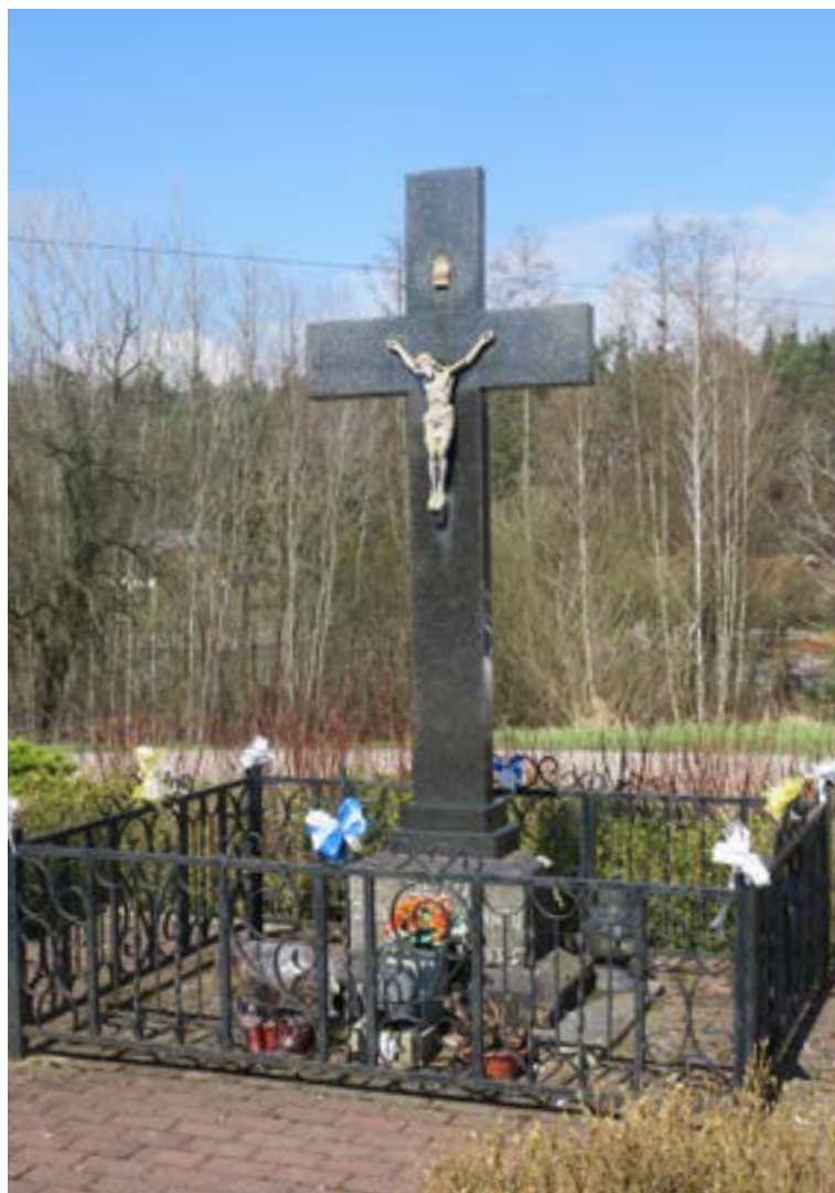
Lokalizacja: Kałuszyn, ul. Mickiewicza/Nowodworska; Czas powstania: 1939 r.

K apliczka w typie przeszklonej latarni z półokrągłym daszkiem. We wnętrzu figura Matki Bożej Niepokalanej. Od frontu pod wnęką tablica z napisem: „O MARIO! MATKO NADZIEJO NASZA UCIEKAMY SIĘ POD PŁASZCZ OPIEKI TWOJEJ ŚWIĘTEJ”.