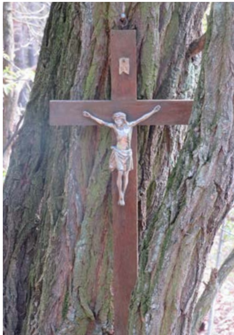
Lokalizacja: Katuszyn, ul. Wczasowa; Czas powstania: brak danych;

K rzyż z figurą Chrystusa osłoniętą blaszanym daszkiem.