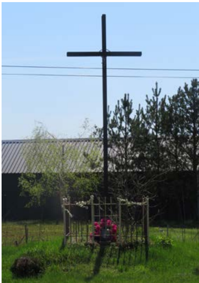
Lokalizacja: Olszewnica Nowa, ul. Nowodworska; Czas powstania: brak danych;