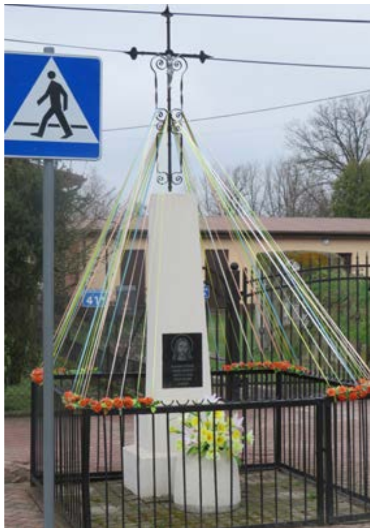
Lokalizacja: Wieliszew, ul. Niepodległości/Żytnia; Czas powstania: 1929 r.;

K rzyż żelazny z figurą Chrystusa osłoniętą blaszanym daszkiem. Wzdłuż ramion krzyża relingi i ażurowe zdobienia. Na murowanym, wielostopniowym zwężającym się do góry cokole napis: „OD POWIETRZA GŁODU OGNIA I WOJNY WYBAW NAS PANIE WYBUDOWA-NO W 1929 ROKU”. Ogrodzony żelaznym płotkiem.