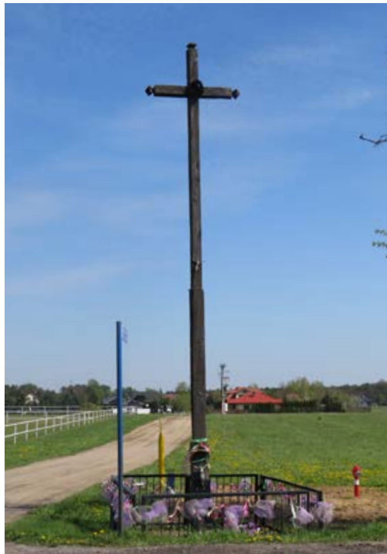
Lokalizacja: Skrzeszew, ul. Rozwojowa/Nowodworska; Czas powstania: brak danych;

K rzyż drewniany z figurą Chrystusa osłoniętą blaszanym daszkiem.