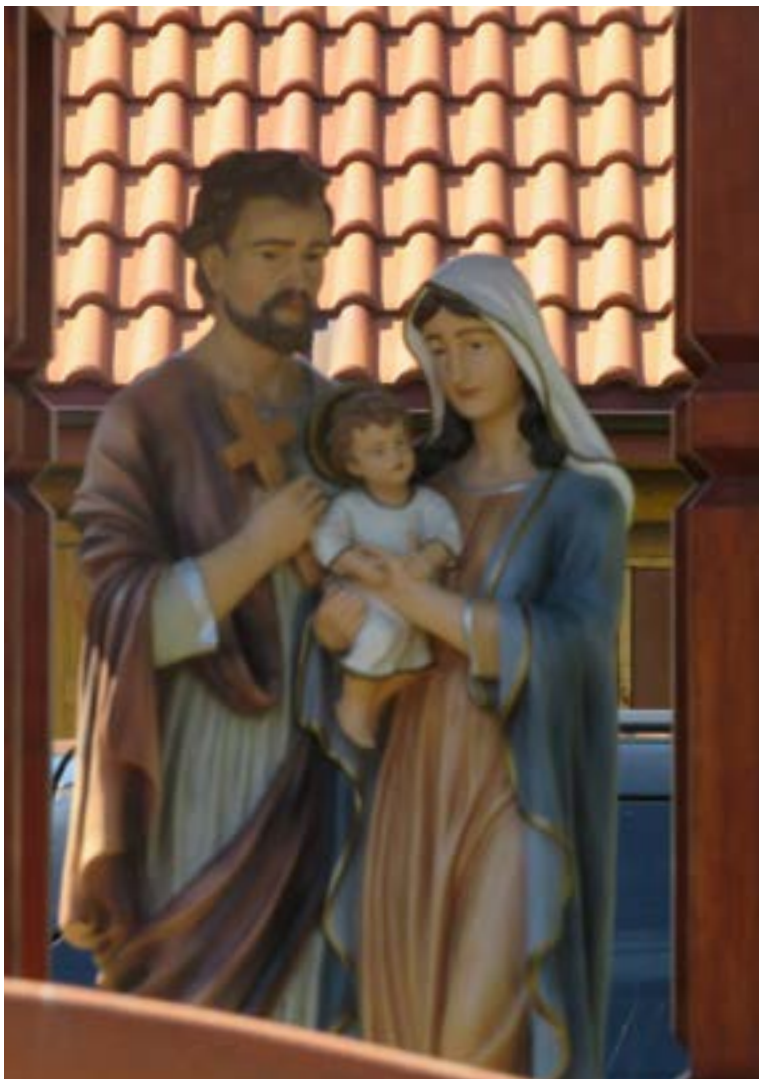
Lokalizacja: Olszewnica Stara, ul. Polna/Wiejska; Czas powstania: brak danych;

F igury Św. Rodziny na murowanym cokole.