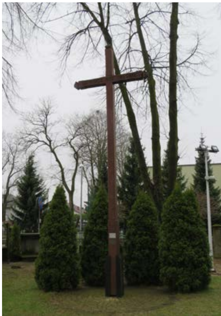
Lokalizacja: Wieliszew, ul. Modlińska (przy kościele Przemienienia Pańskiego) Czas powstania: 1987 r.;

K apliczka w typie przeszklonej latarni z figurą Matki Bożej Fatimskiej. Ustawiona na murowanym cokole. Ogrodzona żelaznym płotkiem.