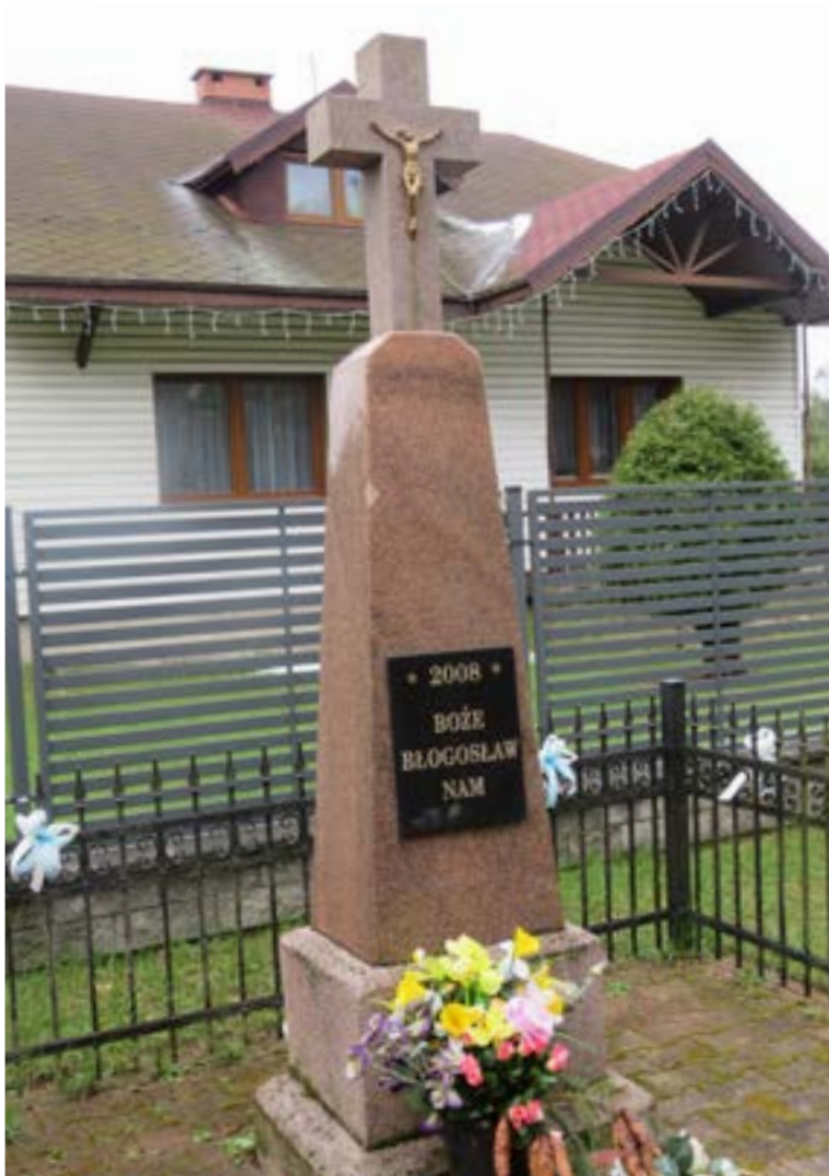
Lokalizacja: Komornica, ul. Wspólna 4; Czas powstania: b2008 r.

K rzyż murowany z figurą Chrystusa. Krzyż na murowanym, zwężającym się ku górze cokole. Od frontu na cokole tablica z napisem: „2008 BOŻE BŁOGOSŁAW NAM”.