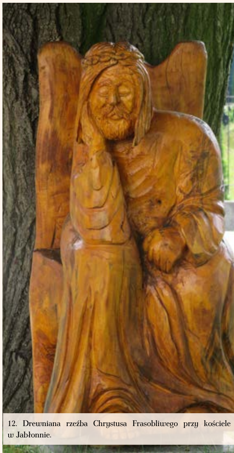
12. Drewniana rzeźba Chrystusa Frasobliwego przy kościele w Jabłonie.