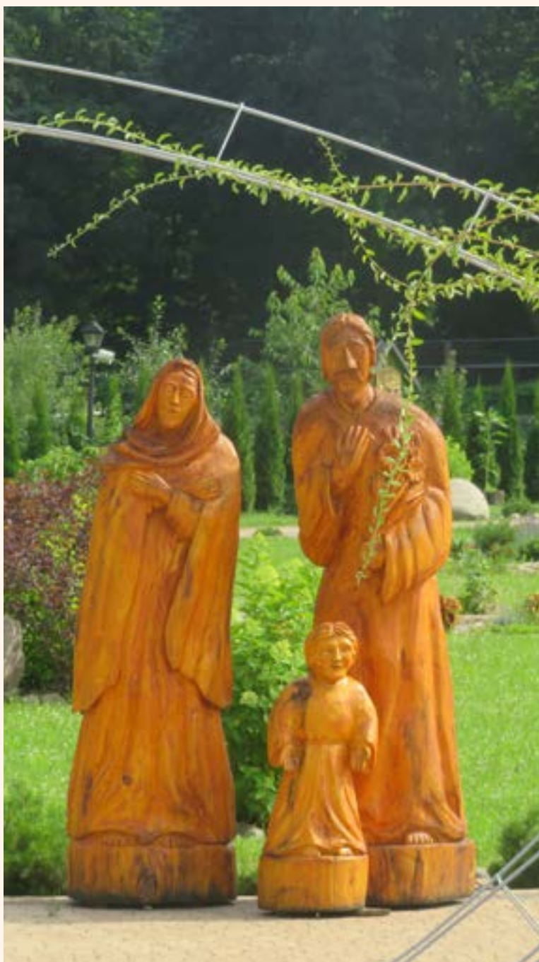
Figury Świętej Rodziny.