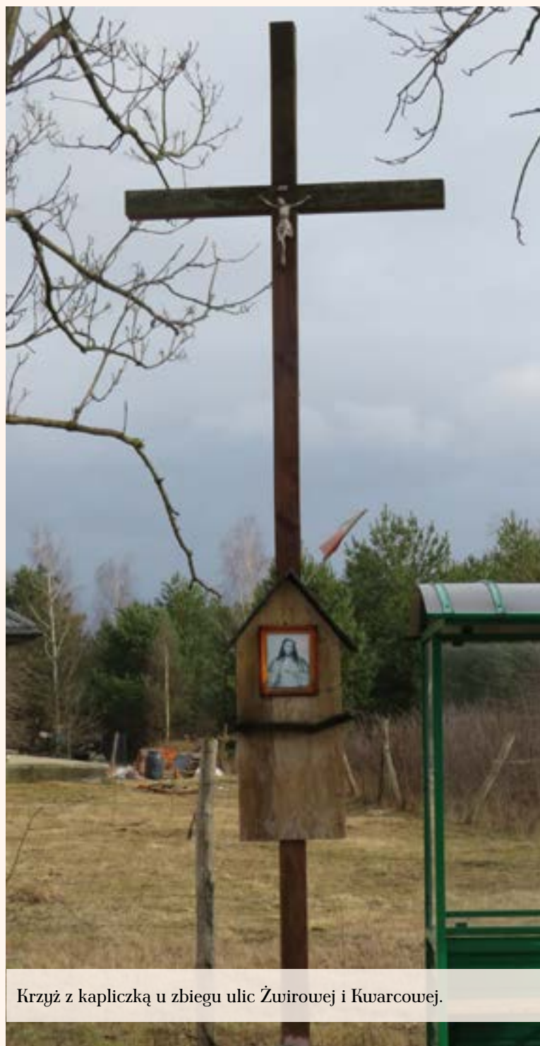
Krzyż z kapliczką u zbiegu ulic Źwirowej i Kvarcowej.