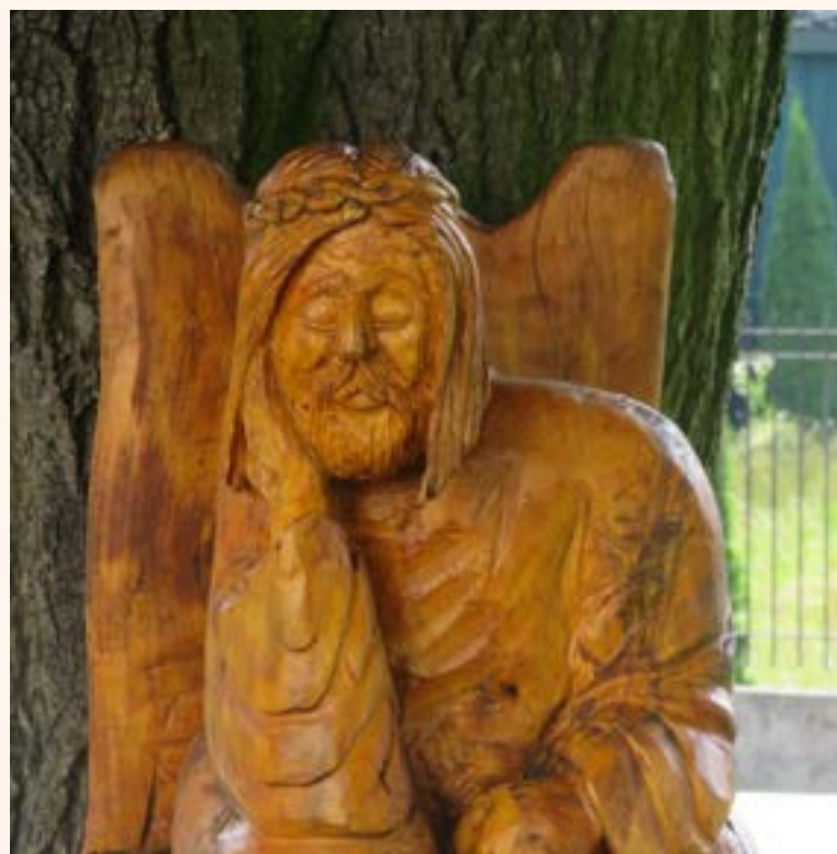
Rzeźba przedstawiająca Chrystusa Frasobliwego.