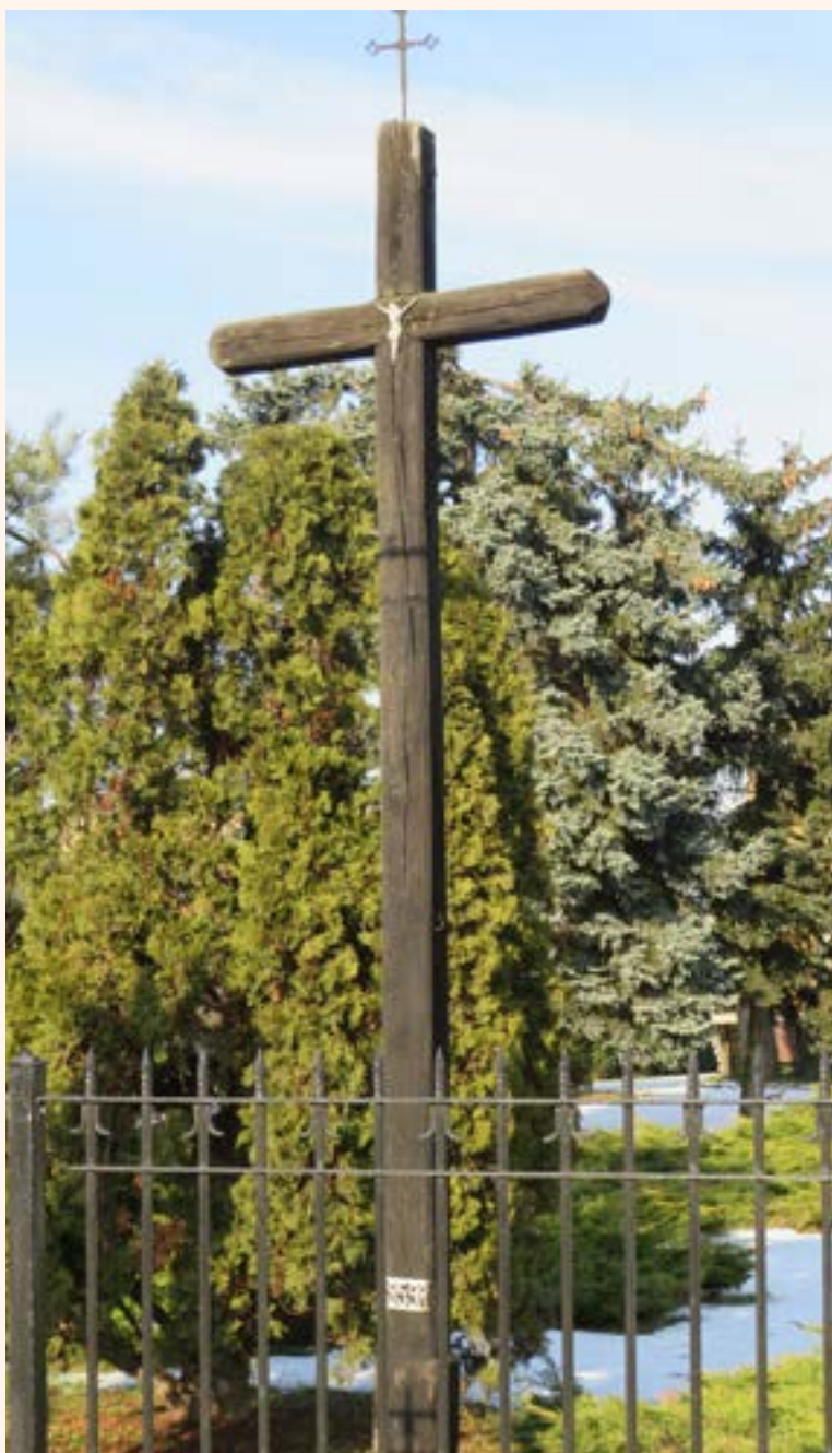
Jabłonna Krzyż drewniany z figurą Chrystusa przy ul. Modlińskiej w Jabłonie.