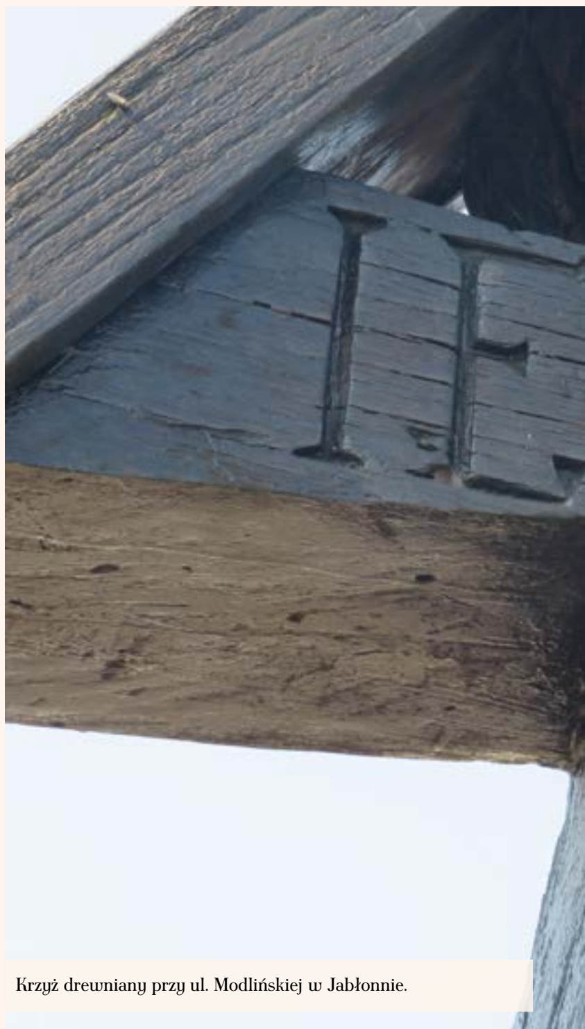
Krzyż drewniany przy ul. Modlińskiej w Jabłonie.

Natomiast krzyż drewniany z kapliczką u zbiegu ulic Marmurowej i Szkolnej został wzniesiony przez mieszkańców Jabłonny w 1987 r., podczas pielgrzymki Jana Pawła II do ojczyzny. Ponownie został postawiony i poświęcony w 2016 r., roku Miłosierdzia, 1050-lecia Chrztu Polski oraz Roku Jubileuszowego Aktu Przyjęcia Chrystusa za Króla i Pana. Na tablicy są słowa Jana Pawła II: „Proszę was (...) abyście nigdy nie wzgardzili tą Miłością, która jest największa, która się wyraziła przez Krzyż, a bez której życie ludzkie nie ma ani korzenia, ani sensu”.