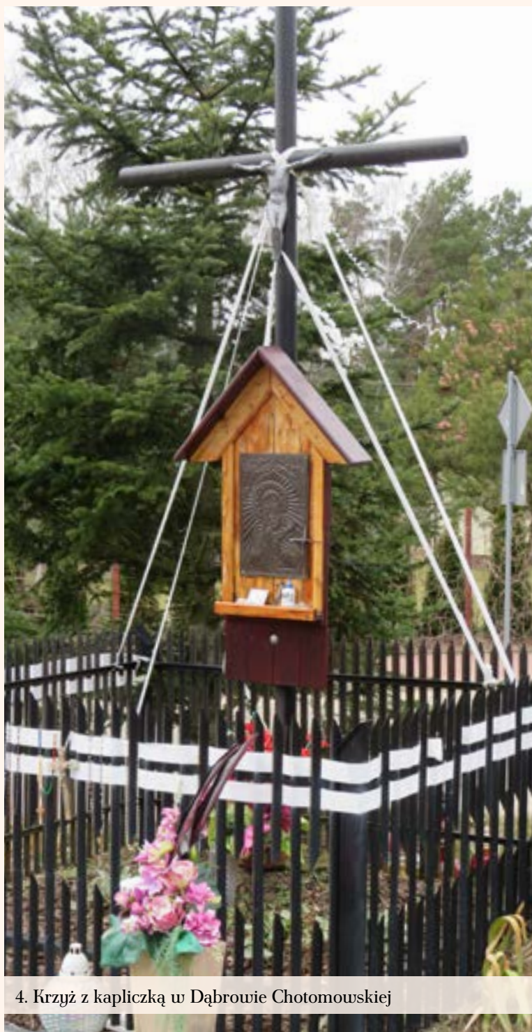
4. Krzyż z kapliczką w Dąbrowie Chotomowskiej