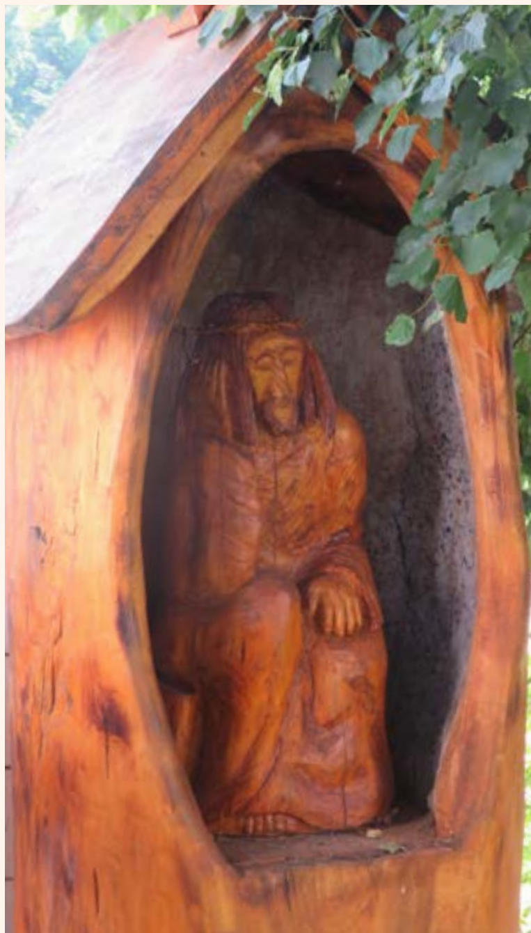
10. Kapliczka drewniana z figurą Chrystusa Frasobliwego przy kościele p.w. Matki Bożej Królowej Polski w Jabłonie.