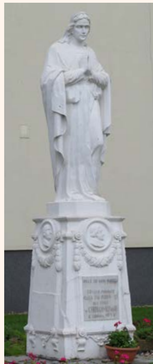
Figura Najświętszej Maryji Panny przy ul. Piusa. Na cokole napis: „OKAŻ SIĘ NAM MATKO 50-LECIE FUNDACJI OJCA ŚW. PIUSA XI DLA DZIECI W CHOTOMOWIE 6 CZERWCA 1973 R.”