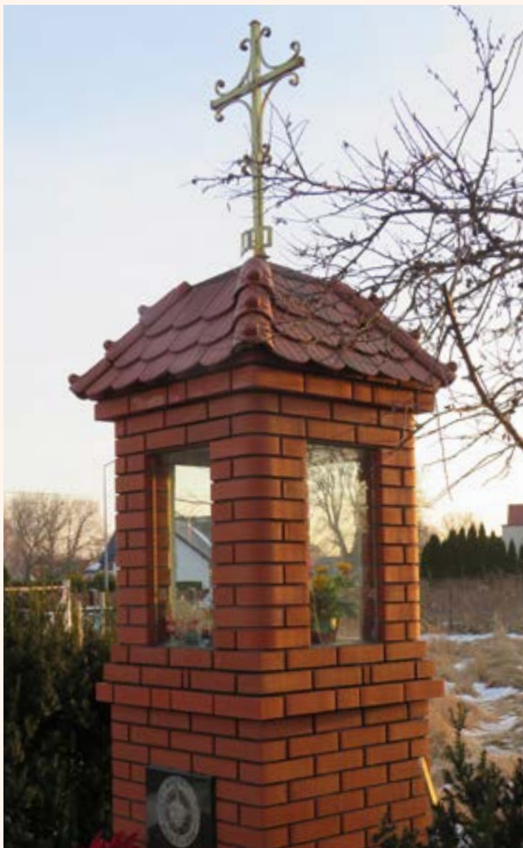
9. 24 grudnia 1999 r. otwarciem Drzwi Świętych papież Jan Paweł II zainaugurował Wielki Jubileusz Roku Świętego 2000, który trwał do wigilii uroczystości Objawienia Pańskiego 5 stycznia 2001 r. Kapliczka u zbiegu ulic Leśnej i Słonecznej w Jabłonie powstała właśnie w roku wielkiego jubileuszu