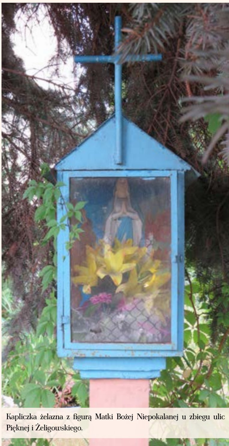
Kapliczka żelazna z figurą Matki Bożej Niepokalanej u zbiegu ulic Pięknnej i Żeligowskiego.