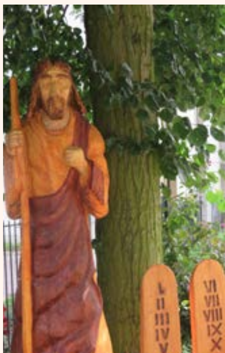
Drewniana figura Mojżesza przy tablicach z Dekalogiem.