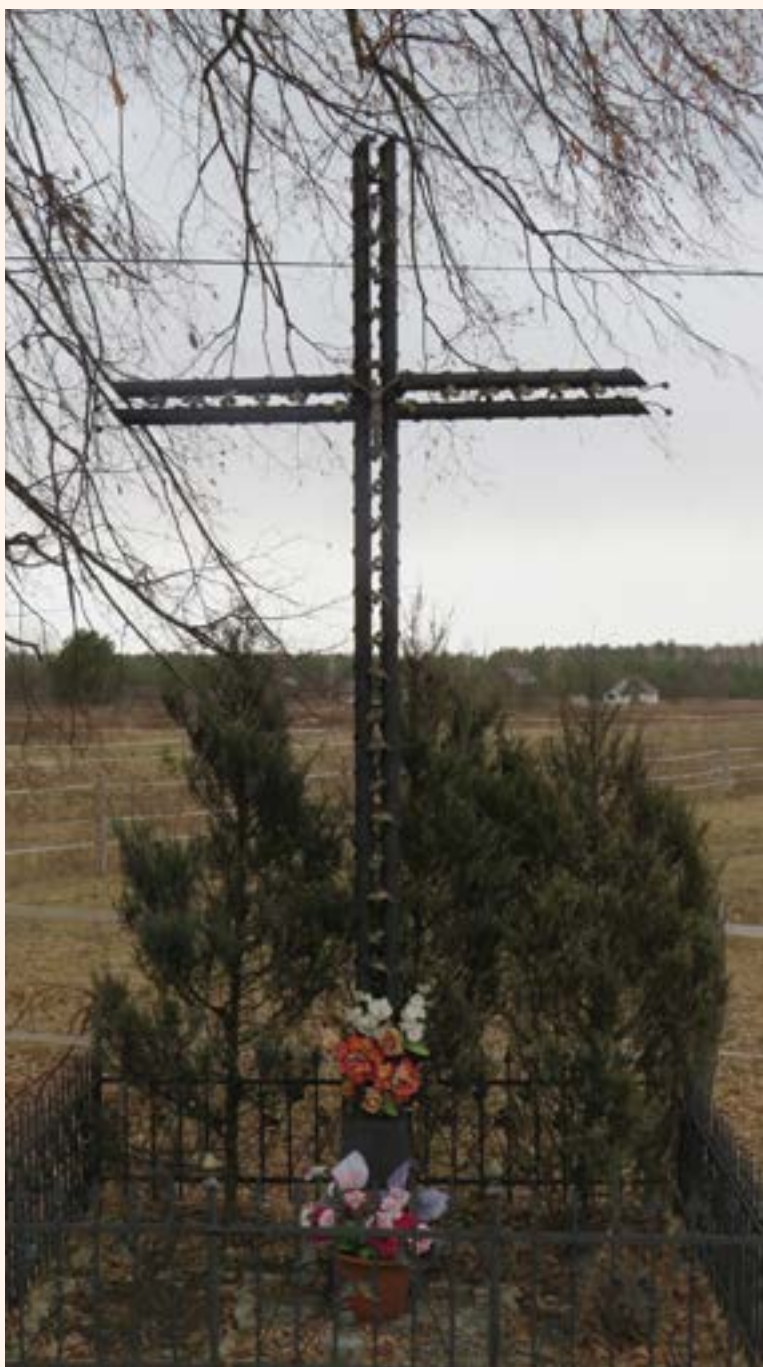
Krzyż żelazny przy ul. Granitowej.