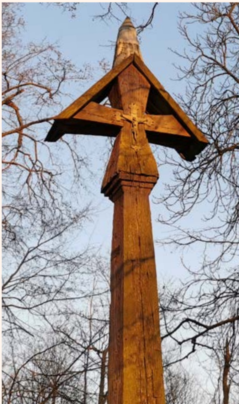
2. Krzyż drewniany z figurą Chrystusa przy kościele p.w. Wniebowzięcia Najświętszej Maryi Panny w Chotomowie. Krzyż został wybudowany w 1826 r. na terenie ówczesnego cmentarza.