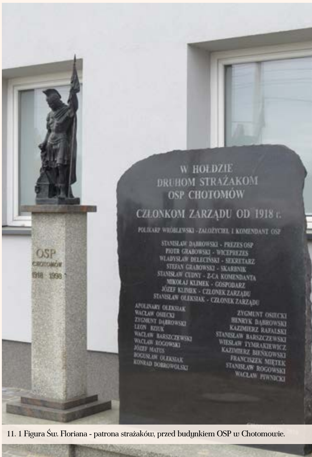
11. 1 Figura Św. Floriana - patrona strażaków, przed budynkiem OSP w Chotomowie.