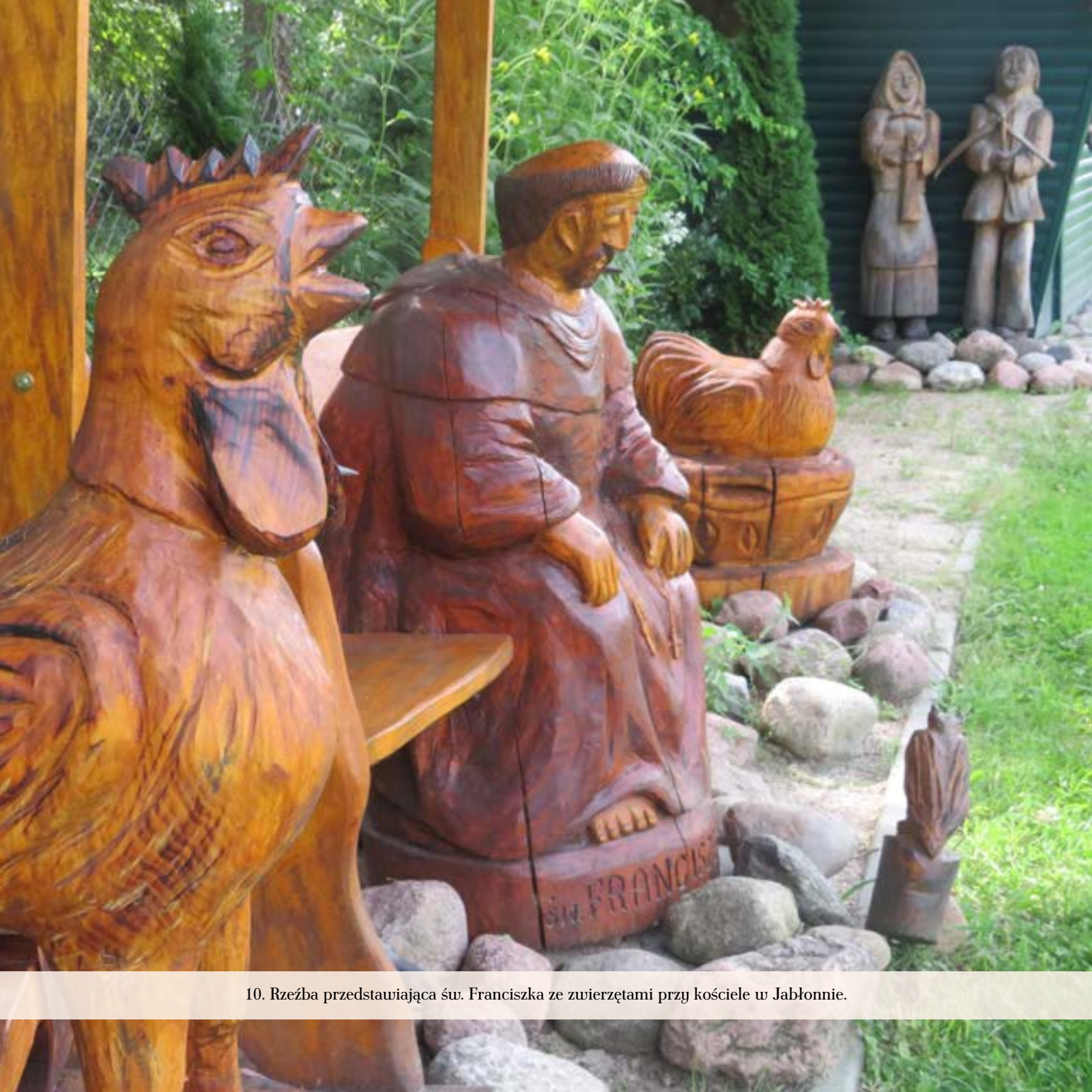
10. Rzeźba przedstawiająca św. Franciszka ze zwierzętami przy kościele w Jabłonie.