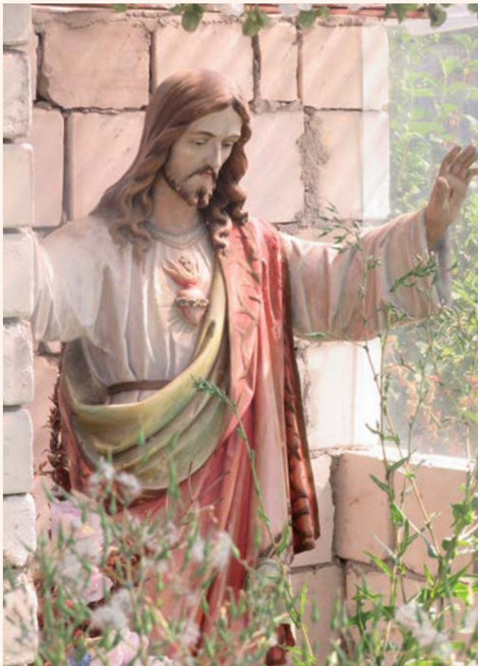
Podpis Figura Najświętszego Serca Pana Jezusa na posesji przy ul. Pięknej.