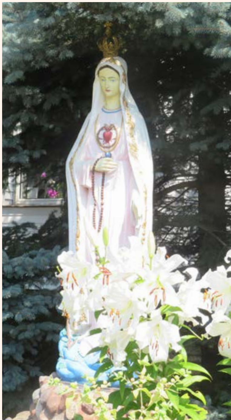
Figura Matki Bożej z Medjugorie przy ul. Piusa.