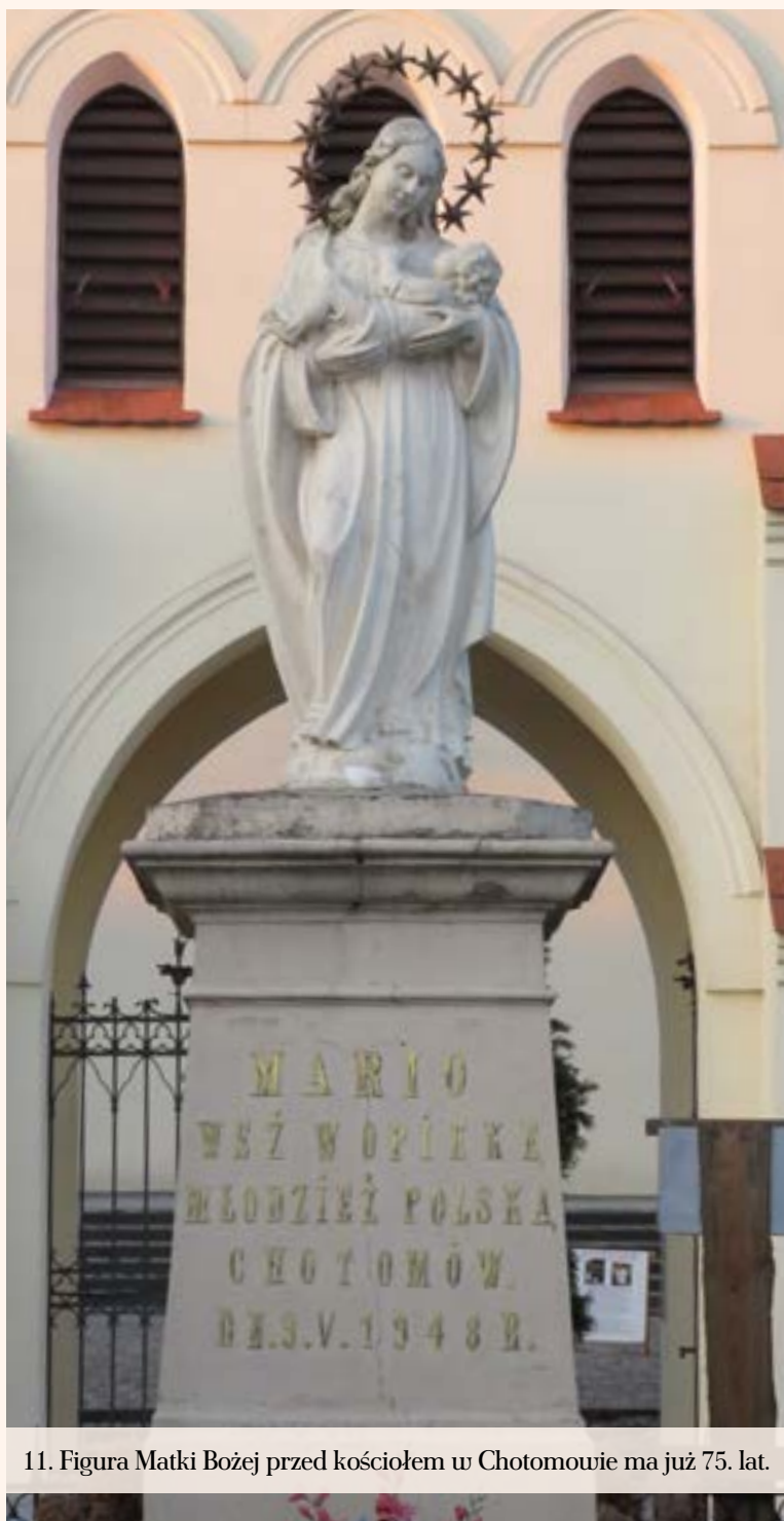
11. Figura Matki Bożej przed kościołem w Chotomowie ma już 75. lat.