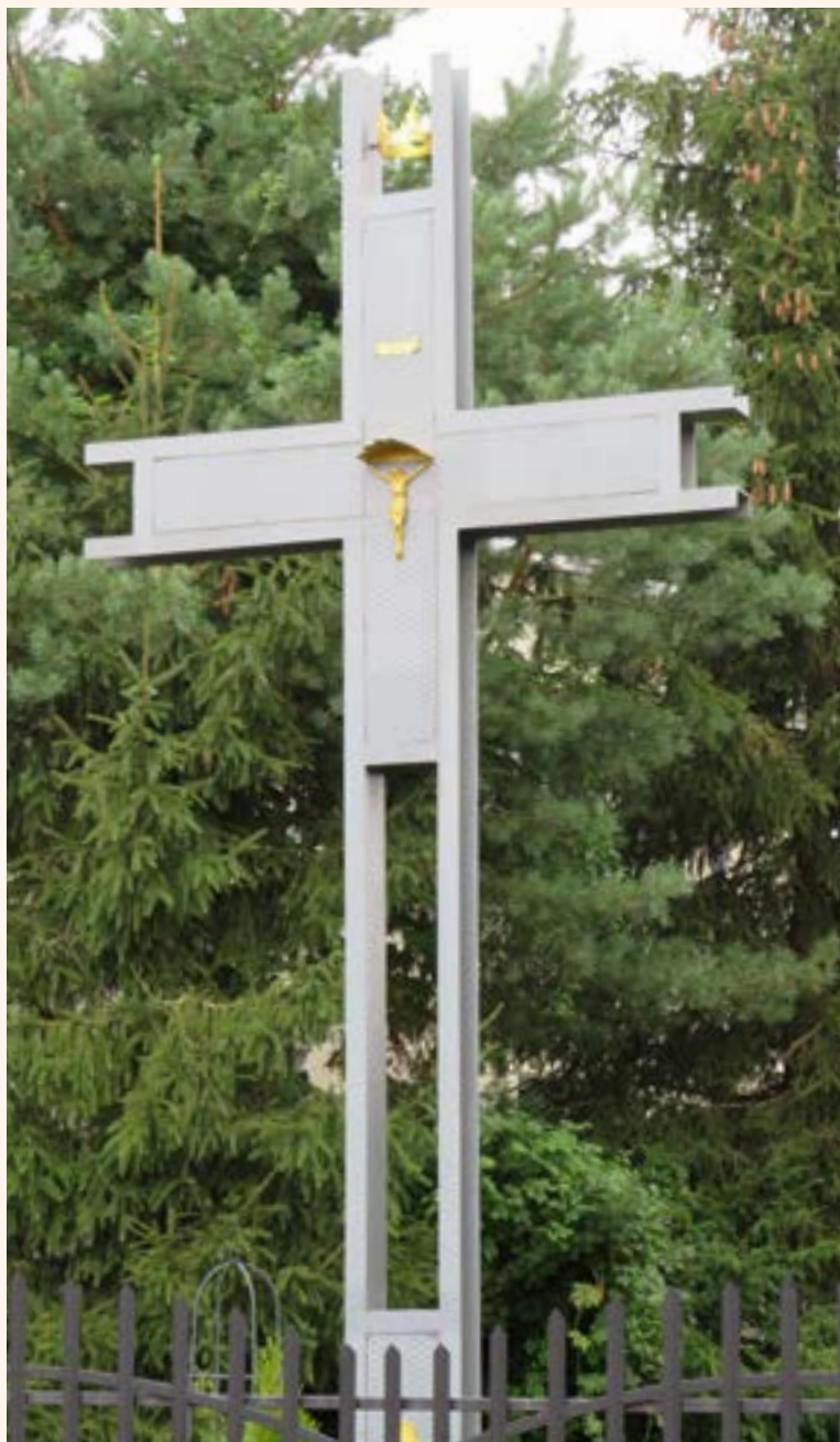
11. Krzyż z figurą Chrystusa przy ul. Partyzantów. Na pionowej belce medaliony z wizerunkiem Matki Boskiej Karmiącej i Chrystusa w cierniowej koronie.

W Chotomowie ewidencją objęto piętnaście obiektów małej architektury sakralnej. To właśnie tutaj, przy chotomowskim kościele wznosi się najstarszy datowany obiekt w gminie – drewniany krzyż z 1826 r. Warto obejrzeć figurę Najświętszej Maryji Panny przy zbiegu ulic Pięknej i Leśnej. Napis na tablicy głosi: „POD TWOJĄ OBRONĘ UCIEKAMY SIĘ MAJ 1949 R.” Natomiast figura Matki Bożej przed kościołem została wybudowana w intencji błagalnej: „MARIO WEŻ W OPIEKĘ MŁODZIEŻ POLSKĄ”.