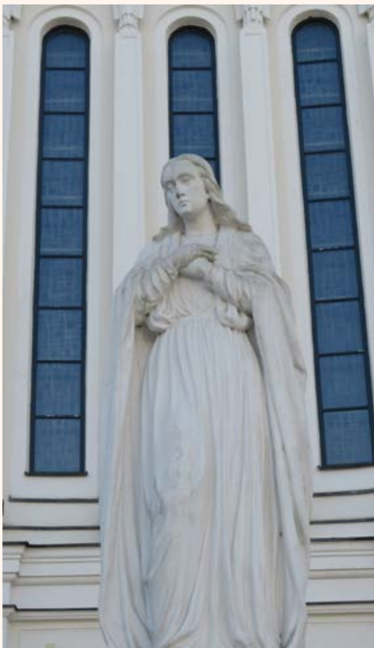
Zwiastowanie Najświętszej Marii Panny. Figura przed kościołem p.w. Matki Bożej Królowej Polski w Jabłonie.