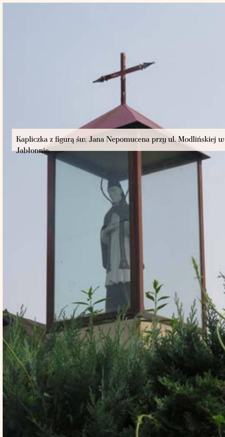
Kapliczka z figurą św. Jana Nepomucena przy ul. Modlińskiej w Jabłonie.