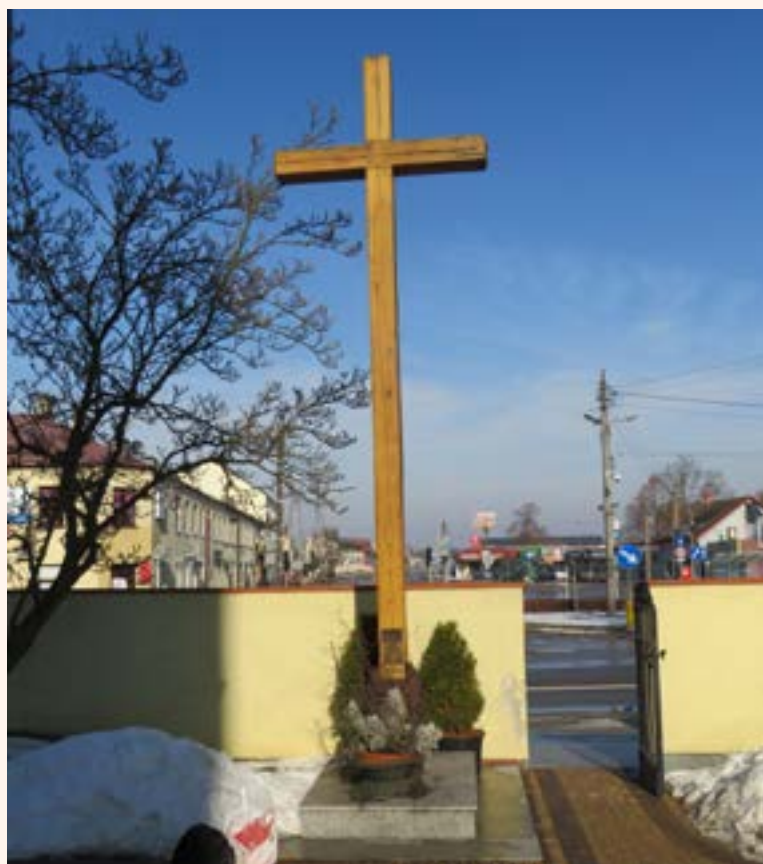
Krzyż drewniany przy wejściu na teren kościoła p.w. Matki Bożej Królowej Polski w Jabłonie, upamiętniający Misje Świete, począwszy od 1948 r.