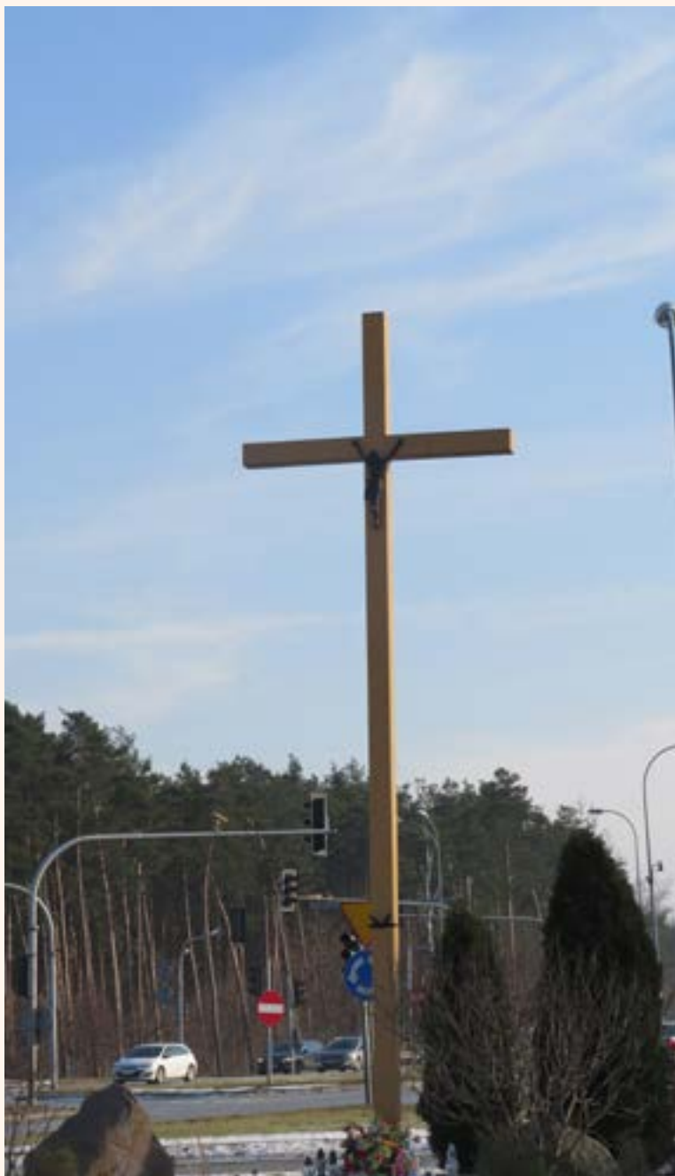
Krzyż drewniany z figurą Chrystusa na rondzie przy ul. Modlińskiej w Jabłonie.