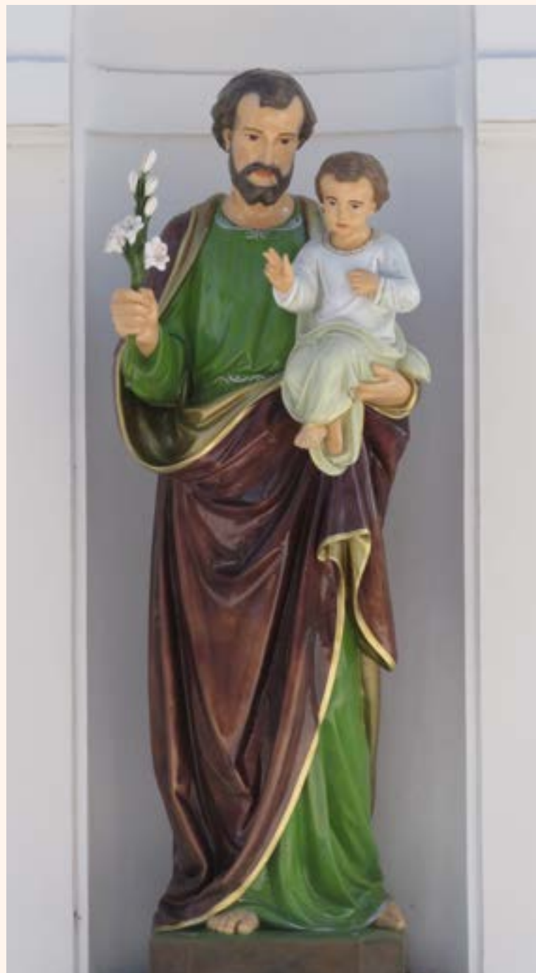
14. Św. Józef z Dzieciątkiem przy kościele w Jabłonnie.