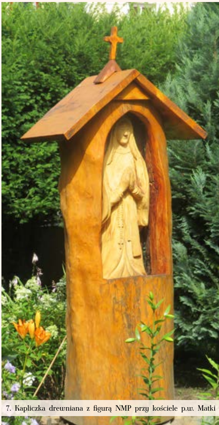
7. Kapliczka drewniana z figurą NMP przy kościele p.w. Matki