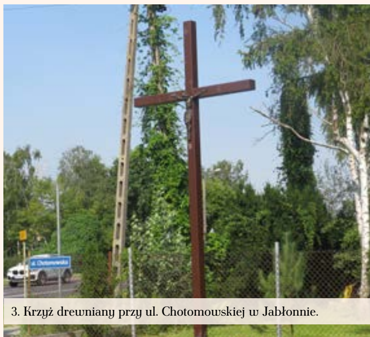
3. Krzyż drewniany przy ul. Chotomowskiej w Jabłonie.