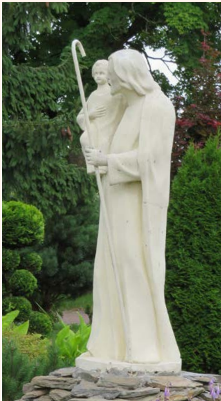
Figura Św. Józefa z Dzieciątkiem przy ul. Piusa.