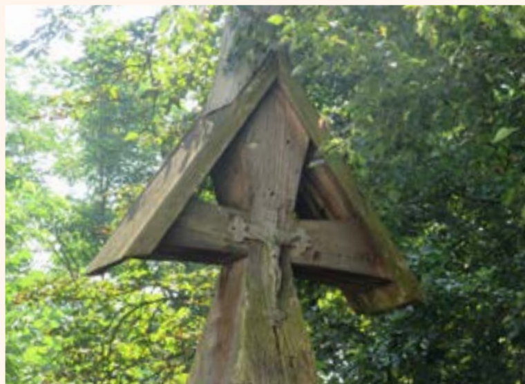
Najstarszy obiekt małej architektury sakralnej w gminie Jabłonna - krzyż drewniany z 1826 r.