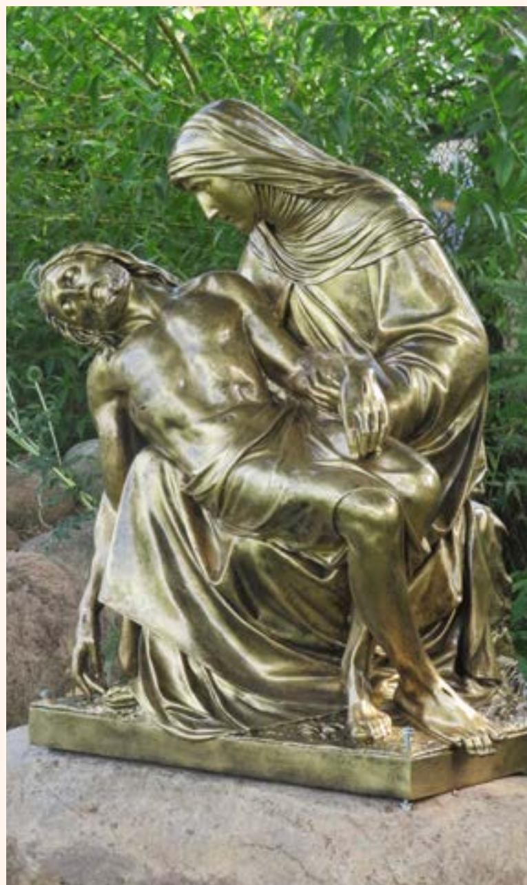
Krzyż drewniany oraz Pieta na przykościelnym terenie. Pieta to przedstawienie Matki Bożej trzymającej na kolanach martwego Jezusa Chrystusa.