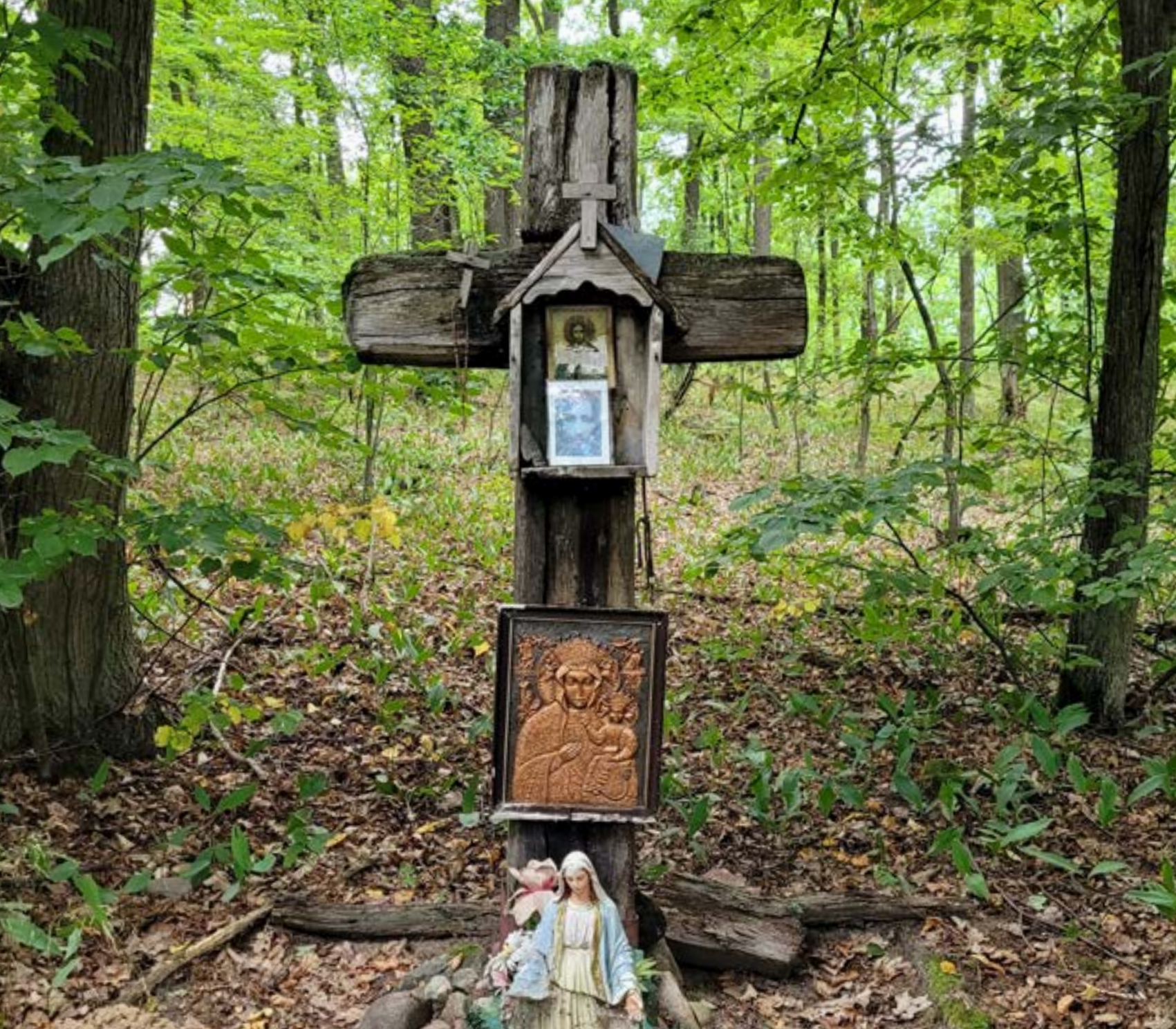
1. Krzyż drewniany z kapliczką w Jabłonie, w lesie w pobliżu leśniczówki. W kapliczce i przy krzyżu obrazy, m.in. z wizerunkiem MB Częstochowskiej.