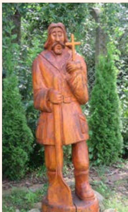
Figura Św. Floriana.