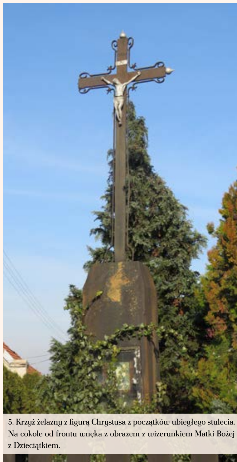
5. Krzyż żelazny z figurą Chrystusa z początków ubiegłego stulecia. Na cokole od frontu wnękę z obrazem z wizerunkiem Matki Bożej z Dzieciątkiem.