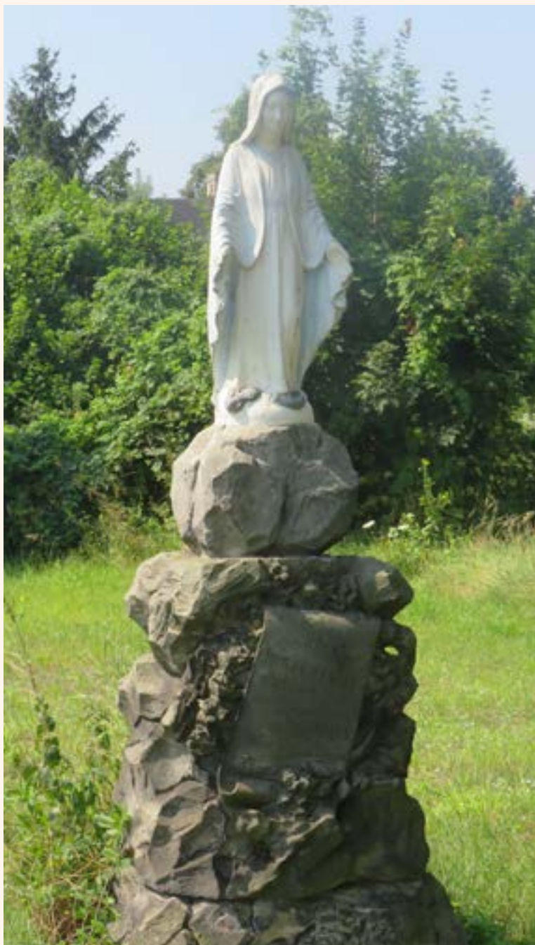
13. Figura Najświętszej Maryji Panny na murowanym cokole z 1949 r., u zbiegu ulic Pięknej i Leśnej w Chotomowie.