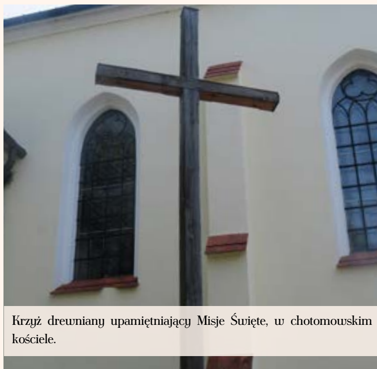
Krzyż drewniany upamiętniający Misje Święte, w chotomowskim kościółce.