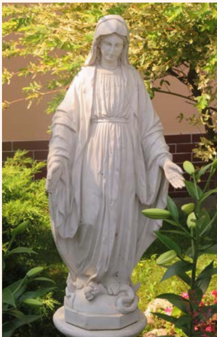
Figura Matki Bożej Niepokalanej przy ul. Pięknnej została ustawiona w intencji dziękczynnej, Właścicielka posesji uległa wypadkowi, najechał na nią samochód, gdy przechodziła przez jezdnię przy zielonym świetle. Kobieta doznała poważnych obrażeń, jednak ocalała życie. W podziękowaniu za opiekę i doznana łaskę ustawiła w ogrodzie przed domem figurę Niepokalanej.