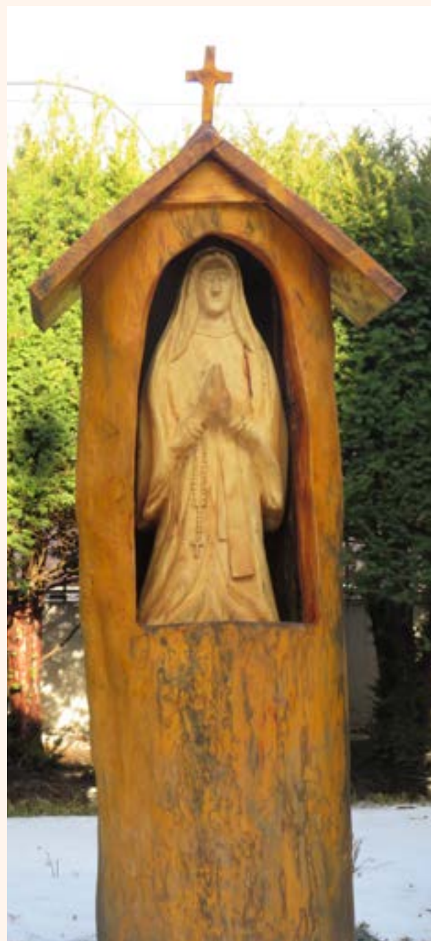
Kapliczka z figurą Matki Bożej.