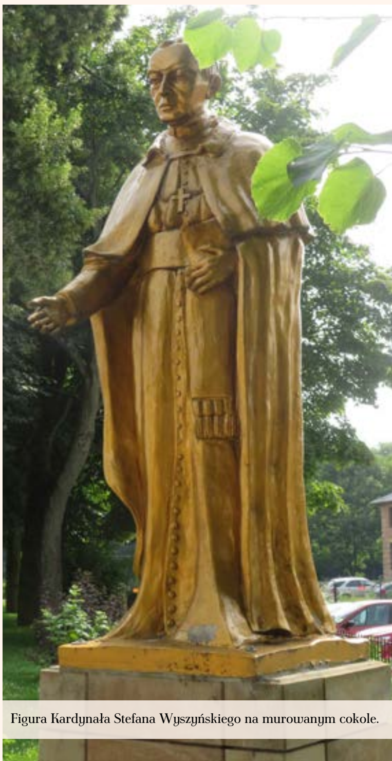
Figura Kardynała Stefana Wyszyńskiego na murowanym cokole.