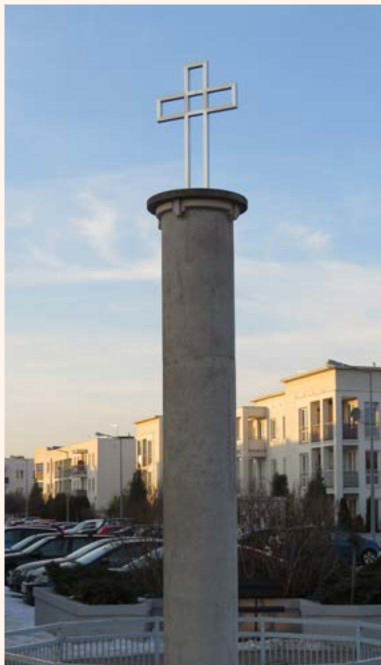
Krzyż żelazny na kolumnowym cokole przy ul. Przylesie w Jabłonie.