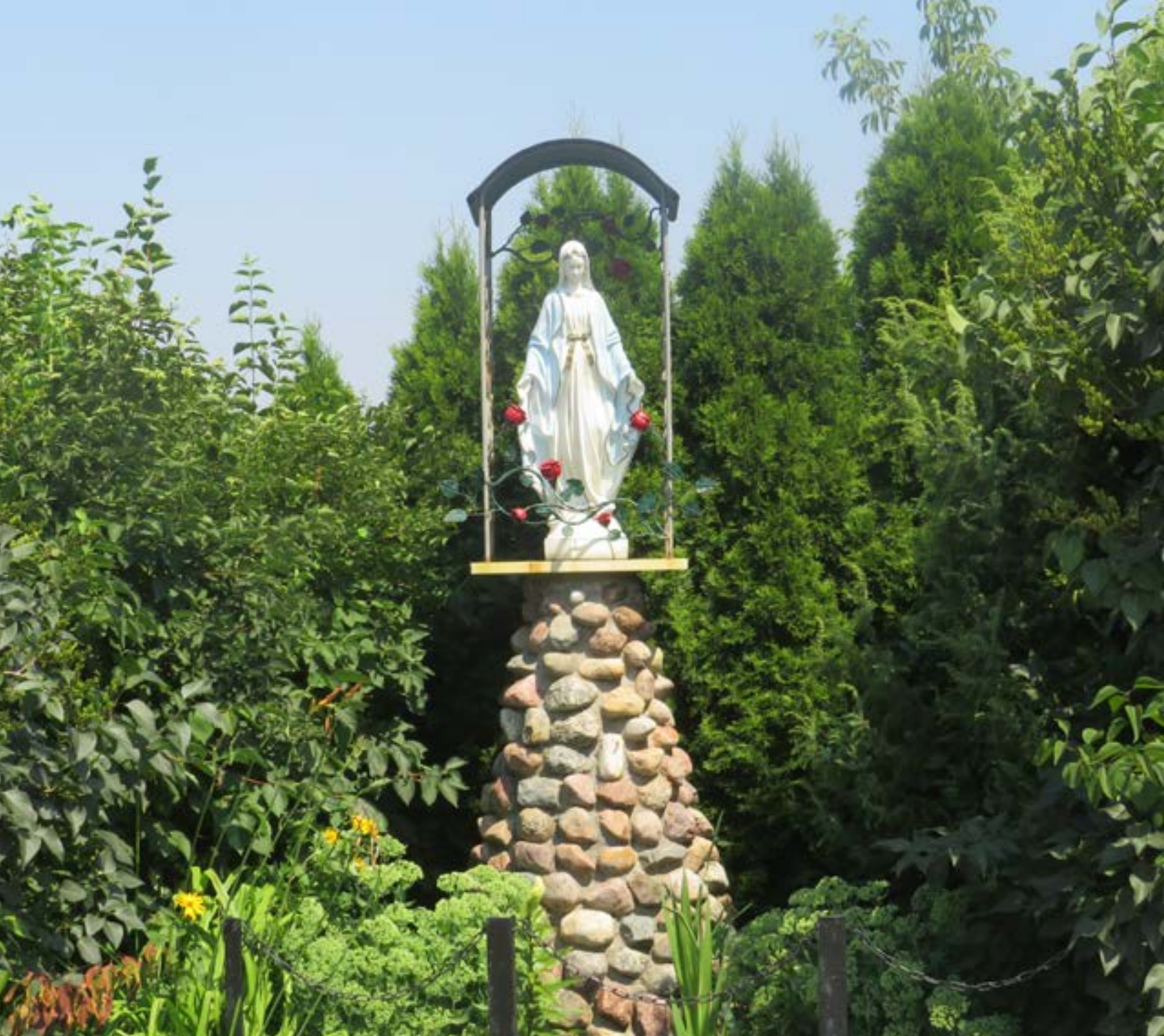
6. Kapliczka z figurą Matki Bożej Niepokalanej w Trzcianach.