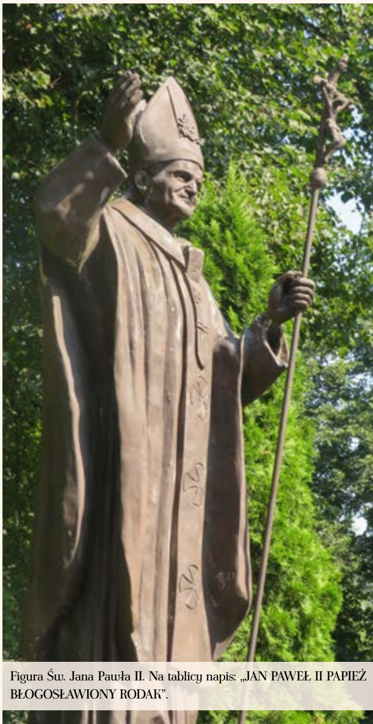
Figura Św. Jana Pawła II. Na tablicy napis: „JAN PAWEŁ II PAPIEŻ BŁOGOSŁAWIONY RODAK”.