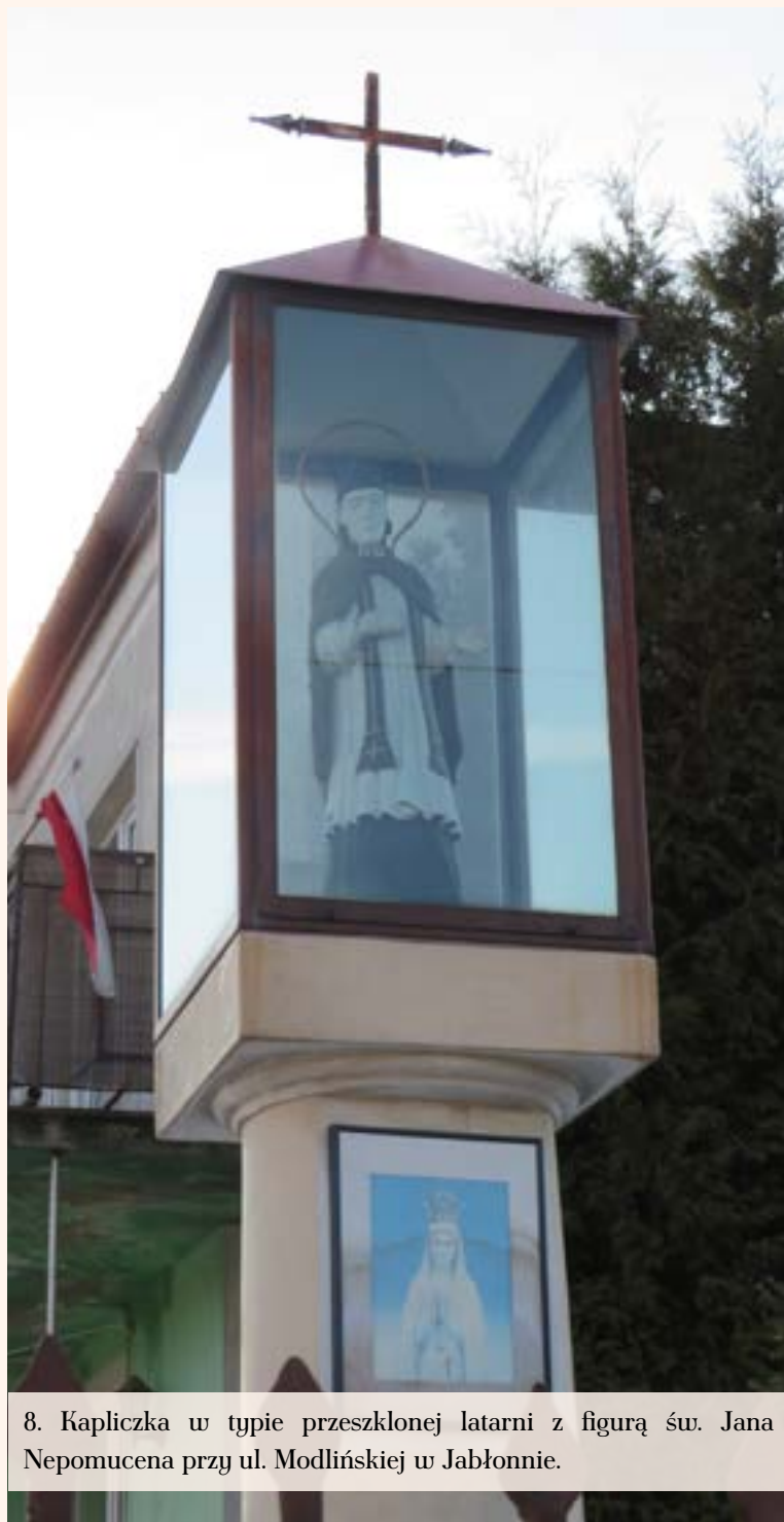
8. Kapliczka w typie przeszklonej latarni z figurą św. Jana Nepomucena przy ul. Modlińskiej w Jabłonie.