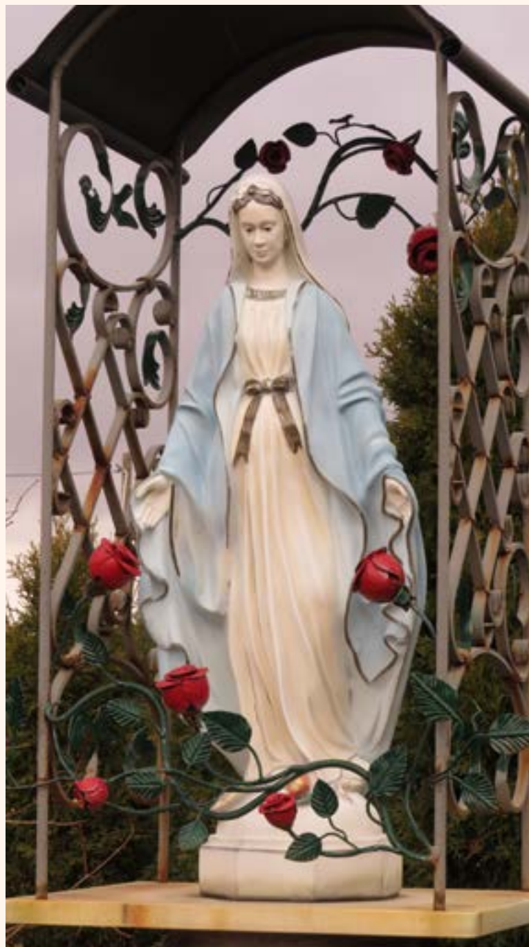
Kapliczką z figurą Matki Bożej Niepokalanej przy ul. Granitowej.