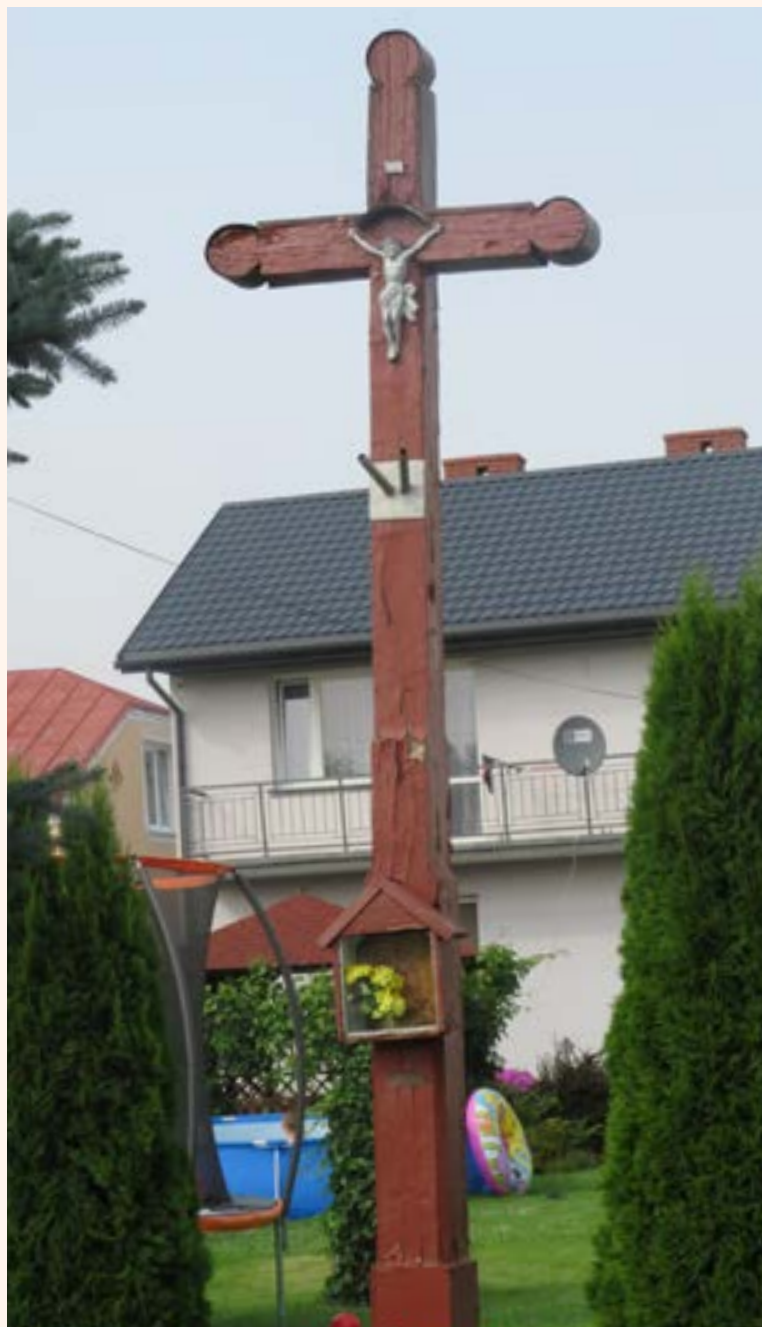
Krzyż drewniany z kapliczką przy ul. Modlińskiej w Jabłonie.