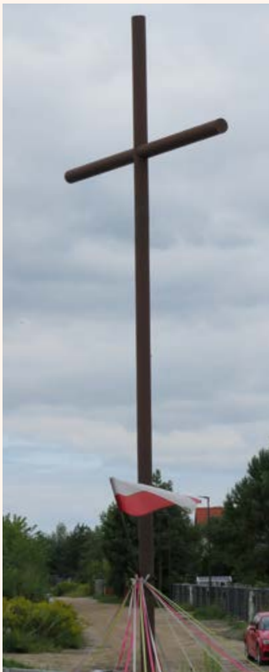
Krzyż żelazny na skrzyżowaniu ulic Partyzantów i Harcerzy Szarych Szeregów.