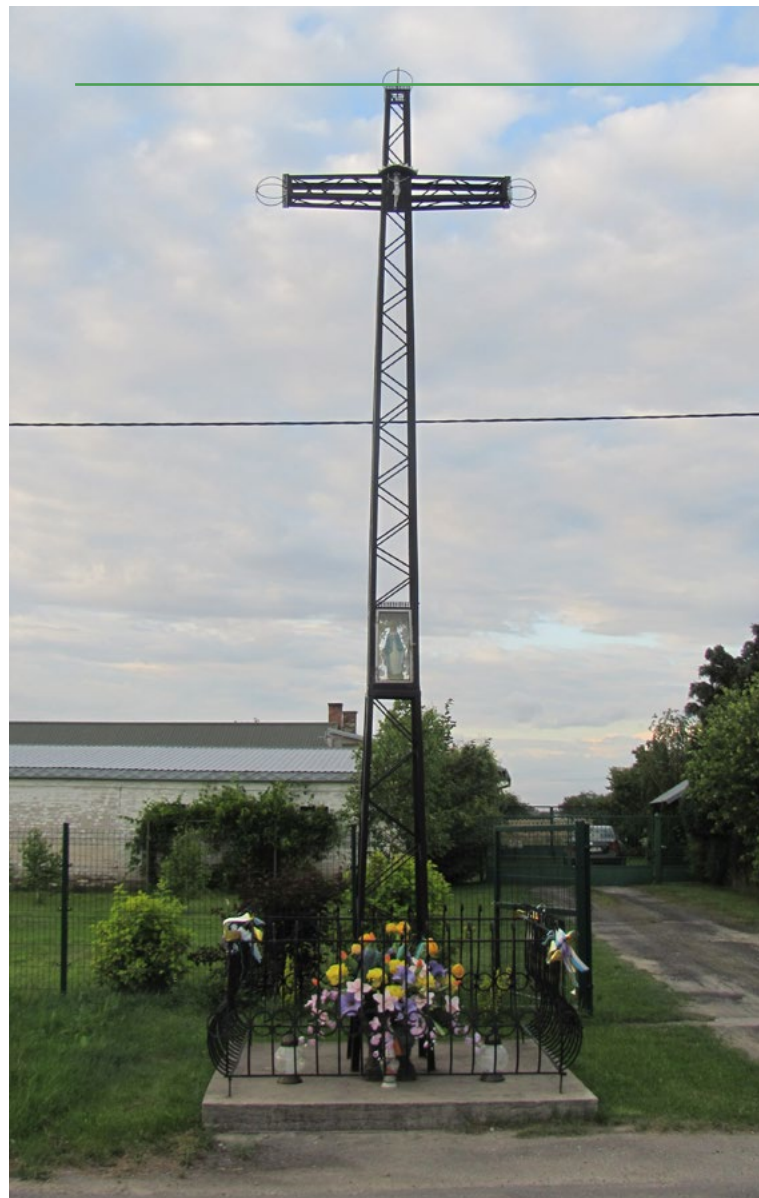
Lokalizacja: Chruściele; Czas powstania: ok. II połowa. XX w.

K rzyż żelazny z kapliczką. Krzyż z figurą Chrystusa osłoniętą blaszanym daszkiem. Krzyż gałkowy, szkieletowej konstrukcji. Pomiędzy pionowymi belkami kapliczka w typie przeszklonej latarni z figurą Najświętszej Maryi Panny. Ustawiony na betonowym podłożu. Ogródzony żelaznym płotkiem.