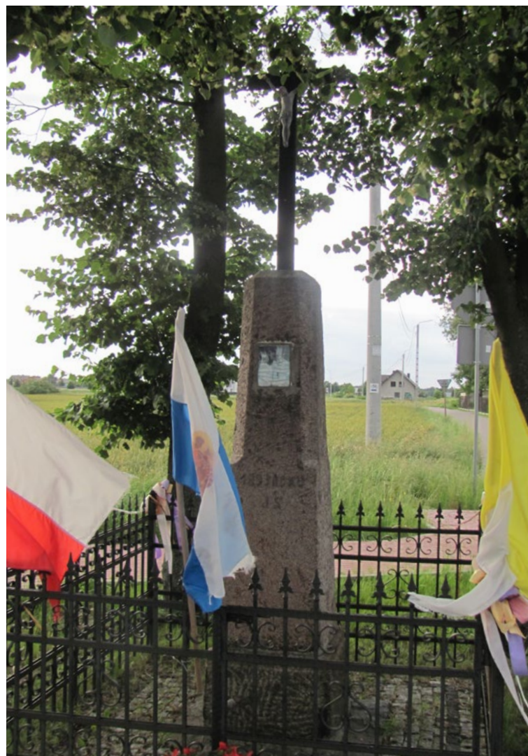
Lokalizacja: Trojany; Czas powstania: 1893 r.

K rzyż drewniany z figurą Chrystusa na cokole z kamieni polnych. Przy krzyżu dwie figury: Matki Bożej i Marii Magdaleny. Na największym kamieniu położonym centralnie tablica z napisem: „OTO SYN TWÓJ OTO MATKA TWOJA”.