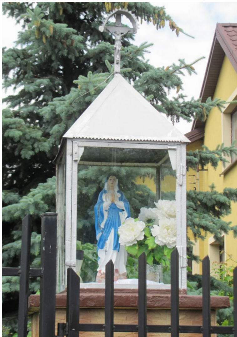
Lokalizacja: Kuligów, ul. Serocka; Czas powstania: ok. II połowa XX w.

K apliczka w typie przeszklonej latarni na murowanym cokole. Czterospadowy blaszany daszek zwieńczony krzyżem żelaznym z figurą Chrystusa osłoniętą blaszanym daszkiem. We wnęce figura Matki Bożej Różańcowej.