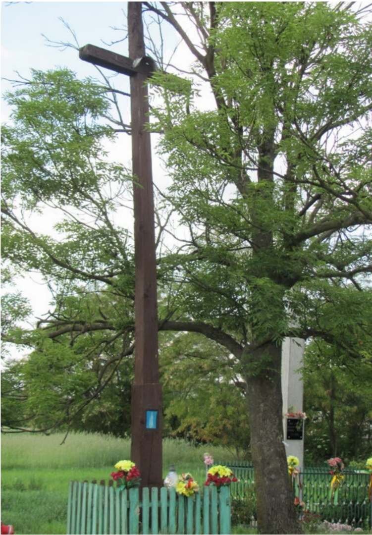
Lokalizacja: Lasków; Czas powstania: 1953 r.

Krzyż drewniany z figurą Chrystusa osłoniętą blaszanym daszkiem oraz wnęką. W zamkniętej szybkiej wnęcie reprodukcja obrazu Matki Bożej Różańcowej. Pod wnęką napis: „4 IX 1953 r.” Ogródzony drewnianym płotkiem.