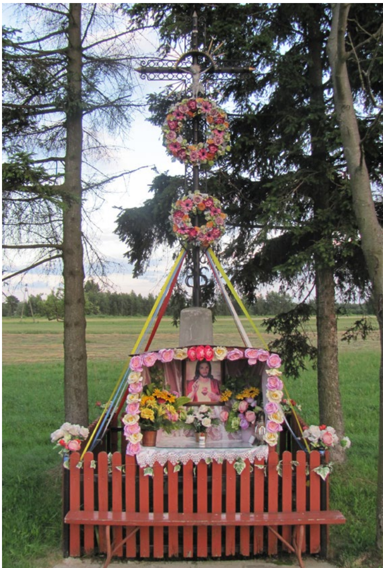
Lokalizacja: Karolew; Czas powstania: ok. początek XX w.

K rzyż żelazny promienisty z figurą Chrystusa osłoniętą blaszanym daszkiem na kamiennym cokole. Krzyż ręcznej kowalskiej roboty z ornamentami wzdłuż obydwu belek – pionowej i poziomej. Przy cokole stolik osłonięty blaszanym daszkiem, tworzącym wnękę. Wewnątrz reprodukcja obrazu Najświętszego Serca Jezusa. Ustawiony na betonowym podłożu. Ogrodzony drewnianym płotkiem.