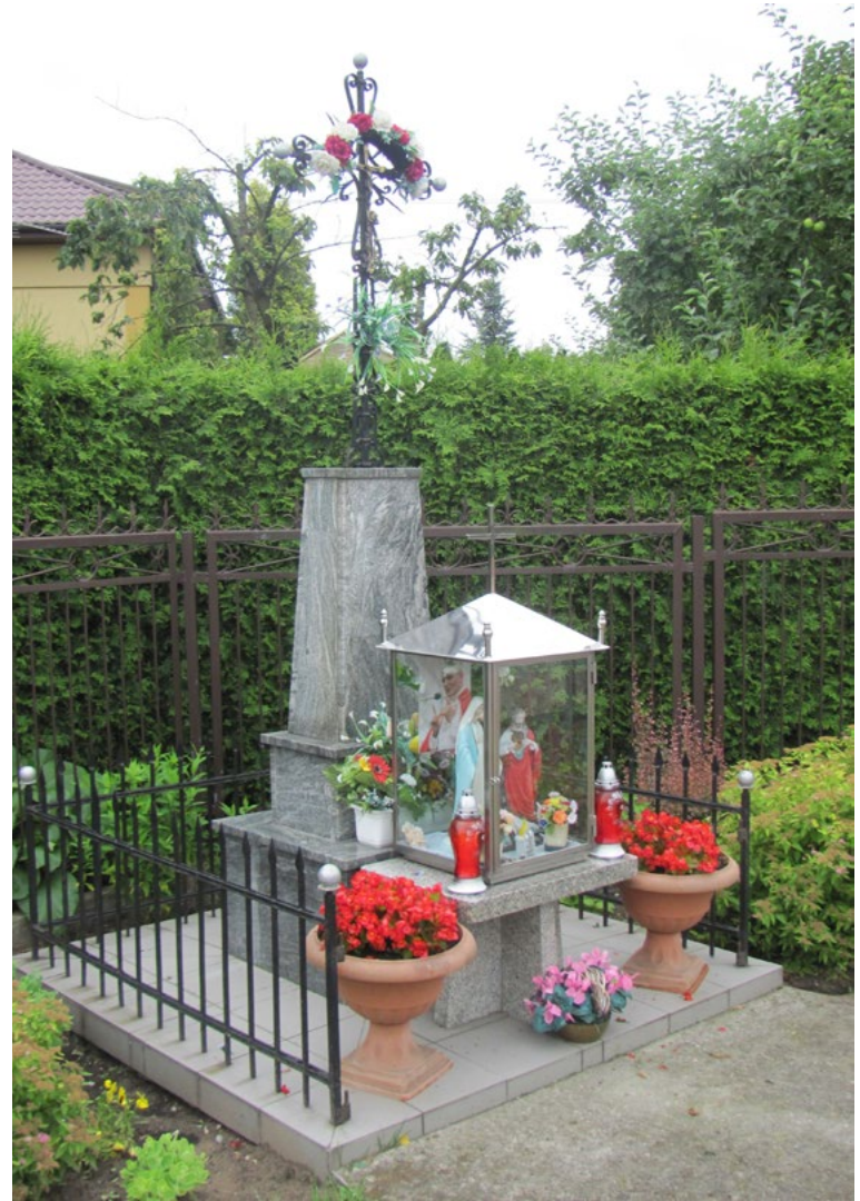
Lokalizacja: Guzowatka; Czas powstania: ok. początek XX w.

K apliczka w typie przeszklonej latarni na murowanym cokole. Dwuspadowy daszek zwieńczony metalową głową w cierniowej koronie. W zamkniętej szybie wewnątrz figura Najświętszej Maryi Panny. Na cokole tabliczka z napisem: „POD TWOJĄ OBRONĘ UCIEKAMY SIĘ JEZU UFAM TOBIE”.