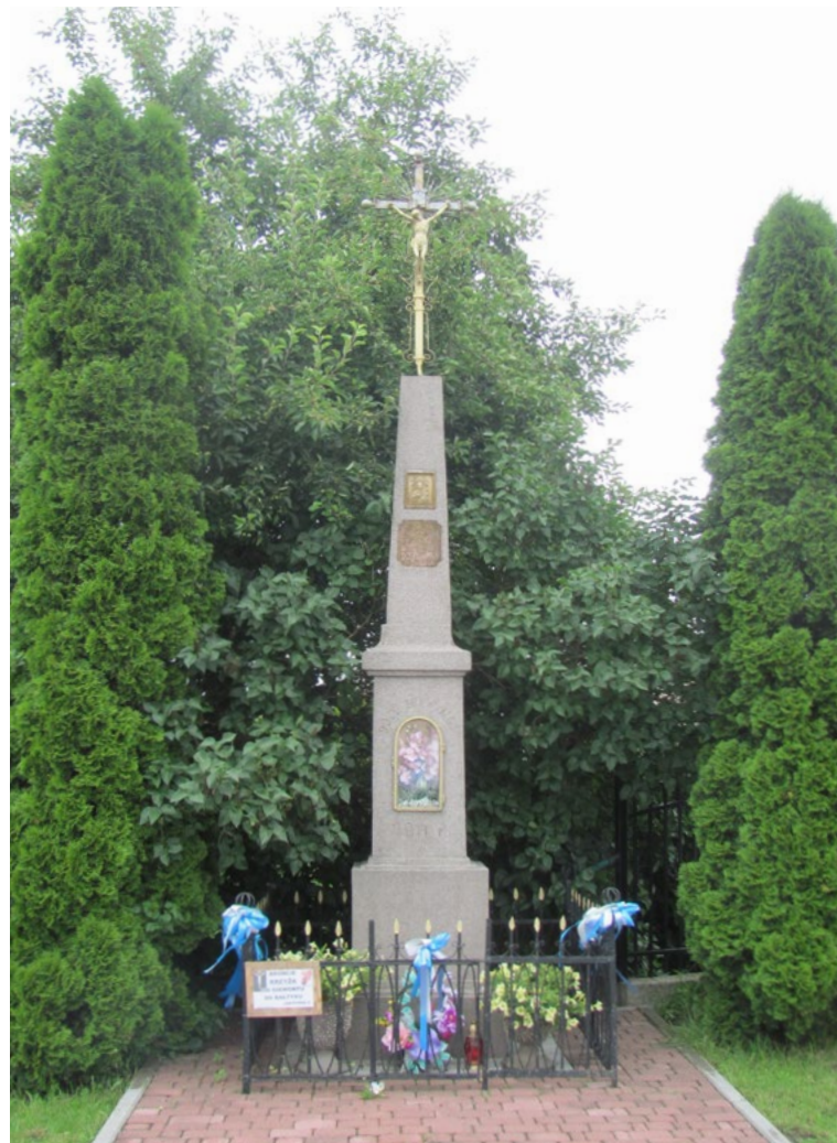
Lokalizacja: Małopole; Czas powstania: 1911 r.