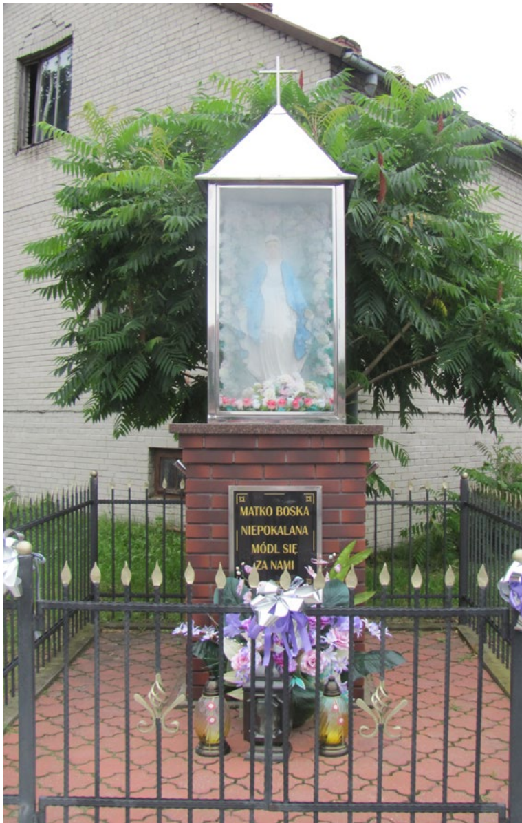
Lokalizacja: Kołaków; Czas powstania: 1996 - 2017 r.

K apliczka żelazna w typie przeszklonej latarni na murowanym cokole, z figurą Najświętszej Maryi Panny. Błyszczący czterospadowy daszek zwieńczony krzyżem prostym. Na cokole tablica z napisem: „MATKO BOSKA NIEPOKALANA MÓDL SIĘ ZA NAMI ROK 1996 ROK 2017”. Ogrodzona żelaznym płotkiem.