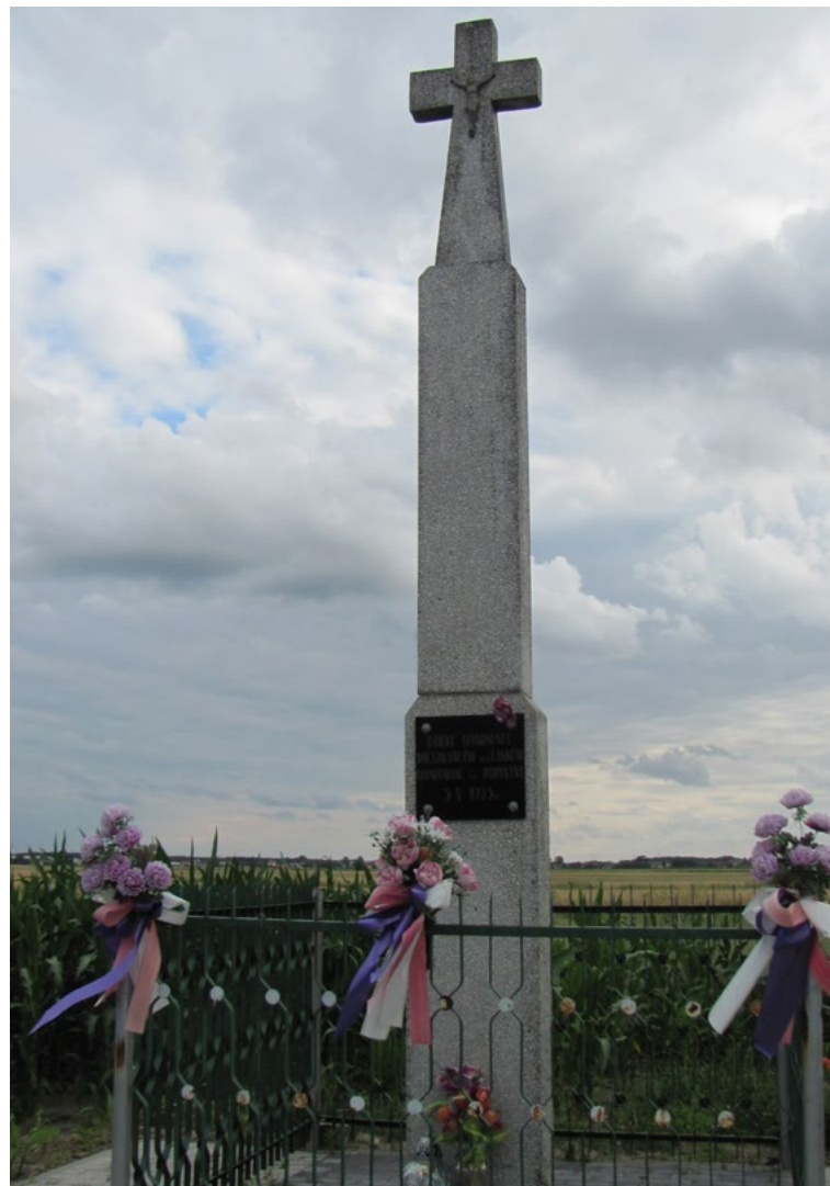
Lokalizacja: Lasków; Czas powstania: 1993 r.

K rzyż żelazny, gałkowy, promienisty, z figurą Chrystusa osłoniętą blaszanym daszkiem. Krzyż kowalskiej roboty, wzdłuż ramion i pionowej belki ażurowe ornamenty. Krzyż na kamiennym, kilkustopniowym, zwężającym się do góry cokole. Na cokole od frontu napis: „BOŻE ZBAW NAS”, poniżej wnęka z płaskorzeźbą. W dolnej części cokołu data „1906 R.”. Ogrodzony żelaznym płotkiem.