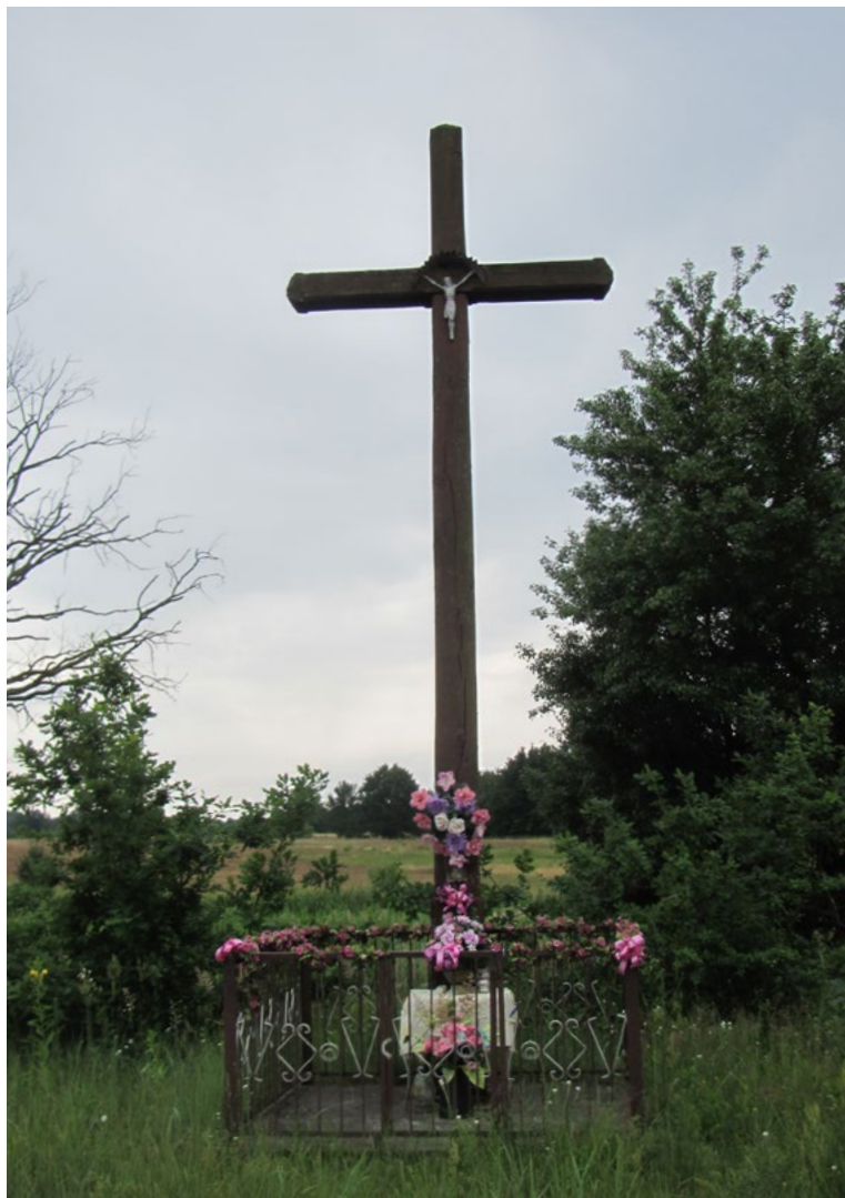
Lokalizacja: Stasipole; Czas powstania: ok. II połowa XX w.

K rzyż drewniany z figurą Chrystusa osłoniętą blaszanym daszkiem. Ustawiony na podłożu z kostki betonowej. Ogrodzony żelaznym płotkiem z furtką od frontu.