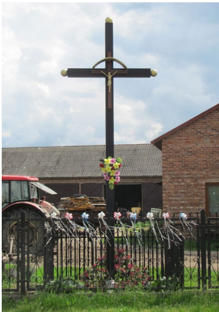
Lokalizacja: Chajęty, ul. Wspólna; Czas powstania: ok. II połowa XX w.

K rzyż żelazny, gałkowy, z figurą Chrystusa osłoniętą blaszanym daszkiem. Ogradzony żelaznym płotkiem.