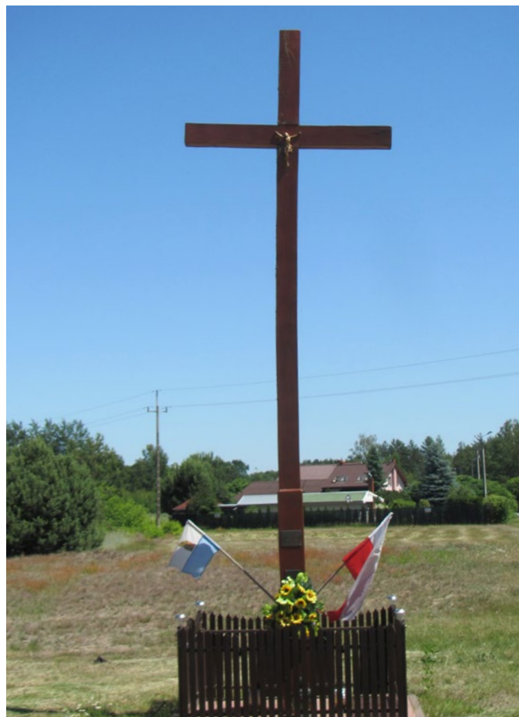
Lokalizacja: Ludwinów, skrzyżowanie z drogą do Kowalichy; Czas powstania: 2015 r.

K rzyż żelazny na kamiennym cokole. Krzyż gałkowy, promienisty, z figurą Chrystusa. Cokół dwustopniowy, zwężający ku górze, wnekowy. We wnęce płaskorzeźba. Na cokole od frontu nieczytelne napisy oraz data „1895”. Ustawiony na betonowym podłożu, ogrodzony żelaznym płotkiem.