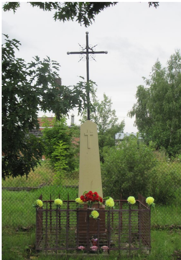
Lokalizacja: Guzowatka; Czas powstania: ok. początek XX w.

K rzyż żelazny, gałkowy, promienisty, z figurą Chrystusa osłoniętą blaszanym daszkiem. Krzyż kowalskiej roboty, z ażurowymi zdobieniami wzdłuż ramion. Na kamiennym, dwustopniowym, zwężającym się do góry cokole. Na drugim stopniu od ziemi pusta wnęka