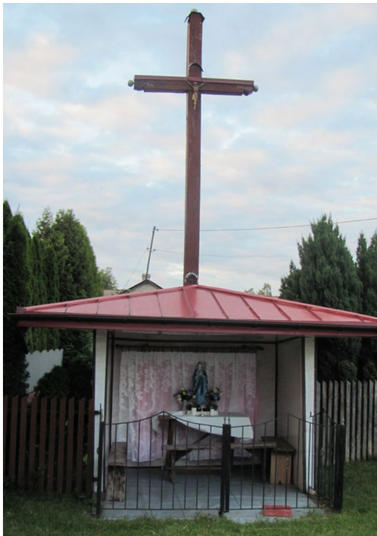
Lokalizacja: Karolew; Czas powstania: ok. początek XXI w.

K rzyż drewniany z figurą Chrystusa osłoniętą blaszanym daszkiem. Ramiona krzyża zakończone żelaznymi gałkami. Przy krzyżu kaplica otwarta osłonięta dachem blaszanym zwieńczonym krzyżem. Wewnątrz kaplicy figura Matki Bożej Różańcowej ustawiona na drewnianym stoliku. Po obydwu stronach stolika drewniane ławki. Stolik i ławki ustawione na betonowym podłożu. Kapliczka ogrodzona żelaznym płotkiem, otwieranym od frontu.