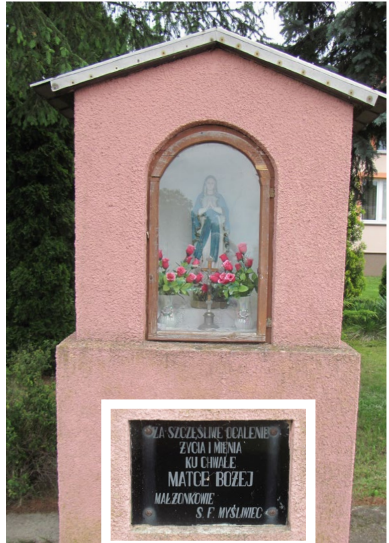
Lokalizacja: Kowalicha; Czas powstania: ok. I połowa XX w.

K apliczka murowana domkowa z dachem czterosпадowym łamanym zwieńczonym krzyżem żelaznym z figurą Chrystusa osłoniętą blaszanym daszkiem. Ogrodzona żelaznym płotkiem z furtką od frontu.