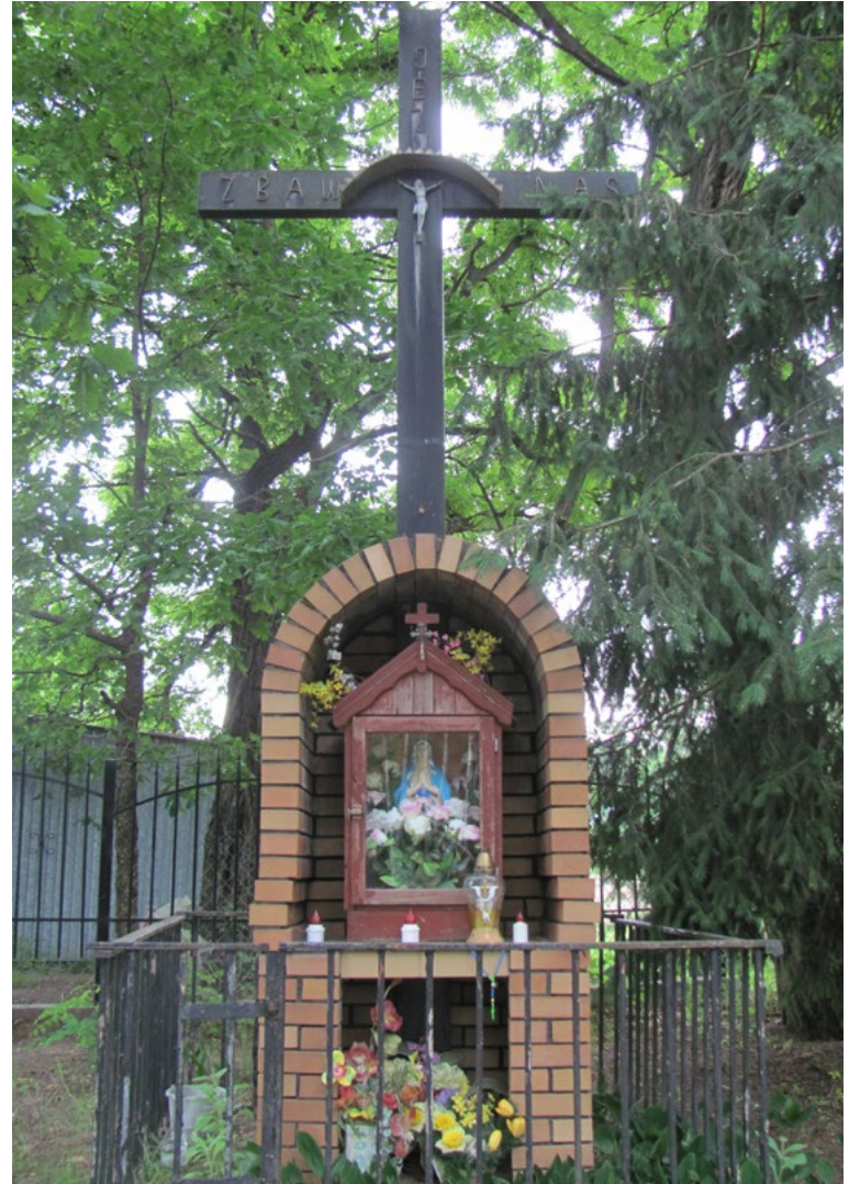
Lokalizacja: Czarnów; Czas powstania: ok. przełom XX i XXI w.

Kapliczka wisząca, drewniana, z daszkiem dwuspadowym, z figurą Najświętszej Maryi Panny.