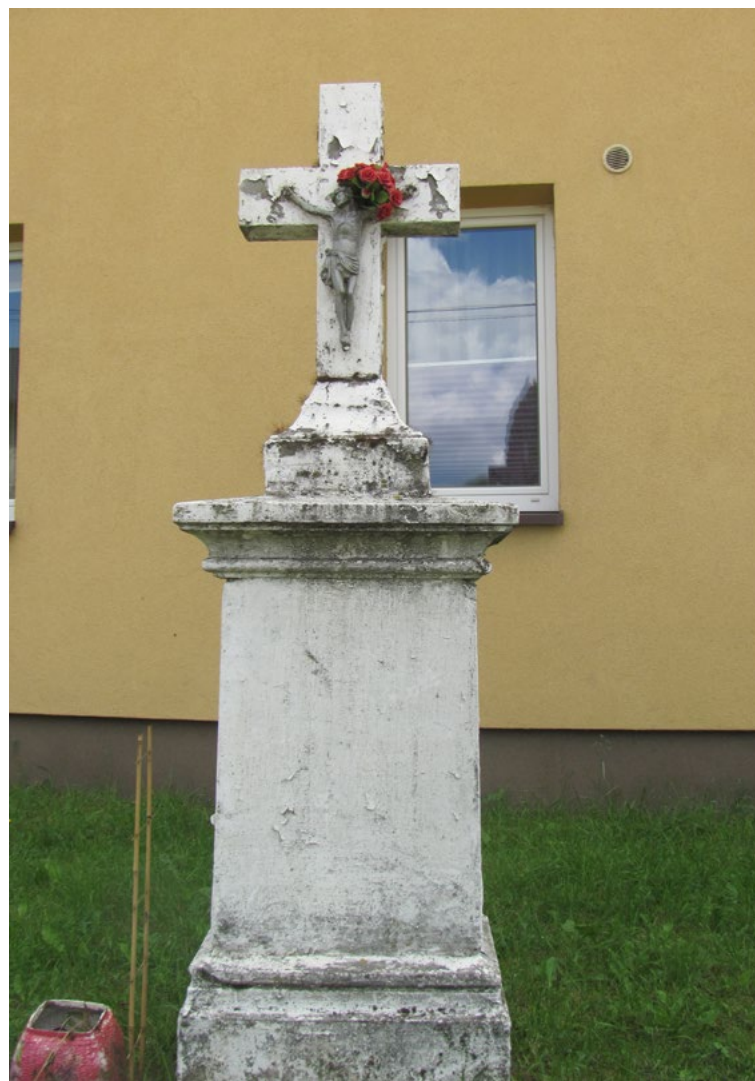
Lokalizacja: Chajęty, ul. Wspólna; Czas powstania: ok. I połowa XX w.

K rzyż żelazny, gałkowy, z figurą Chrystusa osłoniętą blaszanym daszkiem. Ogradzony żelaznym płotkiem.