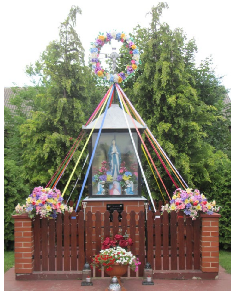
Lokalizacja: Lasków; Czas powstania: 1994 r.

Krzyż drewniany z figurą Chrystusa i kapliczką wewnęką. Ramiona krzyża zaokrąglone. W dolnej części pionowej belki wewnątrz zamknięta szybka z figurą Najświętszej Maryi Panny. Na poziomej belce napis: „JEZU WYBAW DUSZĘ JEJ”. Pod kapliczką, na belce daty: „14 IX 1953 – 7 IX 2019”. Ustawiony na betonowym podłożu. Ogrodzony drewnianym płotkiem.