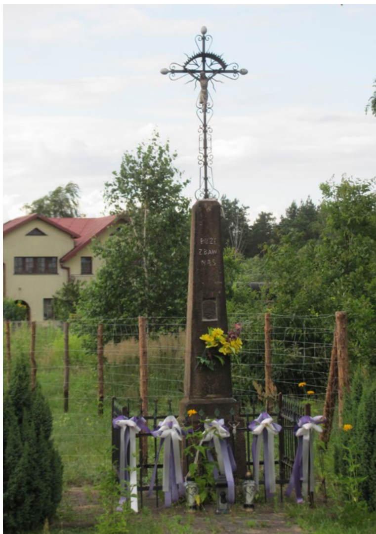
Lokalizacja: Lasków; Czas powstania: 1906 r.

K rzyż żelazny, gałkowy, promienisty, z figurą Chrystusa osłoniętą blaszanym daszkiem. Krzyż kowalskiej roboty, wzdłuż ramion i pionowej belki ażurowe ornamenty. Krzyż na kamiennym, kilkustopniowym, zwężającym się do góry cokole. Na cokole od frontu napis: „BOŻE ZBAW NAS”, poniżej wnęka z płaskorzeźbą. W dolnej części cokołu data „1906 R.”. Ogrodzony żelaznym płotkiem.