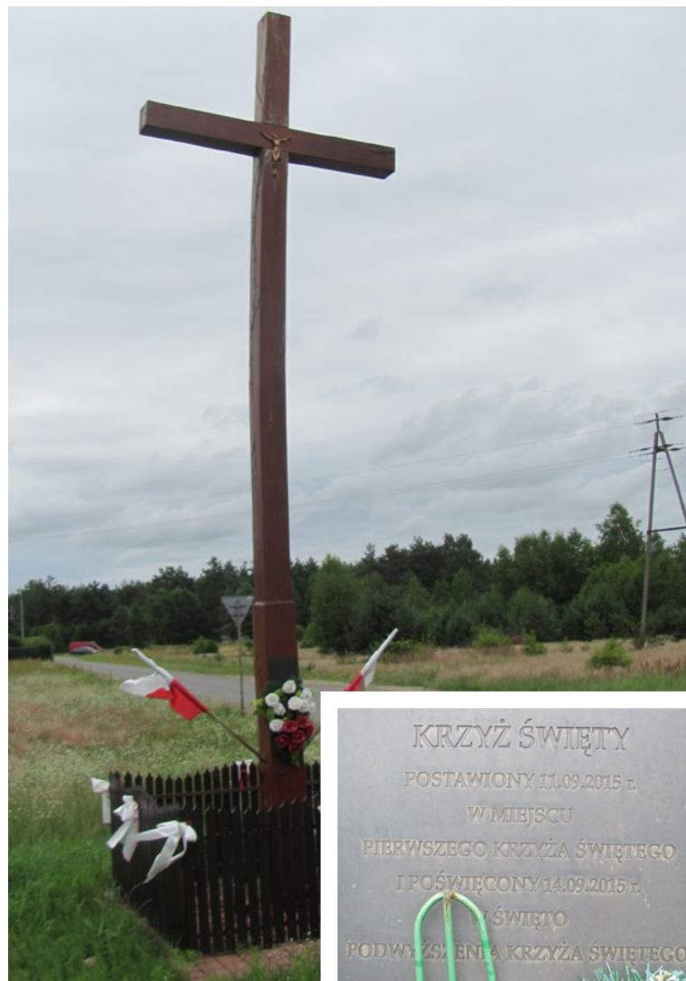
Lokalizacja: Józefów; Czas powstania: 2015 r.

K rzyż żelazny na kamiennym cokole. Krzyż z figurą Chrystusa, z ażurowymi ornamentami wzdłuż ramion i pionowej belki. Na cokole reprodukcja obrazu Matki Bożej Częstochowskiej. Ogradzony żelaznym płotkiem.