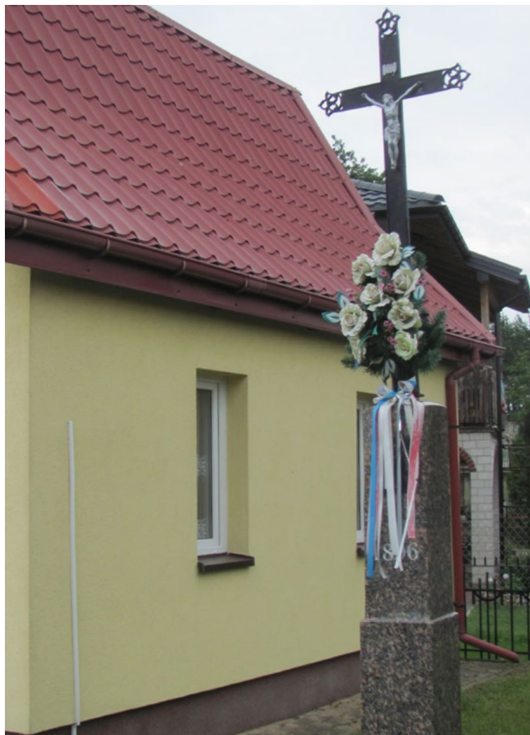
Lokalizacja: Dręszew; Czas powstania: 1896 r.

N adrzewna kapliczka drewniana, skrzynkowa. W zamkniętej szybką wewnątrz reprodukcja obrazu z wizerunkiem Matki Bożej z Dzieciątkiem.