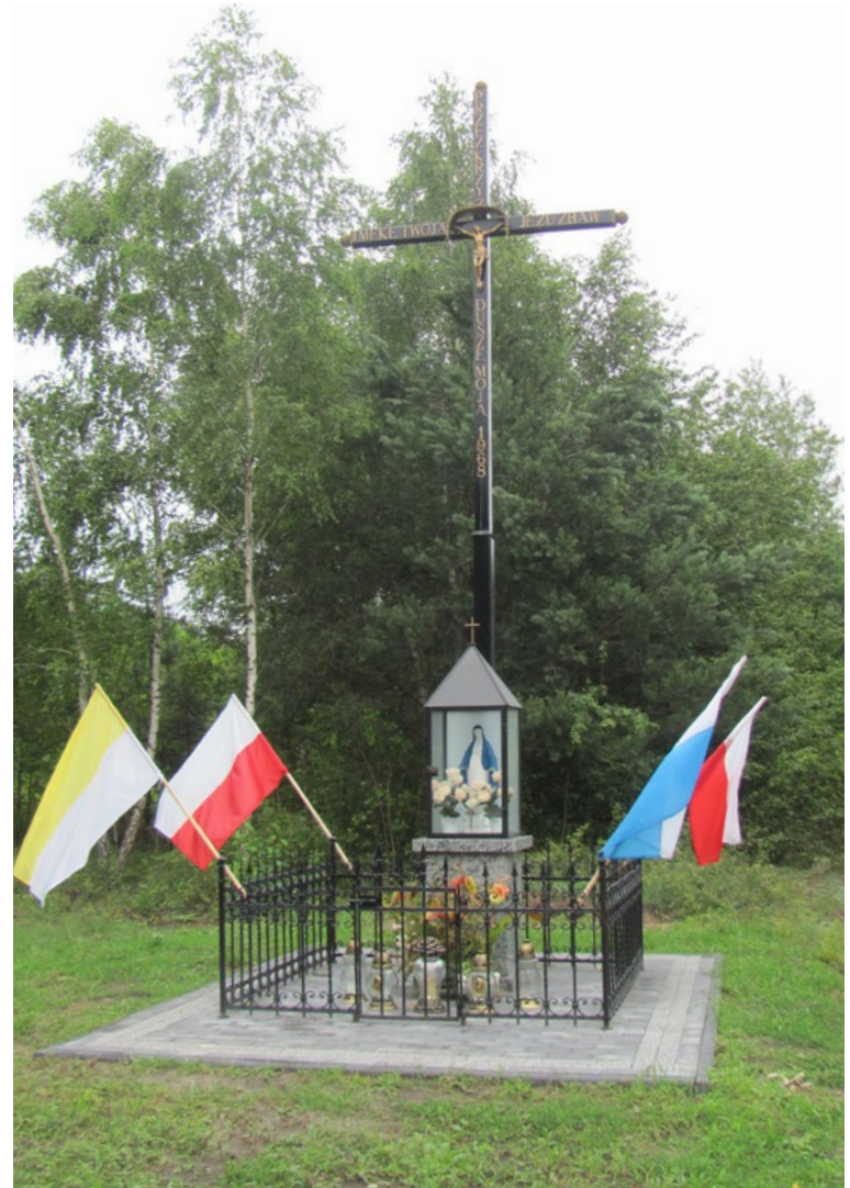
Lokalizacja: Kołaków; Czas powstania: 1968 r.

K rzyż żelazny gałkowy z figurą Chrystusa na murowanym cokole z przeszkloną wnęką. We wnęce figura Najświętszej Maryi Panny. Pod wnęką tablica z napisem: „O MARYJO NIEPOKALANIE POCZĘTA MÓDL SIĘ ZA NAMI I.V.1937 R. ODN. I.V.2006 R. D.W.”