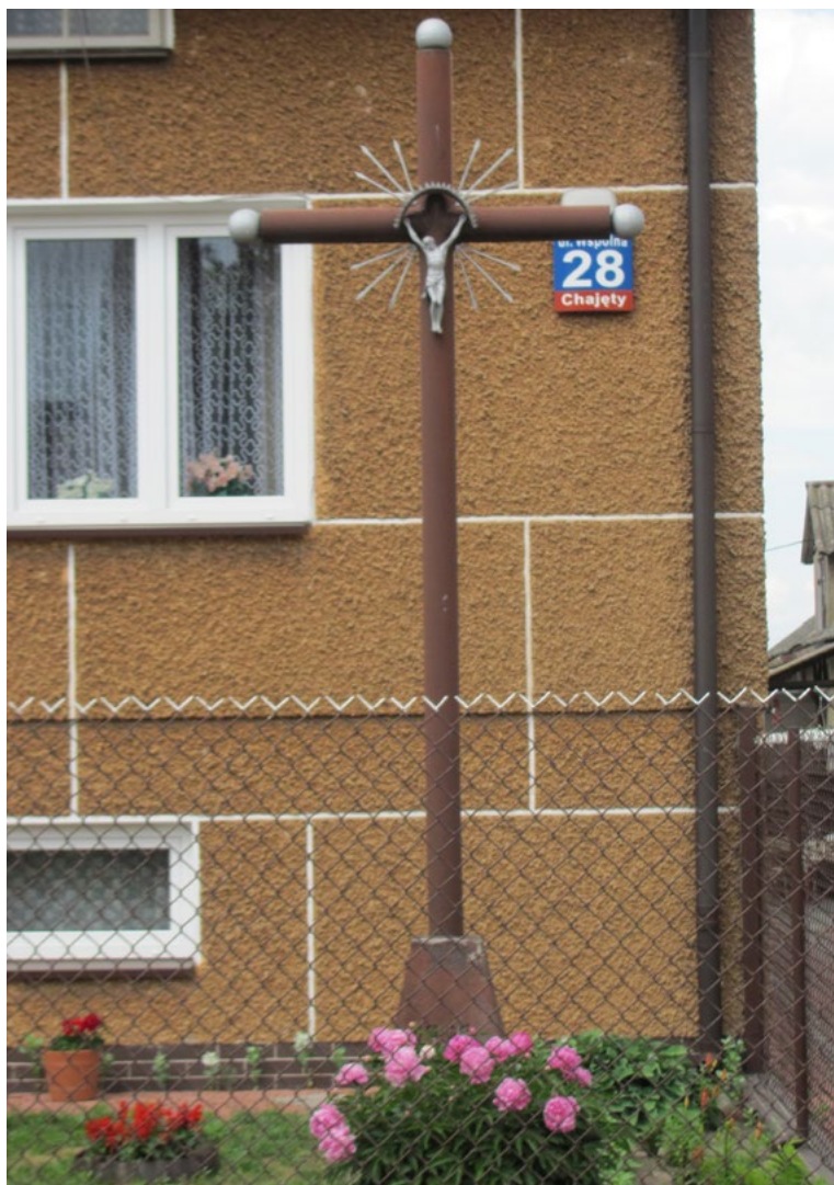
Lokalizacja: Chajęty, ul. Wspólna; Czas powstania: 1982 r.

K rzyż żelazny, promienisty, gałkowy z figurą Chrystusa osłoniętą blaszanym daszkiem. Na murowanym cokole data „1982”.