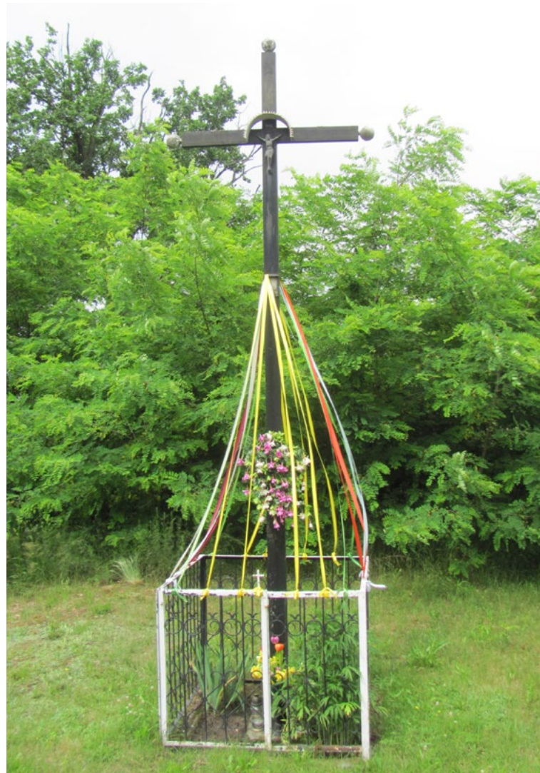
Lokalizacja: Sokołówek; Czas powstania: 1979 r.

K rzyż żelazny z figurą Chrystusa. Ustawiony na betonowym podłożu, ogrodzony żelaznym płotkiem. Od frontu na płotku tabliczka z napisem: „BRONICIE KRZYŻA OD GIEWONTU DO BAŁTYKU JAN PAWEŁ II”.