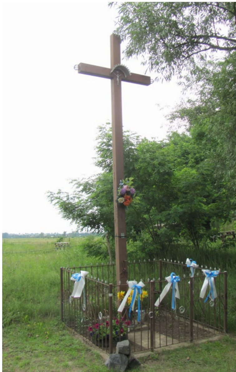
Lokalizacja: Stasipole; Czas powstania: 1990 r.

K rzyż żelazny gałkowy z figurą Chrystusa osłoniętą blaszanym daszkiem. W dolnej części pionowej belki data „1990”. Ustawiony na betonowym podłożu. Ogrodzony żelaznym płotkiem.