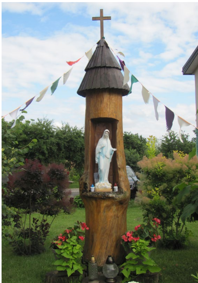
Lokalizacja: Dąbrówka, ul. Kościelna; Czas powstania: 1981 r.

K apliczka drewniana, słupowa, wnękowa z daszkiem stożkowym zwieńczonym krzyżem prostym. We wnęce figura Matki Bożej. Napis: „KRALJICA MIRA MEDUGORJE 24.8.1981”.