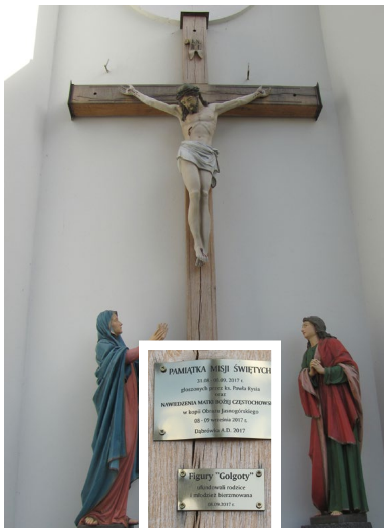
Lokalizacja: Dąbrówka, na terenie przy kościele; Czas powstania: 2017 r.