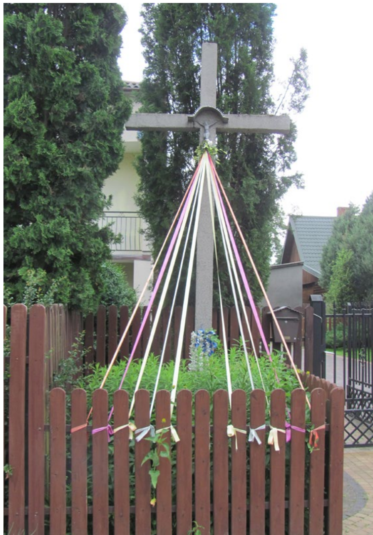
Lokalizacja: Kuligów, ul. Wojska Polskiego; Czas powstania: ok. II połowa XX w.

K apliczka murowana, wnątkowa, dwupoziomowa, otynkowana, zwieńczona płaskim daszkiem. We wnętrzu figura Matki Bożej Różańcowej.