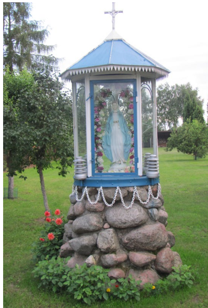
Lokalizacja: Karolew; Czas powstania: ok. początek XXI w

K apliczka murowana, węgkowa, dwupoziomowa, z daszkiem dwuspadowym. W półokrągłej wnęce figura Najświętszej Maryi Panny. Nad wnątką w szczycie data „1960 R.” Na pierwszym od ziemi poziomie mało czytelny napis: „MARYJO KRÓLOWO POLSKI MÓDL SIĘ ZA NAMI”.