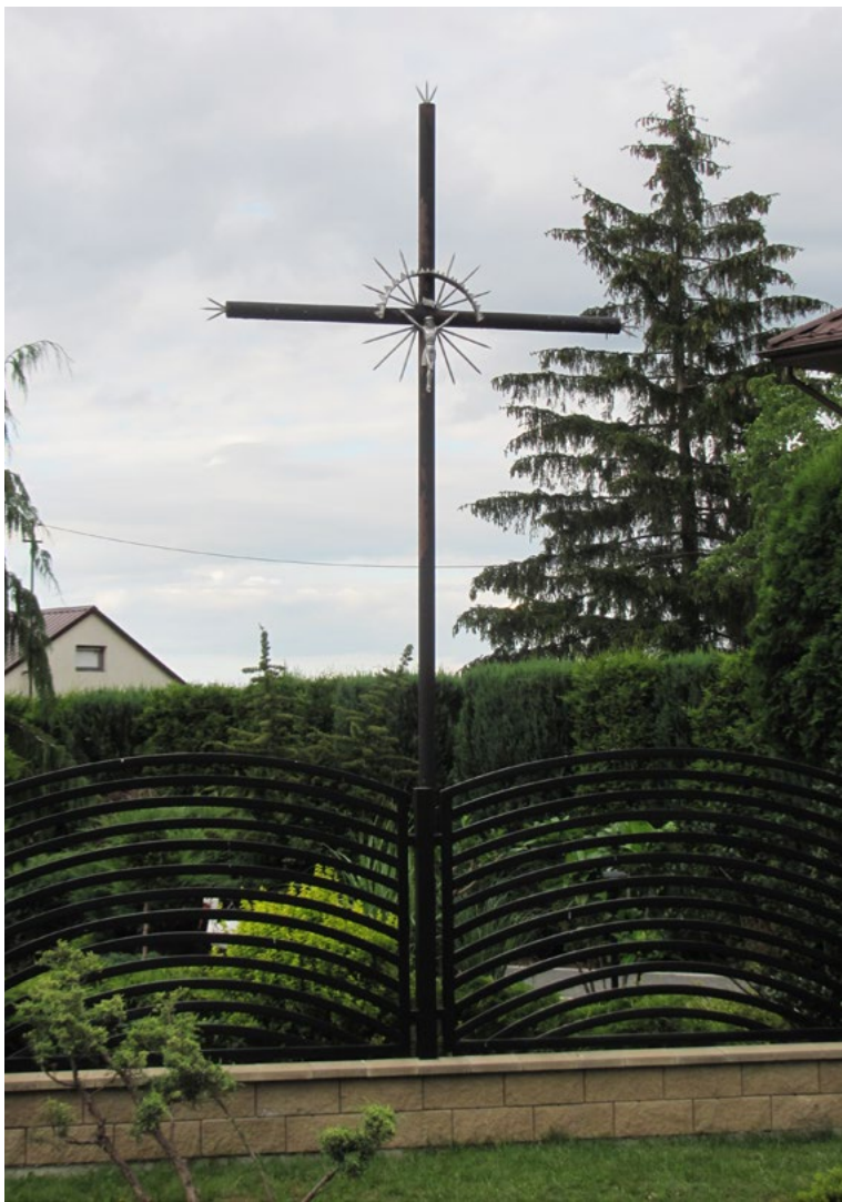
Lokalizacja: Karpin; Czas powstania: ok. początek XXI w.

K rzyż żelazny, promienisty z figurą Chrystusa osłoniętą blaszanym daszkiem. Ramiona krzyża zakończone żelaznymi promieniami.