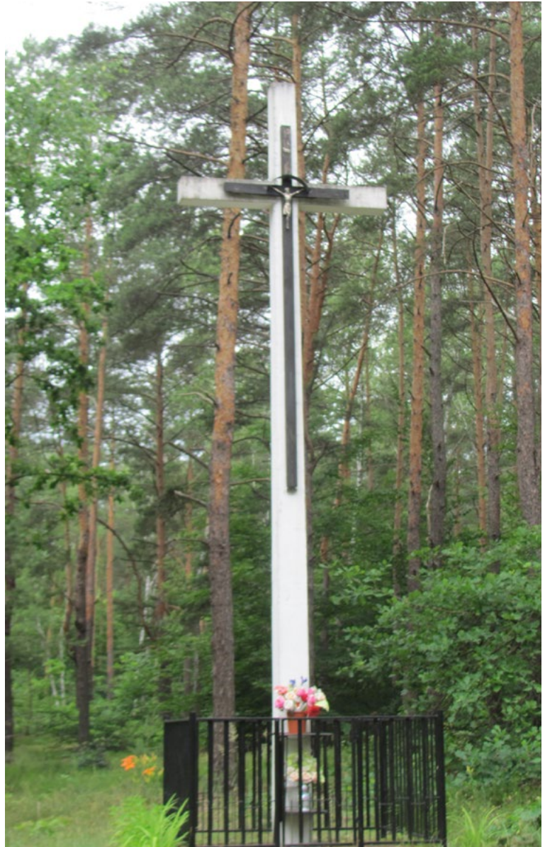
Lokalizacja: Cisie; Czas powstania: ok. II połowa XX w.

K rzyż drewniany z figurą Chrystusa osłoniętą blaszonym daszkiem przymocowany do większego krzyża betonowego. Ustawiony na podłożu z kostki, ogrodzony żelaznym płotkiem.