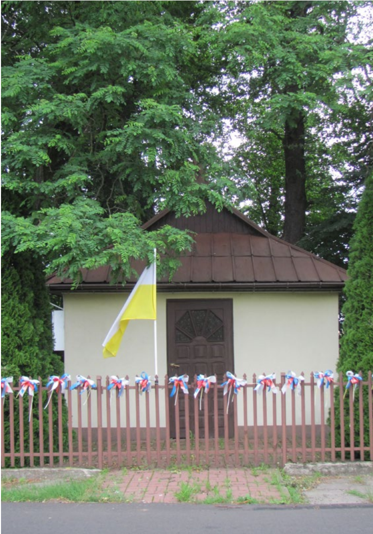
Lokalizacja: Marianów; Czas powstania: ok. II połowa XX w.

M urowana kapliczka domkowa kryta dachem czterospadowym łamanym zwieńczonym stożkową wieżyczką z krzyżem żelaznym. Budynek otynkowany, wejście do budynku w ścianie szczytowej. W ścianach bocznych prostokątne okna. Ogrodzona żelaznym płotkiem.