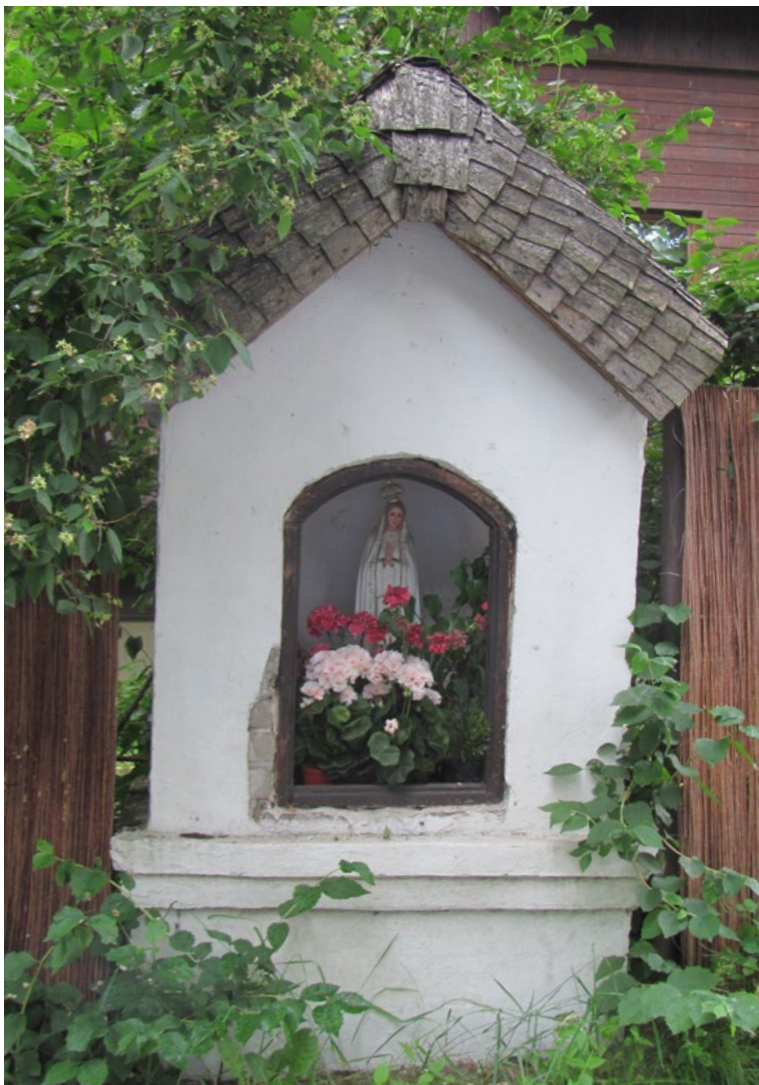
Lokalizacja: Czarnów; Czas powstania: ok. I połowa XX w.

K apliczka murowana dwupoziomowa, wnękowa, otynkowana. Kryta drewnianym, dwuspadowym daszkiem. Wnęka zamknięta półokrągłą szybą. Wewnątrz figura Matki Bożej Fatimskiej.