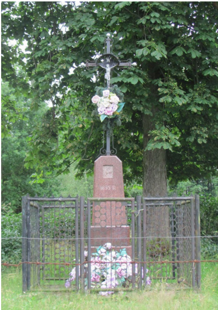
Lokalizacja: Kowalicha; Czas powstania: 1895 r.

K rzyż żelazny na granitowym, wielostopniowym cokole. Krzyż kowalskiej roboty, promienisty, gałkowy, z figurą Chrystusa osłoniętą blaszanym daszkiem. Wzdłuż obydwu belek krzyża, poziomej i pionowej, ozdobne ornamenty. Na najwyższym od ziemi poziomie cokołu pusta wnęka. Pod wnątką data: „1895 R”. Ogrodzony żelaznym płotkiem z furtką od frontu.