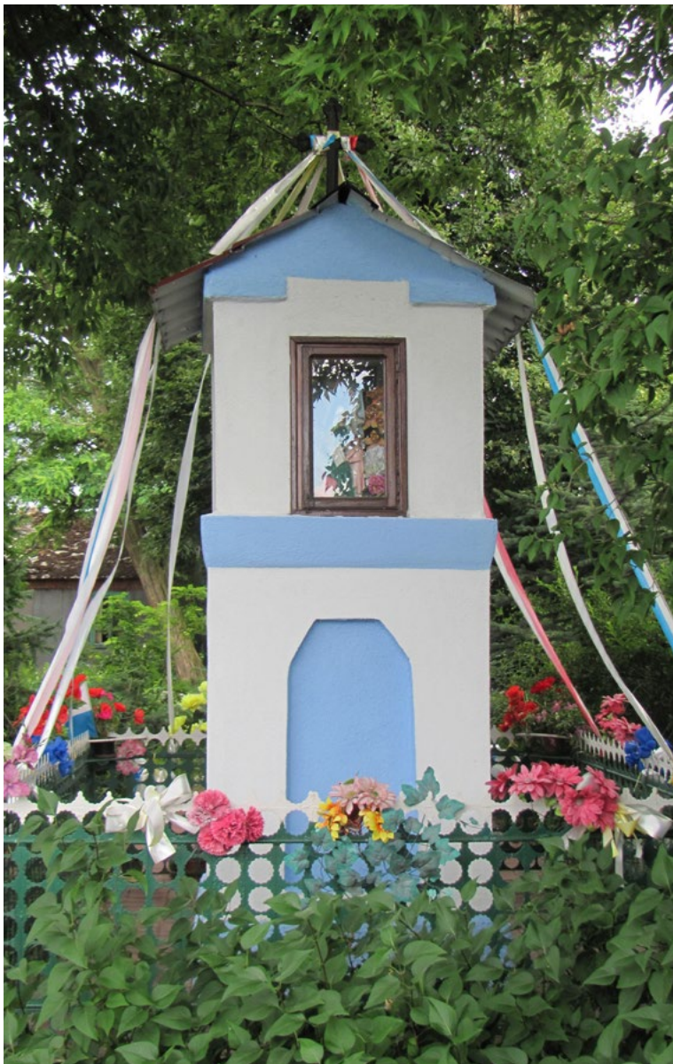
Lokalizacja: Lasków; Czas powstania: ok. I połowa XX w.

K apliczka murowana, wnątkowa, dwupoziomowa, otynkowana. Dwuspadowy blaszany daszek zwieńczony krzyżem żelaznym prostym. We wnęce zamkniętej prostokątną szybą figura Najświętszej Maryi Panny. Druga wnęka, na pierwszym od ziemi poziomie, jest pusta. Ustawiona na betonowym podłożu, ogrodzona żelaznym płotkiem.