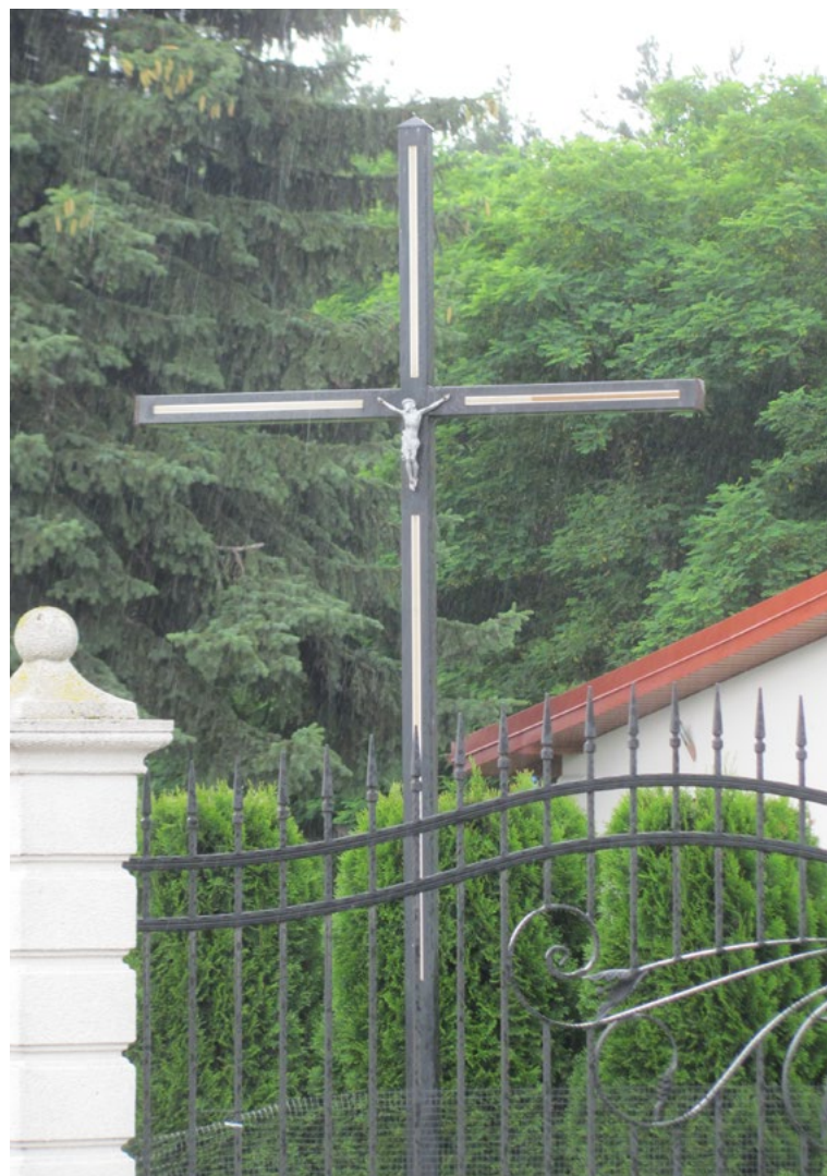
Lokalizacja: Kuligów; Czas powstania: ok. początek XXI w.

K rzyż żelazny z figurą Chrystusa osłoniętą blaszanym daszkiem. Wzdłuż ramion i pionowej belki równoległe relingi. Ustawiony na betonowym podłożu, ogrodzony żelaznym płotkiem.