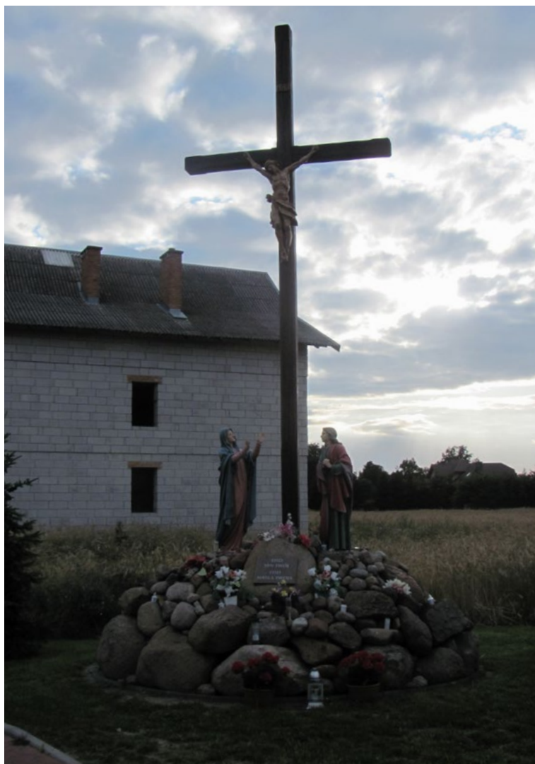
Lokalizacja: Trojany; Czas powstania: początek XXI w.

K rzyż drewniany z figurą Chrystusa na cokole z kamieni polnych. Przy krzyżu dwie figury: Matki Bożej i Marii Magdaleny. Na największym kamieniu położonym centralnie tablica z napisem: „OTO SYN TWÓJ OTO MATKA TWOJA”.