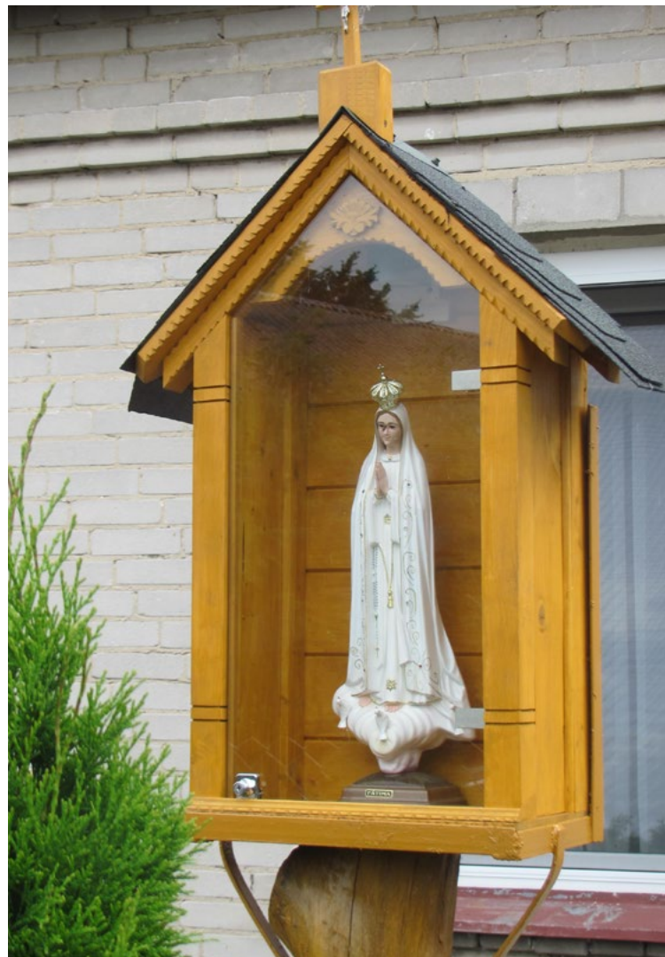
Lokalizacja: Kuligów; Czas powstania: ok. początek XXI w.

K apliczka w typie przeszklonej latarni na murowanym cokole. Czterospadowy blaszany daszek zwieńczony krzyżem żelaznym z figurą Chrystusa osłoniętą blaszanym daszkiem. We wnęce figura Matki Bożej Różańcowej.