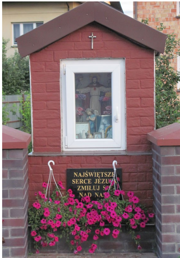
Lokalizacja: Karpin; Czas powstania: 1952 r.

K rzyż żelazny, promienisty z figurą Chrystusa osłoniętą blaszanym daszkiem. Ramiona krzyża zakończone żelaznymi promieniami.