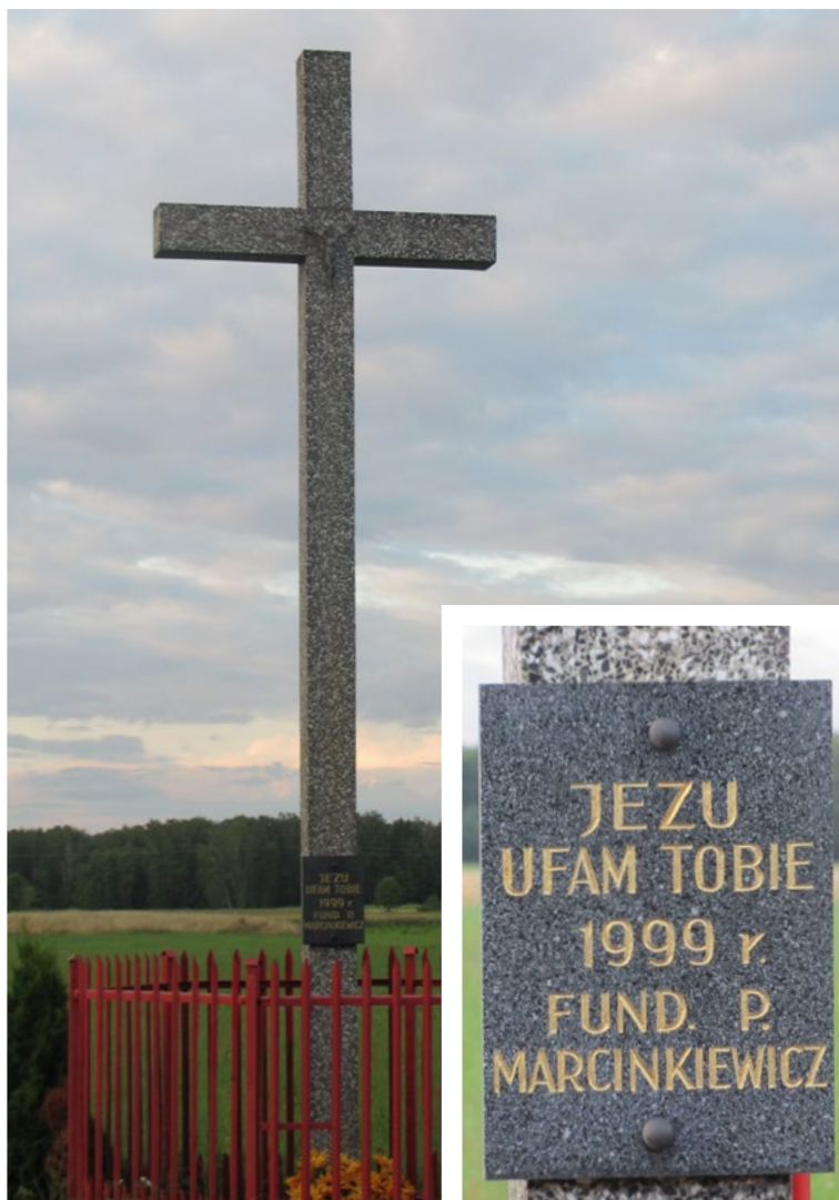
Lokalizacja: Zaścienie; Czas powstania: 1999 r.