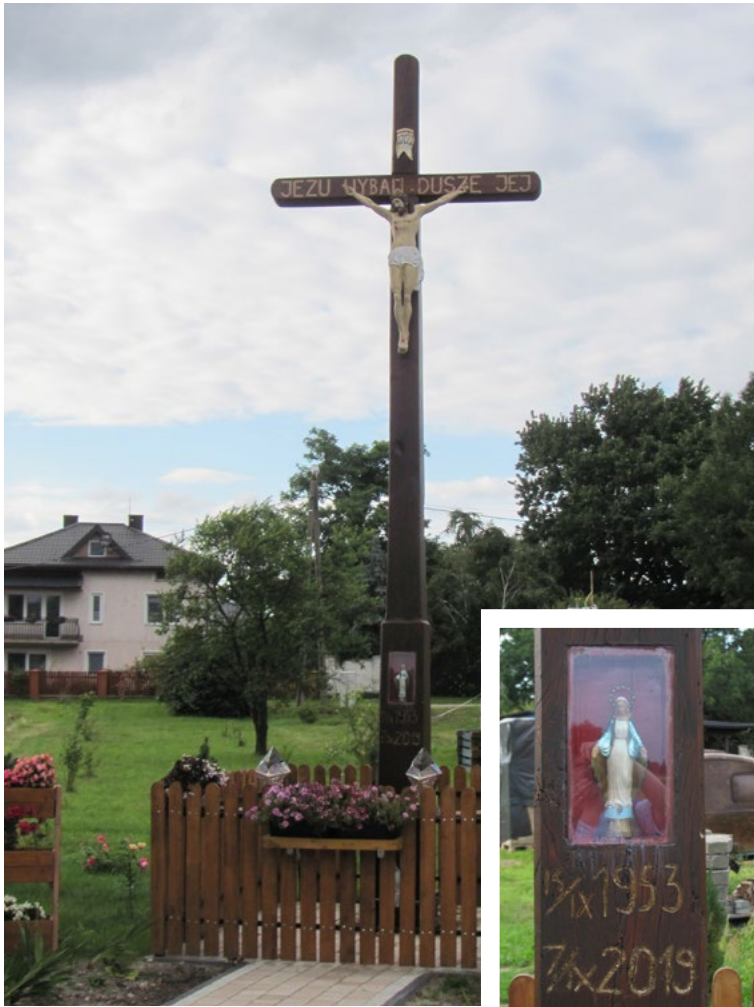
Lokalizacja: Lasków; Czas powstania: 1953 - 2019 r.

Krzyż drewniany z figurą Chrystusa i kapliczką wewnęką. Ramiona krzyża zaokrąglone. W dolnej części pionowej belki wewnątrz zamknięta szybka z figurą Najświętszej Maryi Panny. Na poziomej belce napis: „JEZU WYBAW DUSZĘ JEJ”. Pod kapliczką, na belce daty: „14 IX 1953 – 7 IX 2019”. Ustawiony na betonowym podłożu. Ogrodzony drewnianym płotkiem.