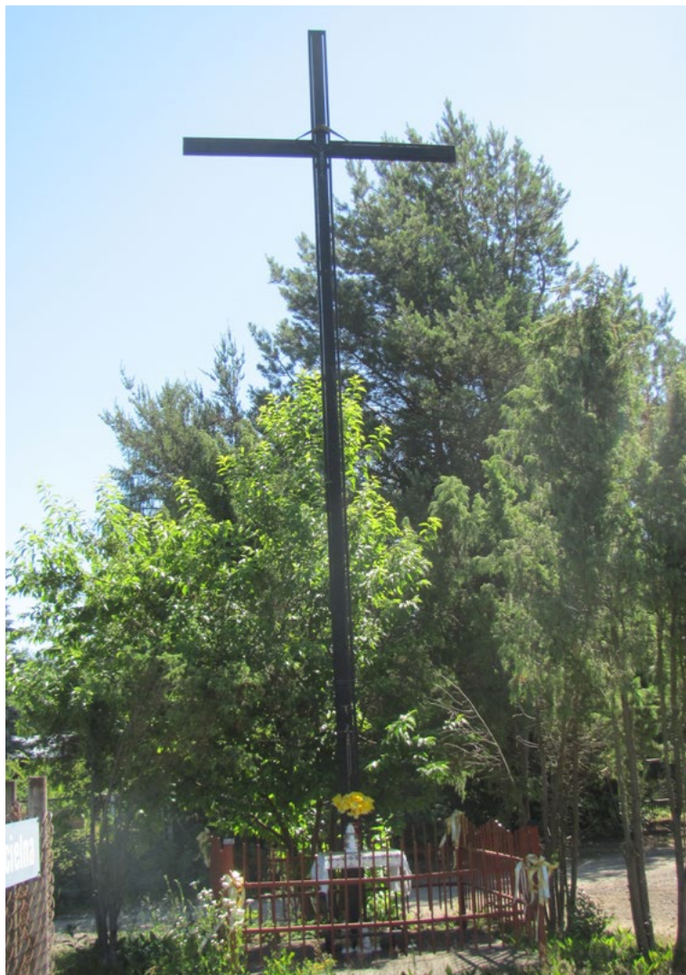
Lokalizacja: Kuligów; Czas powstania: ok. II połowa XX w.

K rzyż żelazny z figurą Chrystusa osłoniętą blaszanym daszkiem. Wzdłuż ramion i pionowej belki równoległe relingi. Ustawiony na betonowym podłożu, ogrodzony żelaznym płotkiem.