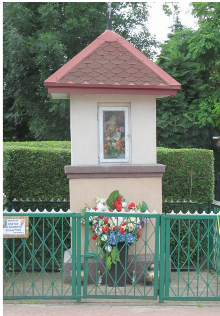
Lokalizacja: Dąbrówka, ul. Kościelna/Krótką; Czas powstania: ok. I połowa XX w.

K apliczka drewniana, słupowa, wnękowa z daszkiem stożkowym zwieńczonym krzyżem prostym. We wnęce figura Matki Bożej. Napis: „KRALJICA MIRA MEDUGORJE 24.8.1981”.