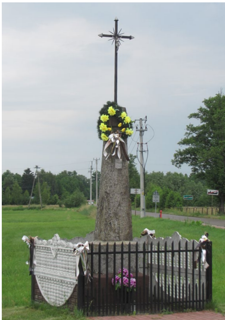
Lokalizacja: Ludwinów, skrzyżowanie z drogą do Kowalichy; Czas powstania: 1895 r.

K rzyż żelazny na kamiennym cokole. Krzyż gałkowy, promienisty, z figurą Chrystusa. Cokół dwustopniowy, zwężający ku górze, wnekowy. We wnęce płaskorzeźba. Na cokole od frontu nieczytelne napisy oraz data „1895”. Ustawiony na betonowym podłożu, ogrodzony żelaznym płotkiem.