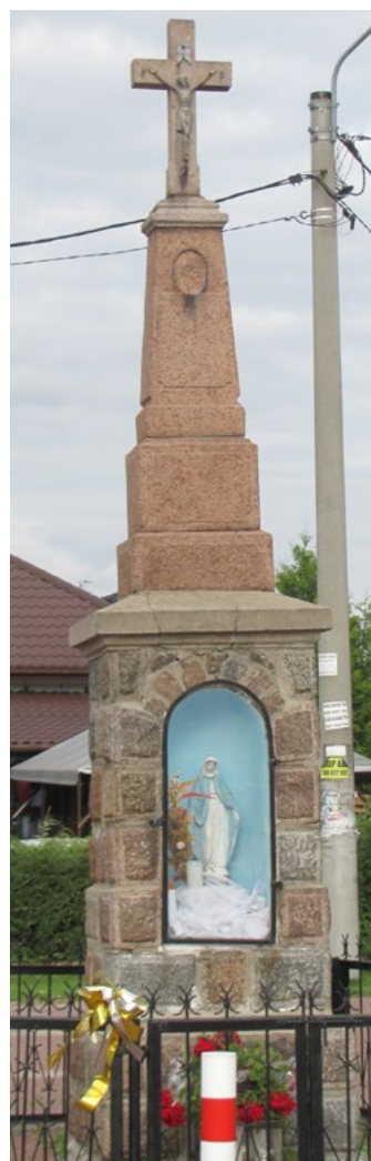
Lokalizacja: Dąbrówka, ul. Kościelna; Czas powstania: ok. początek XX w.