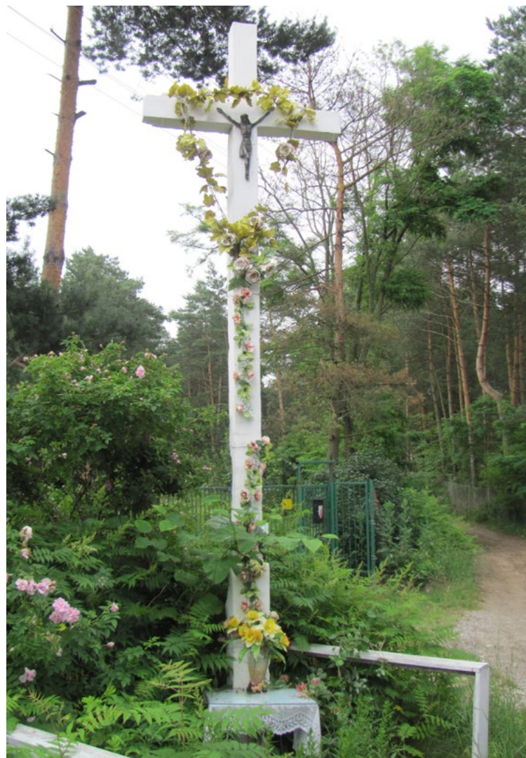
Lokalizacja: Kuligów; Czas powstania: ok. II połowa XX w.

Krzyż żelazny szkieletowej konstrukcji z figurą Chrystusa osłoniętą blaszanym daszkiem. W dolnej części pionowej belki reprodukcja obrazu Matki Bożej Częstochowskiej. Ogradzony żelaznym płotkiem.