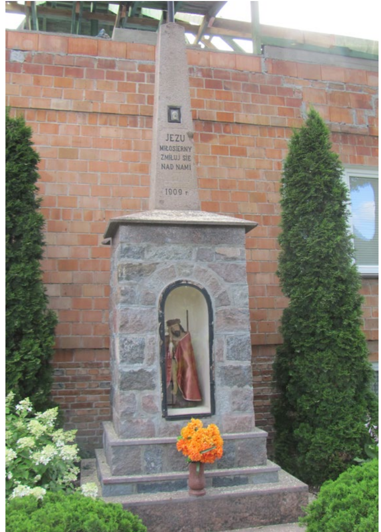
Lokalizacja: Dąbrówka; Czas powstania: 1909 r.

M urowana kapliczka wnękowa kryta dachem wielospadowym zwieńczonym krzyżem żelaznym kowalskiej roboty. Wnęka przeszklona oknem sześciocybowym ze zwieńczeniem półkolistym. Krzyż o ramionach i podstawie w formie ornamentów. We wnęce figura św. Rocha. Kapliczka ogrodzona żelaznym płotkiem z furtką od frontu.