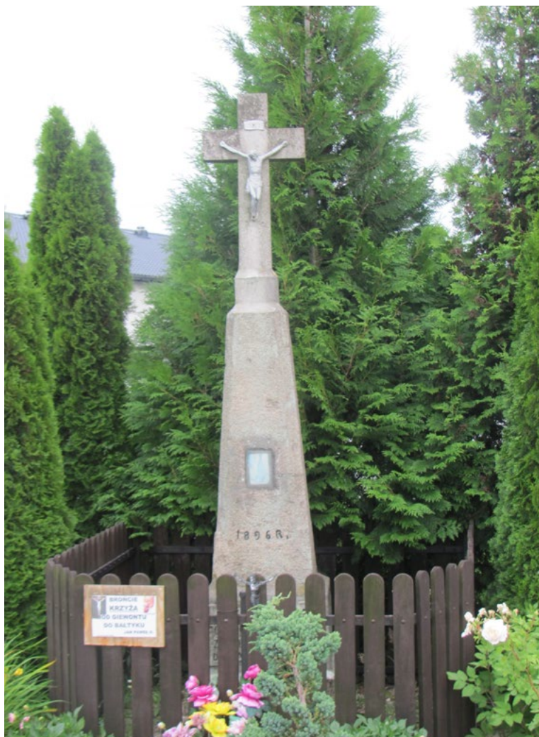
Lokalizacja: Trojany; Czas powstania: 1896 - 1947 - 2007 r.

K rzyż kamienny z figurą Chrystusa na czterostopniowym, zwężającym się do góry cokole. W dolnej części cokołu przeszklona wnęka z niewyraźnym obrazem. Poniżej data: „1896 R.” Na drugim od ziemi stopniu napis: „OD POWIETRZA GŁODU OGNI I WOJNY ZACHOWAJ NAS PANIE D 10 MAJA 1947 R.” Na najniższym, pierwszym od ziemi stopniu data „2007”. Ustawiony na betonowym podłożu. Ogrodzony drewnianym płotkiem. Na płotku tablica z napisem: „BRONIE KRZYŻA OD GIEWONTU DO BAŁTYKU JAN PAWEŁ II”.