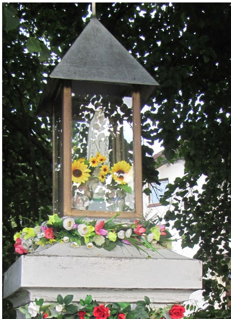
Lokalizacja: Trojany; Czas powstania: 1921 r.

K rzyż kamienny z figurą Chrystusa na czterostopniowym, zwężającym się do góry cokole. W dolnej części cokołu przeszklona wnęka z niewyraźnym obrazem. Poniżej data: „1896 R.” Na drugim od ziemi stopniu napis: „OD POWIETRZA GŁODU OGNI I WOJNY ZACHOWAJ NAS PANIE D 10 MAJA 1947 R.” Na najniższym, pierwszym od ziemi stopniu data „2007”. Ustawiony na betonowym podłożu. Ogrodzony drewnianym płotkiem. Na płotku tablica z napisem: „BRONIE KRZYŻA OD GIEWONTU DO BAŁTYKU JAN PAWEŁ II”.