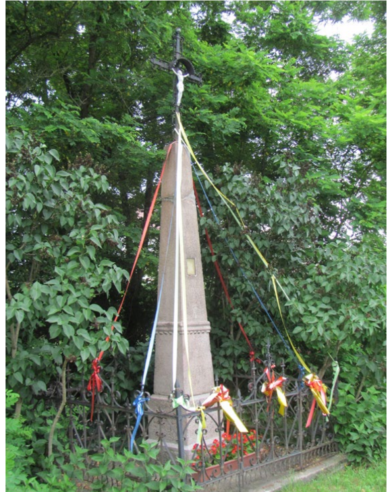
Lokalizacja: Marianów; Czas powstania: 1904 r.

M urowana kapliczka domkowa kryta dachem czterospadowym łamanym zwieńczonym stożkową wieżyczką z krzyżem żelaznym. Budynek otynkowany, wejście do budynku w ścianie szczytowej. W ścianach bocznych prostokątne okna. Ogrodzona żelaznym płotkiem.