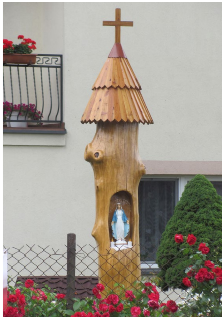
Lokalizacja: Chajęty; Czas powstania: ok. 2018 - 2020 r.

K rzyż żelazny, promienisty, gałkowy z figurą Chrystusa osłoniętą blaszanym daszkiem. Na murowanym cokole data „1982”.