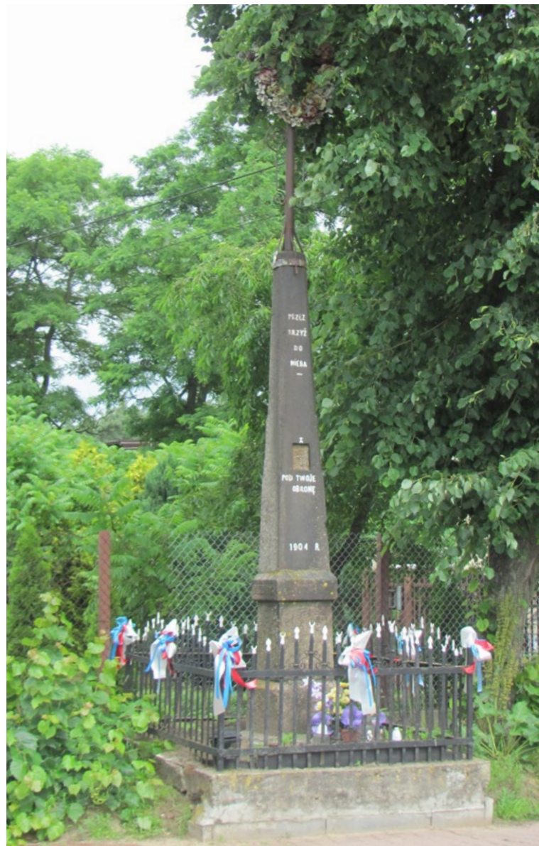
Lokalizacja: Józefów, ul. Kościelna; Czas powstania: 1904 r.

K rzyż żelazny gałkowy z figurą Chrystusa na kamiennym cokole. Krzyż z ażurowymi zdobieniami wzdłuż pionowej belki. Na cokole od frontu pusta wnęka, nad nią napis: „PRZEZ KRZYŻ DO NIEBA”. Poniżej napis: „POD TWOJĄ OBRONĘ” oraz data „1904 R.” Ogradzony żelaznym płotkiem.