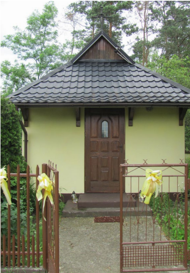
Lokalizacja: Kowalicha; Czas powstania: ok. II połowa XX w.

K apliczka murowana domkowa z dachem czterosпадowym łamanym zwieńczonym krzyżem żelaznym z figurą Chrystusa osłoniętą blaszanym daszkiem. Ogrodzona żelaznym płotkiem z furtką od frontu.