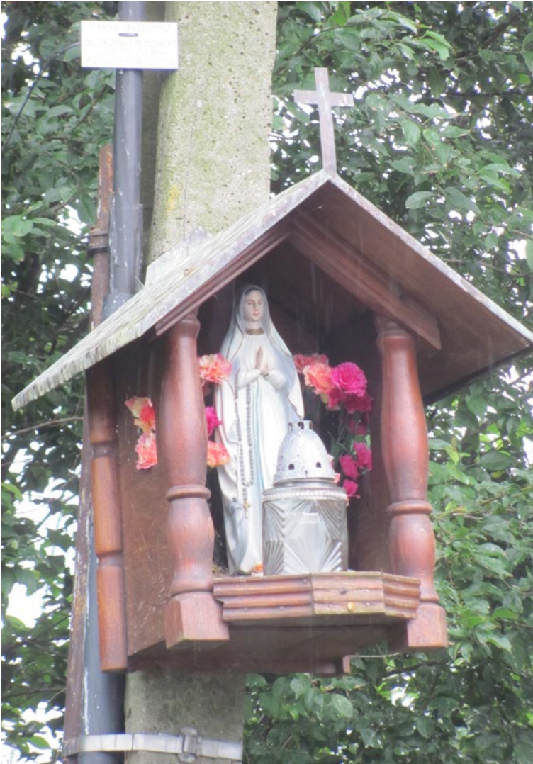
Lokalizacja: Czarnów; Czas powstania: ok. początek XXI w.

Kapliczka wisząca, drewniana, z daszkiem dwuspadowym, z figurą Najświętszej Maryi Panny.