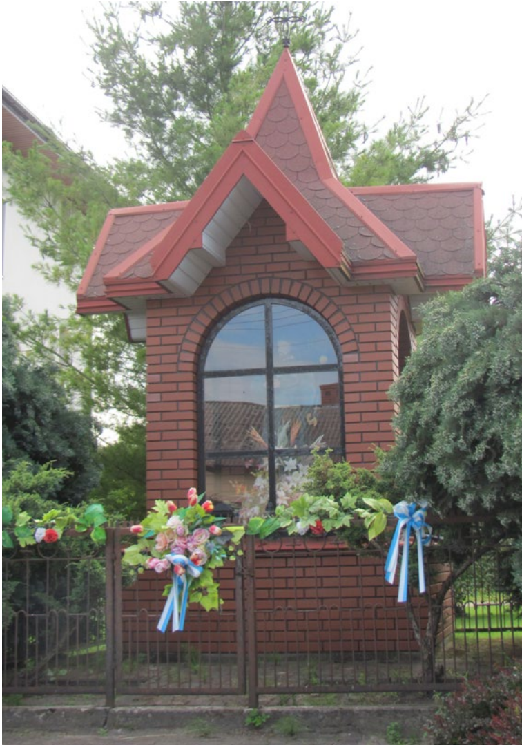
Lokalizacja: Dąbrówka; Czas powstania: ok. XXI w.

M urowana kapliczka wnękowa kryta dachem wielospadowym zwieńczonym krzyżem żelaznym kowalskiej roboty. Wnęka przeszklona oknem sześciocybowym ze zwieńczeniem półkolistym. Krzyż o ramionach i podstawie w formie ornamentów. We wnęce figura św. Rocha. Kapliczka ogrodzona żelaznym płotkiem z furtką od frontu.