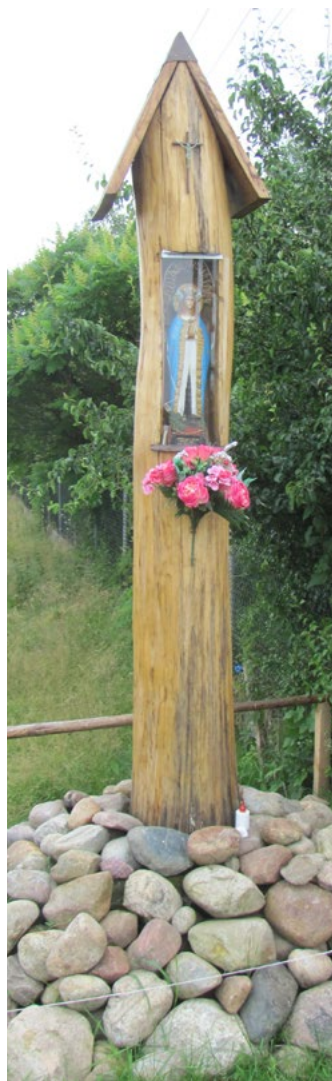
Lokalizacja: Dręszew; Czas powstania: ok. początek XXI w.