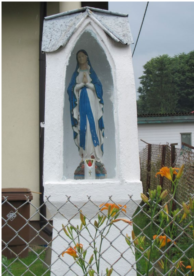
Lokalizacja: Kuligów, ul. Wojska Polskiego; Czas powstania: ok. II połowa XX w.

K apliczka murowana, wnątkowa, dwupoziomowa, otynkowana, zwieńczona płaskim daszkiem. We wnętrzu figura Matki Bożej Różańcowej.