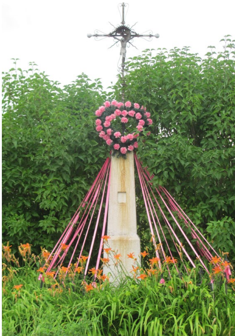
Lokalizacja: Guzowatka; Czas powstania: ok. początek XX w.

K rzyż żelazny, gałkowy, promienisty, z figurą Chrystusa osłoniętą blaszanym daszkiem. Krzyż kowalskiej roboty, z ażurowymi zdobieniami wzdłuż ramion. Na kamiennym, dwustopniowym, zwężającym się do góry cokole. Na drugim stopniu od ziemi pusta wnęka