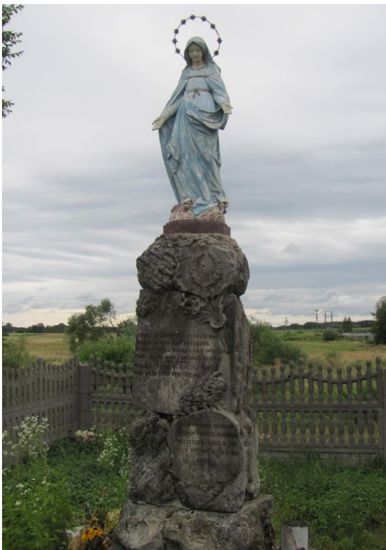
Lokalizacja: Guzowatka; Czas powstania: 1939 r.

M urowana kapliczka słupowa z figurą Najświętszej Maryi Panny. Słup w formie rzeźbionych w kamieniu ornamentów organicznych z wkomponowanymi dwiema tablicami. Na tablicach sentencje. Górna zwieńczona rzeźbionym w kamieniu wieńcem laurowym, dolna bukietem róż. Na górnej tablicy napis: „MATKO NAJŚWIĘTZA NIEPOKALANA TWOJA OPIEKA NAM POŻĄDANA ŁASKA TWOJA NIECHAJ