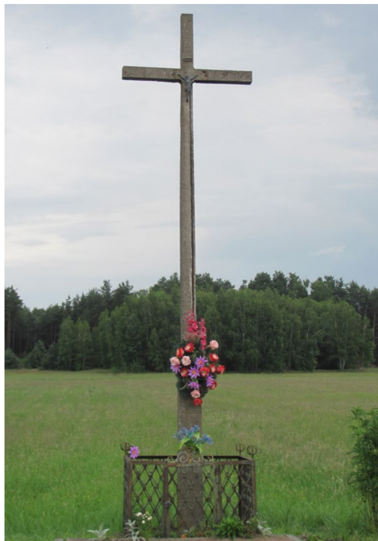
Lokalizacja: Ludwinów; Czas powstania: ok. II połowa XX w.

K apliczka drewniana w typie przeszklonej latarni z figurą Matki Bożej Fatimskiej na murowanym cokole. Daszek dwuspadowy drewniany zwieńczony krzyżem. Na cokole od frontu napis: „WOTUM Wdzięczności za PAMIĘĆ POLAKA 52 LATA PRACY PEDAGOGICZNEJ RODZINĘ”. Ustawiona na betonowym podłożu.