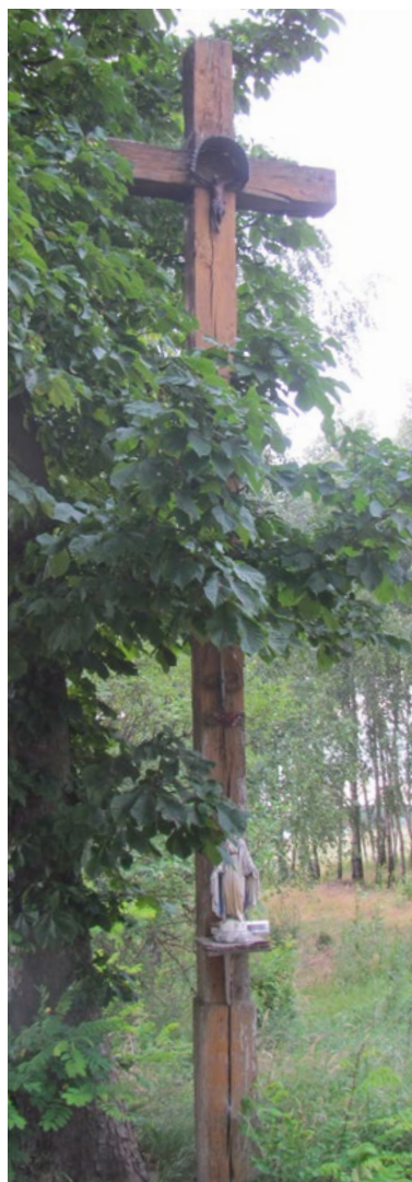
Lokalizacja: Wszebory Kolonia; Czas powstania: 1966 r.

K rzyż żelazny, promienisty, z figurą Chrystusa osłoniętą blaszanym daszkiem. Krzyż na kamiennym, dwustopniowym, zwężającym się do góry cokole. Na drugim od ziemi stopniu pusta wnęka. Ogrodzony żelaznym płotkiem.