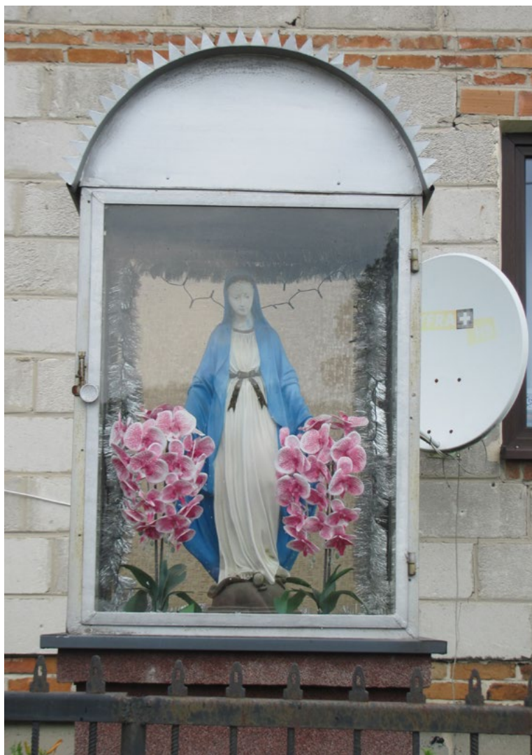
Lokalizacja: Cisie; Czas powstania: ok. II połowa XX w.

K apliczka żelazna w typie przeszklonej latarni, zwieńczona półokrągłym daszkiem. We wnętrzu figura Najświętszej Maryi Panny. Ustawiona na murowanym cokole.