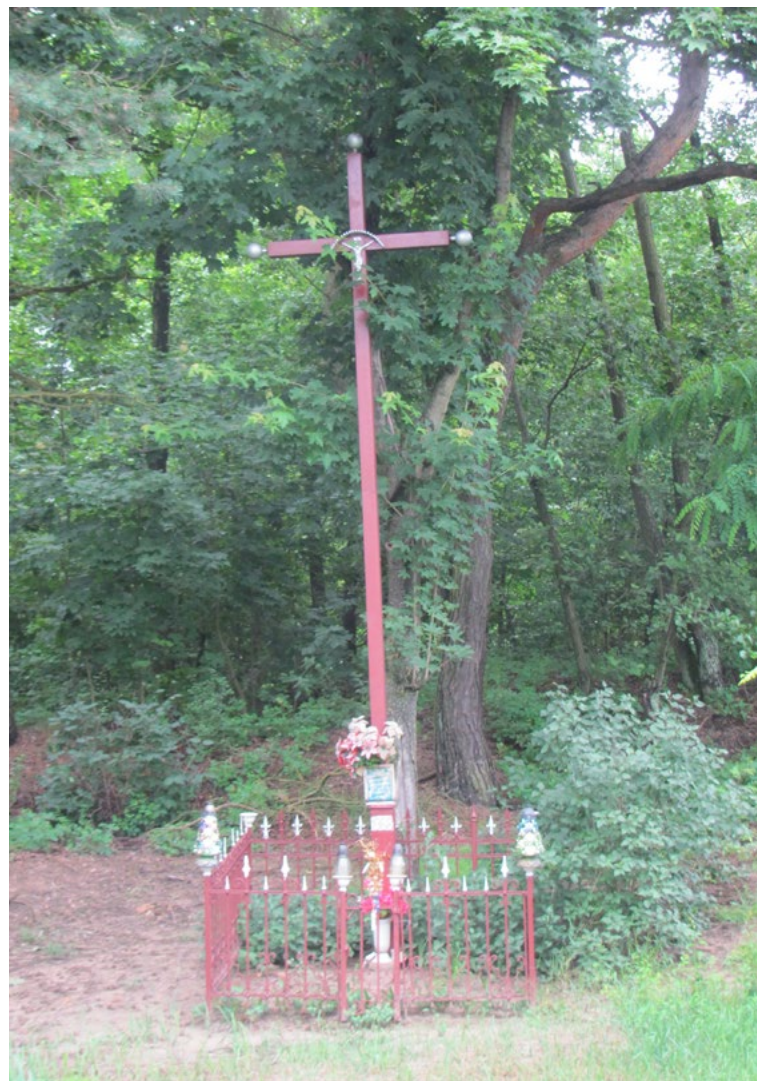
Lokalizacja: Działy Czarnowskie; Czas powstania: 1968 r.

K rzyż żelazny prosty z figurą Chrystusa osłoniętą blaszanym daszkiem. Ustawiony na betonowym podłożu, ogrodzony żelaznym płotkiem.