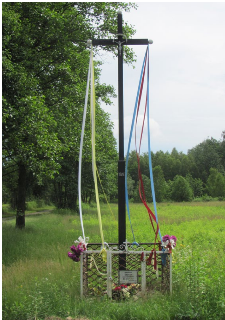
Lokalizacja: Sokołówek; Czas powstania: 1966 r.

K rzyż żelazny, gałkowy, z figurą Chrystusa osłoniętą blaszonym daszkiem. Na pionowej belce, w dolnej części, data „1966”. Ogradzony żelaznym płotkiem.