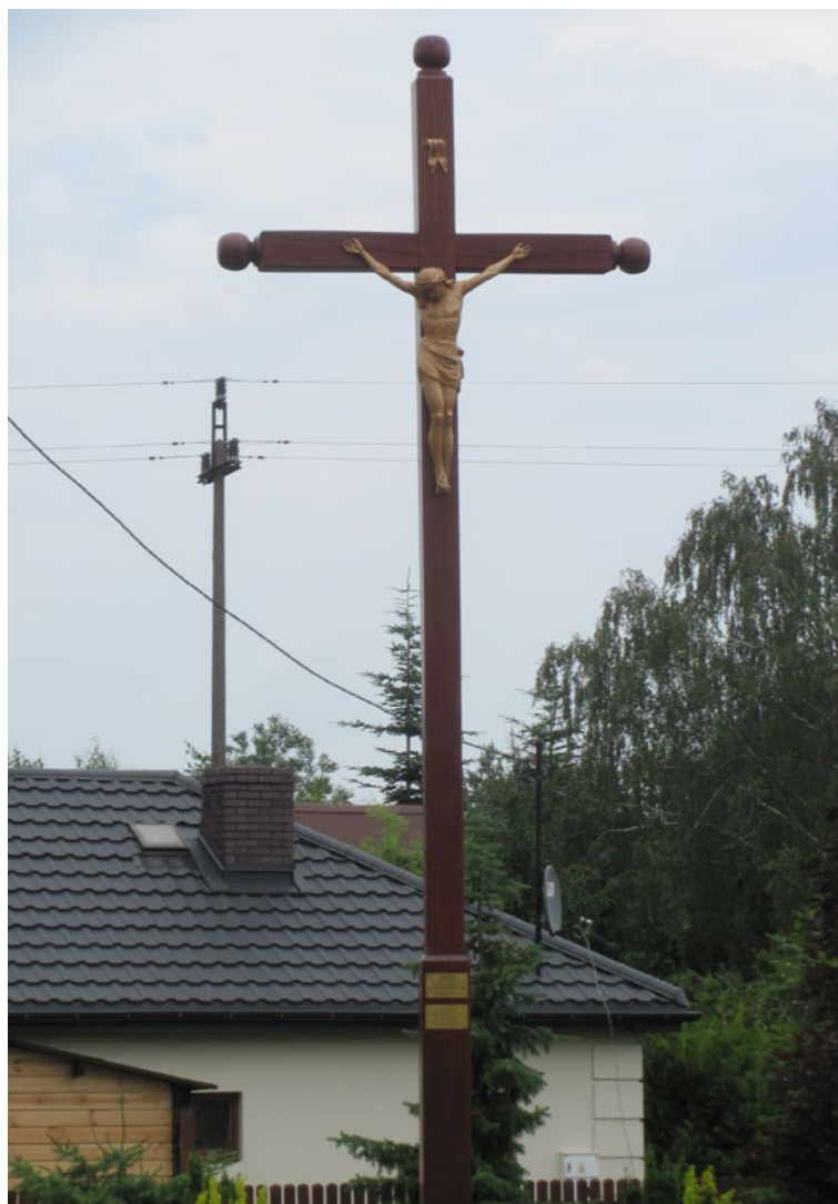
Lokalizacja: Kuligów; Czas powstania: ok. II połowa XX w.

F igurka Chrystusa Frasobliwego w zaimprovizowanym uchwycie w pniu drzewa.