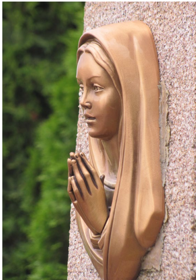
Lokalizacja: Ślężany; Czas powstania: ok. początek XX w.

K rzyż żelazny na kamiennym cokole. Krzyż z figurą Chrystusa, promienisty, kowalskiej roboty, z ażurowymi ornamentami wzdłuż obu belek. Cokół trójstopniowy, na najwyższym stopniu napis: „JEZU ZMIŁUJ SIĘ NAD NAMY”. Na drugim od ziemi stopniu płaskorzeźba z wizerunkiem Najświętszej Maryi Panny, niżej napis: „POD TWOJĄ OBRONĘ”. U nasady krzyża figura Najświętszej Maryi Panny. Ustawiony na podłożu z kostki betonowej. Ogrodzony żelaznym płotkiem z furtką od frontu.