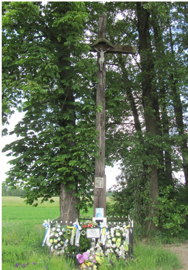
Lokalizacja: Chajety, Czas powstania: ok. II połowa XX w.

K apliczka murowana, otynkowana, dwupoziomowa, wnękowa, z daszkiem blaszanym czterospadowym zwieńczonym krzyżem żelaznym promienistym kowalskiej roboty. We wnęce od frontu zamkniętej szybą figura Pana Jezusa, w bocznej wnęce zamkniętej szybą figura Najświętszej Maryi Panny.