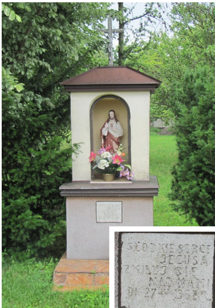
Lokalizacja: Cisie; Czas powstania: 1996 r.

K apliczka murowana, wnąkowa z daszkiem blaszanym czterospadowym, zwieńczonym krzyżem prostym żelaznym. We wnęce na drugim od ziemi poziomie figura Jezusa Chrystusa. Poniżej, tabliczka z napisem: „SŁODKIE SERCE JEZUSA ZMIŁUJ SIĘ NAD NAMI DN. 27 (miesiąc nieczytelny) 1996 R”.