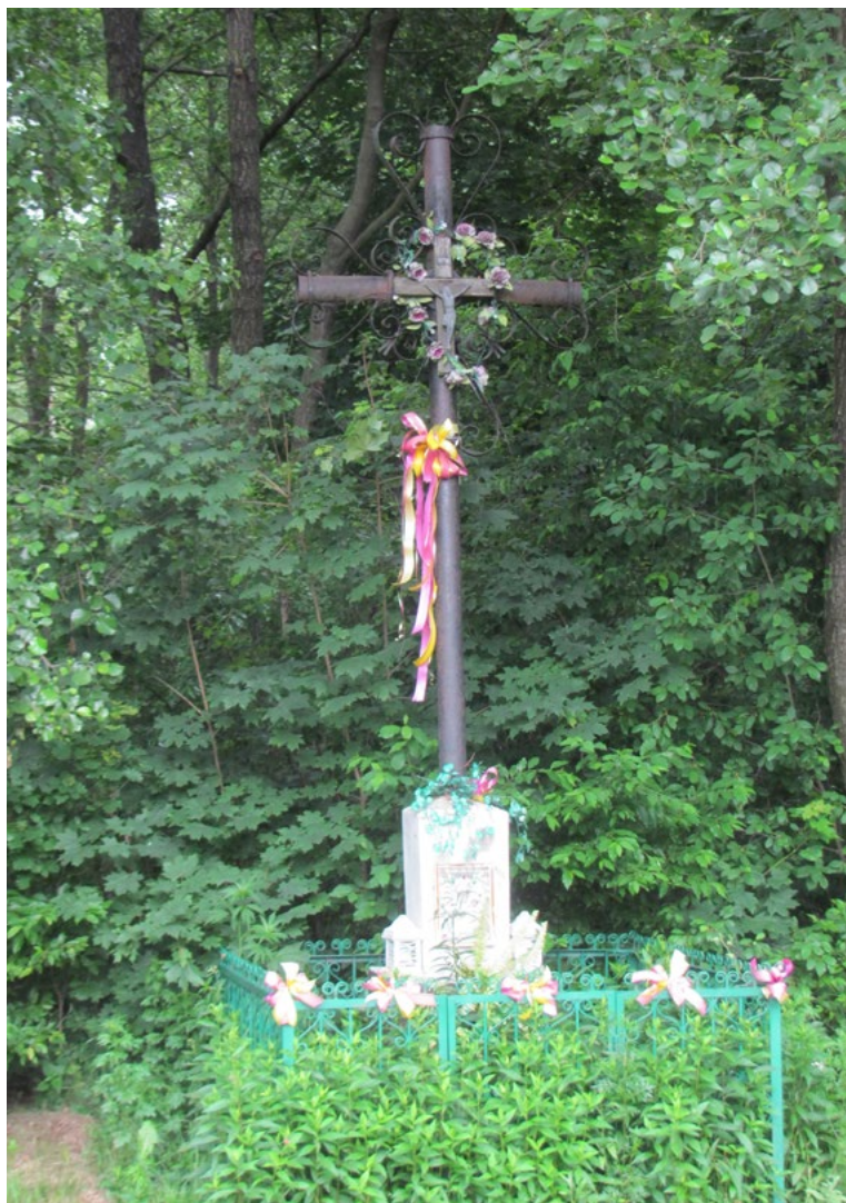
Lokalizacja: Józefów; Czas powstania: ok. I połowa XX w.

K rzyż żelazny na kamiennym cokole. Krzyż z figurą Chrystusa, z ażurowymi ornamentami wzdłuż ramion i pionowej belki. Na cokole reprodukcja obrazu Matki Bożej Częstochowskiej. Ogradzony żelaznym płotkiem.