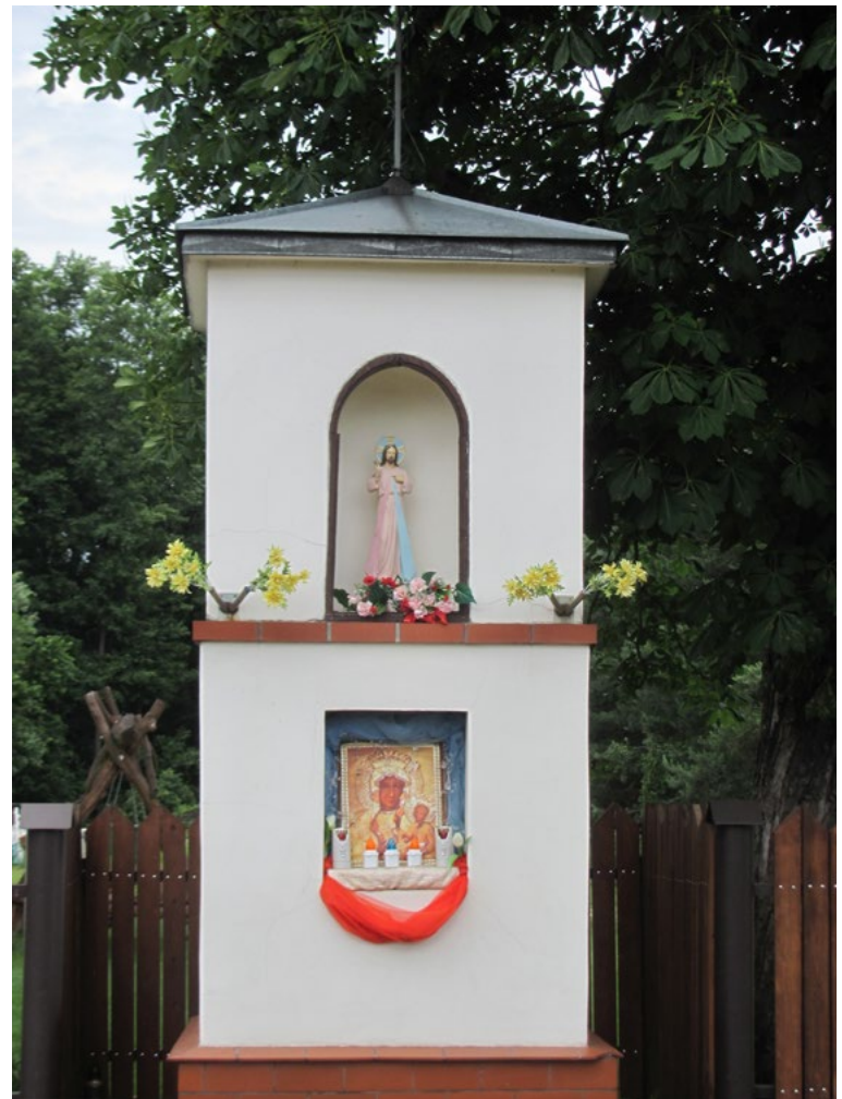
Lokalizacja: Józefów; Czas powstania: ok. I połowa XX w.

K rzyż żelazny gałkowy kowalskiej roboty na murowanym dwupoziomowym cokole. Figura Chrystusa blaszana. Ażurowe ornamenty wzdłuż obu belek krzyża. Stylizowane promienie żelazne na skrzyżowaniu belek. Na wyższym cokole tablica z napisem: "JEZU ZMIŁUJ SIĘ NAD NAMI" oraz datą „1966/2017”.