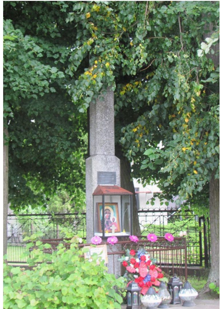
Lokalizacja: Lasków; Czas powstania: 1979 r.

Krzyż drewniany z figurą Chrystusa osłoniętą blaszanym daszkiem oraz wnęką. W zamkniętej szybkiej wnęcie reprodukcja obrazu Matki Bożej Różańcowej. Pod wnęką napis: „4 IX 1953 r.” Ogródzony drewnianym płotkiem.