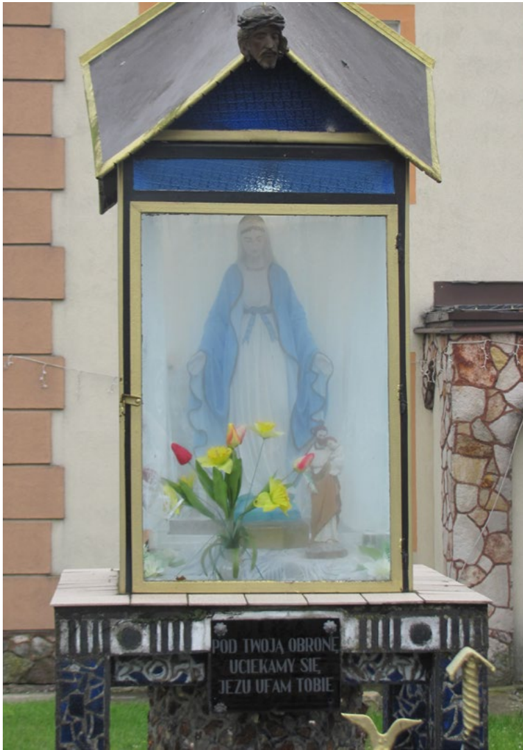
Lokalizacja: Guzowatka; Czas powstania: ok. II połowa XX w.

K apliczka w typie przeszklonej latarni na murowanym cokole. Dwuspadowy daszek zwieńczony metalową głową w cierniowej koronie. W zamkniętej szybie wewnątrz figura Najświętszej Maryi Panny. Na cokole tabliczka z napisem: „POD TWOJĄ OBRONĘ UCIEKAMY SIĘ JEZU UFAM TOBIE”.