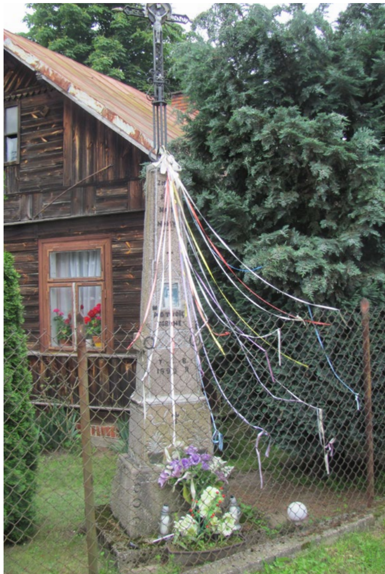
Lokalizacja: Marianów; Czas powstania: 1899 r.

K rzyż żelazny na granitowym cokole. Krzyż promienisty z figurą Chrystusa osłoniętą blaszanym daszkiem. Krzyż kowalskiej roboty z ażurowymi ornamentami. Cokół z wnęką, wielostopniowy, zwężający się ku górze. W najwyższej części cokółu, u nasady krzyża napis: „JEZU ZMIŁUJ SIĘ NAD NAMY”. W środkowej części cokółu wnęka zamknięta szybką z obrazkiem z wizerunkiem Jezusa Miłosiernego. Poniżej napis: „POD TWOJĄ OBRONĘ”. Na najniższym poziomie cokółu napis: „T K B 1899 R.”