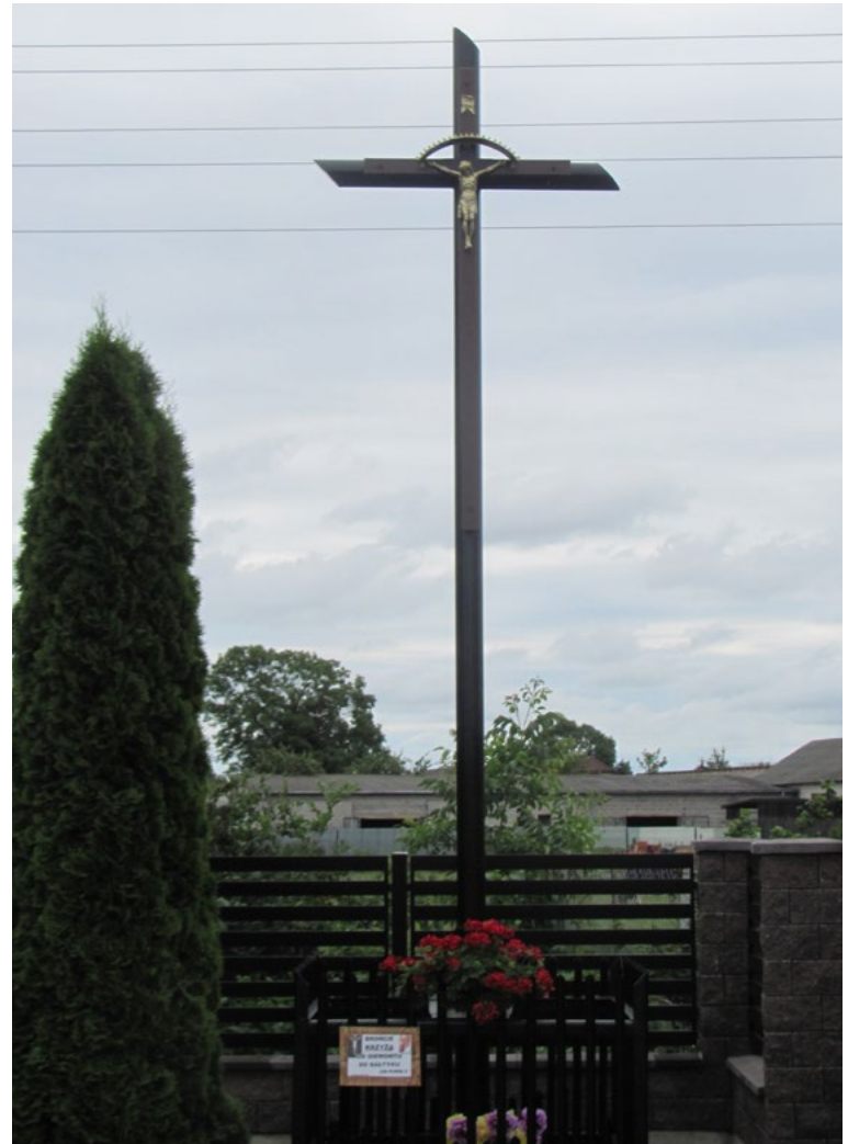
Lokalizacja: Małopole; Czas powstania: ok. początek XXI w.

K rzyż żelazny z kapliczką. Krzyż z figurą Chrystusa osłonięty blaszanym daszkiem. Dolna część pionowej belki konstrukcji szkieletowej. U nasady krzyża wykonana z żelaza data: „R 1981”. Kapliczka żelazna, zwieńczona daszkiem blaszanym czterospadowym. W zamkniętej szybkiej wnęce figura Niepokalanego Serca Najświętszej Maryi Panny. Ogródzony żelaznym płotkiem z furtką od frontu. Na furtce tabliczka z napisem: „BRONCIE KRZYŻA OD GIEWONTU DO BAŁTYKU JAN PAWEŁ II”.