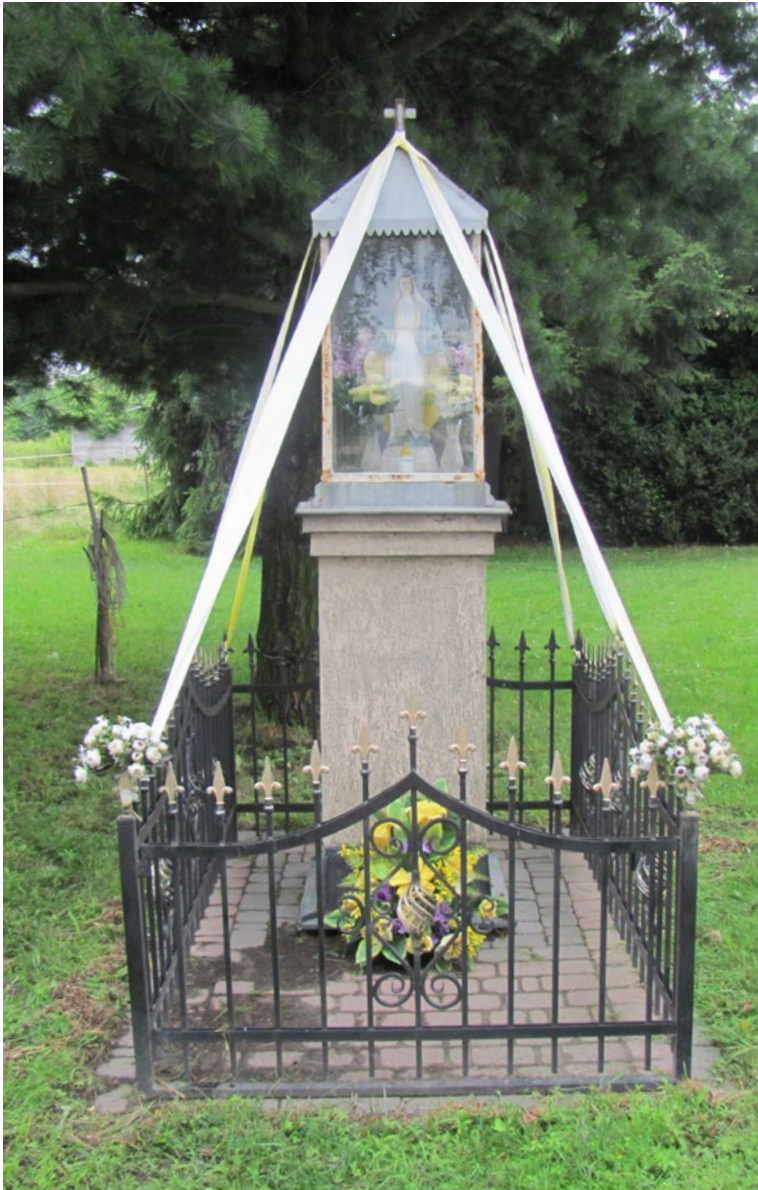
Lokalizacja: Guzowatka; Czas powstania: ok. I połowa XX w.

K apliczka żelazna w typie przeszklonej latarni na murowanym cokole. Czterospadowy blaszany daszek zwieńczony żelaznym krzyżem. Wnęce figura Najświętszej Maryi Panny. Ustawiona na betonowym podłożu, ogrodzona żelaznym płotkiem.