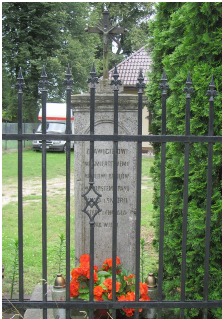
Lokalizacja: Chajęty, ul. Wspólna; Czas powstania: ok. I połowa XX w.

M urowana kapliczka kolumnowa z figurą św. Jana Nepomucena. Fundament murowany na planie kwadratu. Kolumna o przekroju okrągłym. Figura niekompletna - brak lewej dłoni.