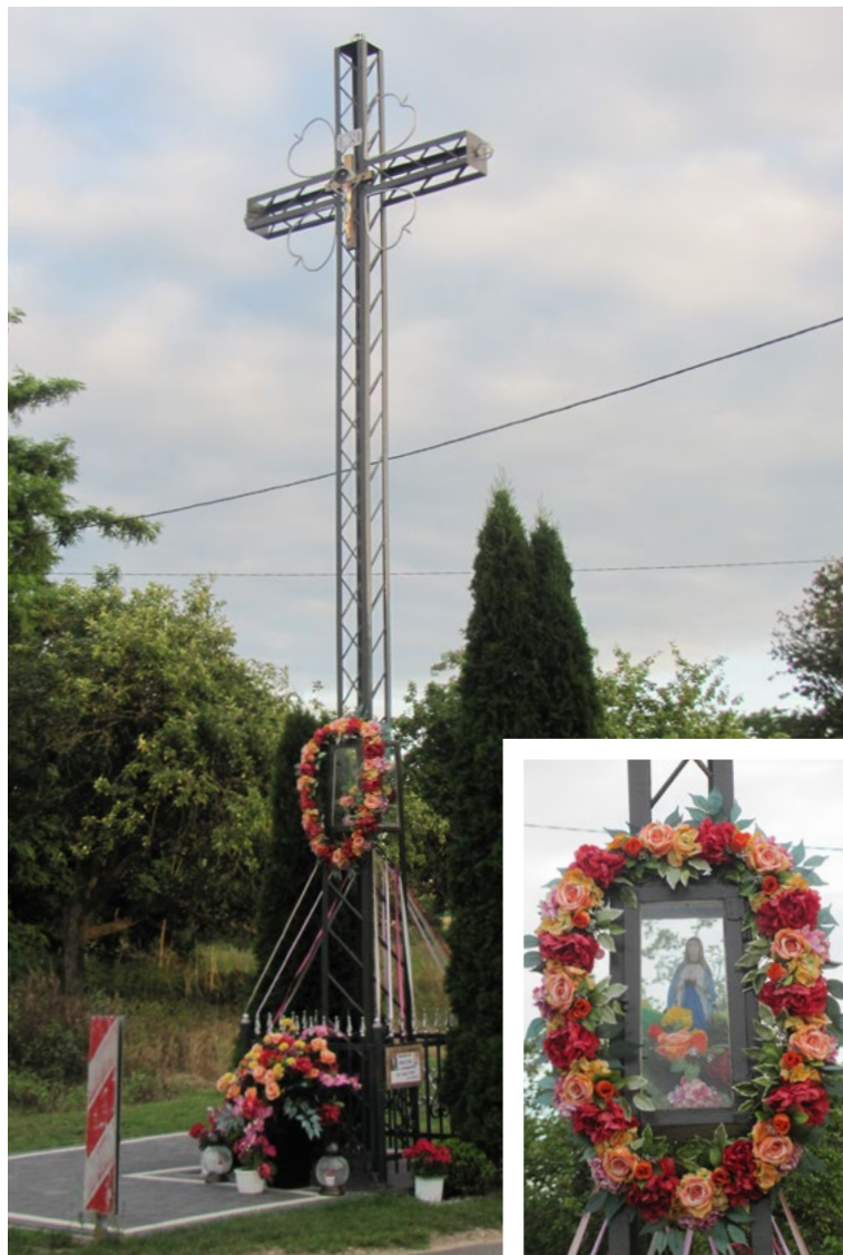
Lokalizacja: Zaścienie, przy drodze do Chruścieli; Czas powstania: ok. II połowa XX w.

K rzyż żelazny z dwiema kapliczkami. Krzyż z figurą Chrystusa, gałkowy, konstrukcji szkieletowej. Wokół figury ażurowe zdobienia w postaci serc. W dolnej części pionowej belki żelazna kapliczka w typie przeszklonej latarni z figurą Matki Bożej Różańcowej. Poniżej drewniana kapliczka z daszkiem płaskim zwieńczonym krzyżem drewnianym z figurą Chrystusa. W zamkniętej szybce wewnątrz reprodukcja obrazu Matki Bożej Częstochowskiej z napisem: „MATKO BOŻA CZĘSTOCHOWSKA BŁOGOSŁAW NAM”. Ustawiony na podłożu z kostki betonowej.