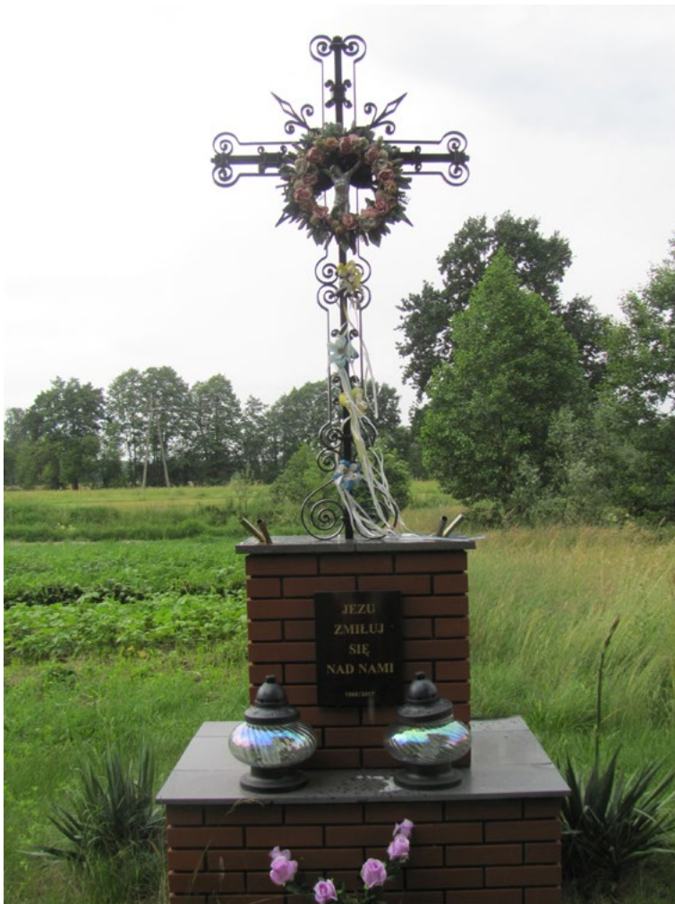
Lokalizacja: Józefów – Wólka Czarnowska Czas powstania: 1966 - 2017 r.

K rzyż żelazny gałkowy kowalskiej roboty na murowanym dwupoziomowym cokole. Figura Chrystusa blaszana. Ażurowe ornamenty wzdłuż obu belek krzyża. Stylizowane promienie żelazne na skrzyżowaniu belek. Na wyższym cokole tablica z napisem: "JEZU ZMIŁUJ SIĘ NAD NAMI" oraz datą „1966/2017”.