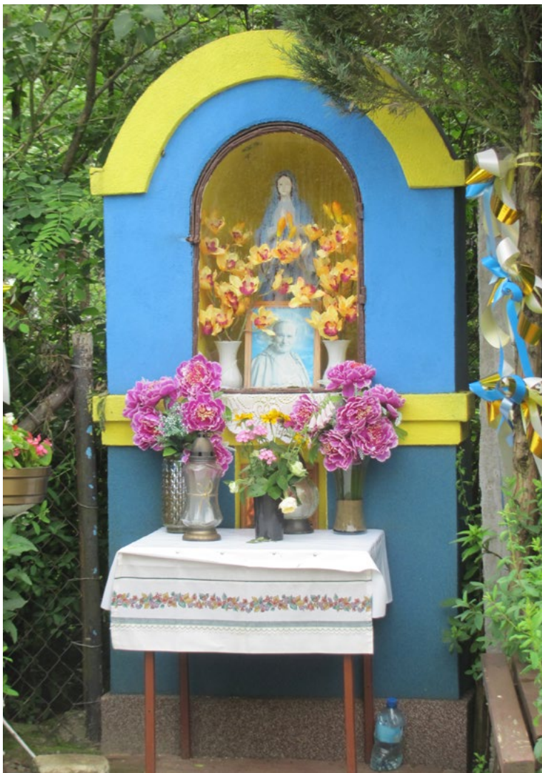
Lokalizacja: Teodorów; Czas powstania: ok. I połowa XX w.

K apliczka murowana, dwupoziomowa, wnękowa, o łukowatym sklepieniu. W zamkniętej szybką, półokrągłej wnęcie, figura Matki Bożej Różańcowej i reprodukcja obrazu Św. Jana Pawła II. Otynkowana. Ustawiona na betonowym podłożu.