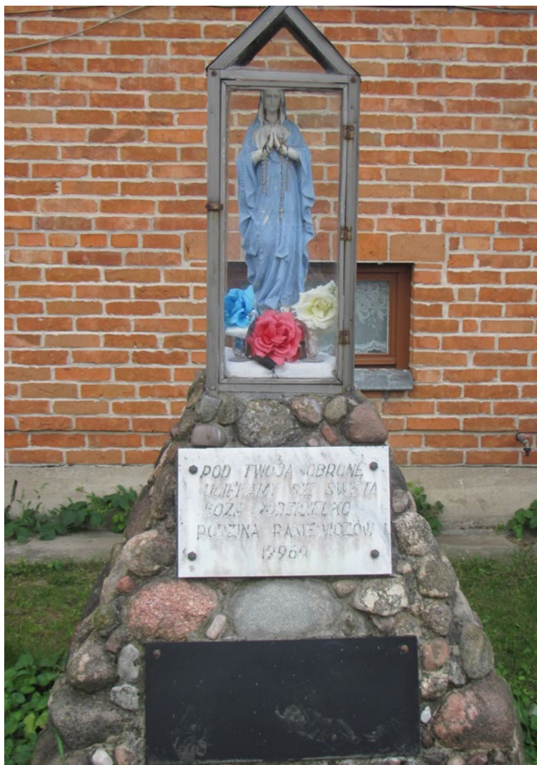
Lokalizacja: Chruściele; Czas powstania: 1996 r.