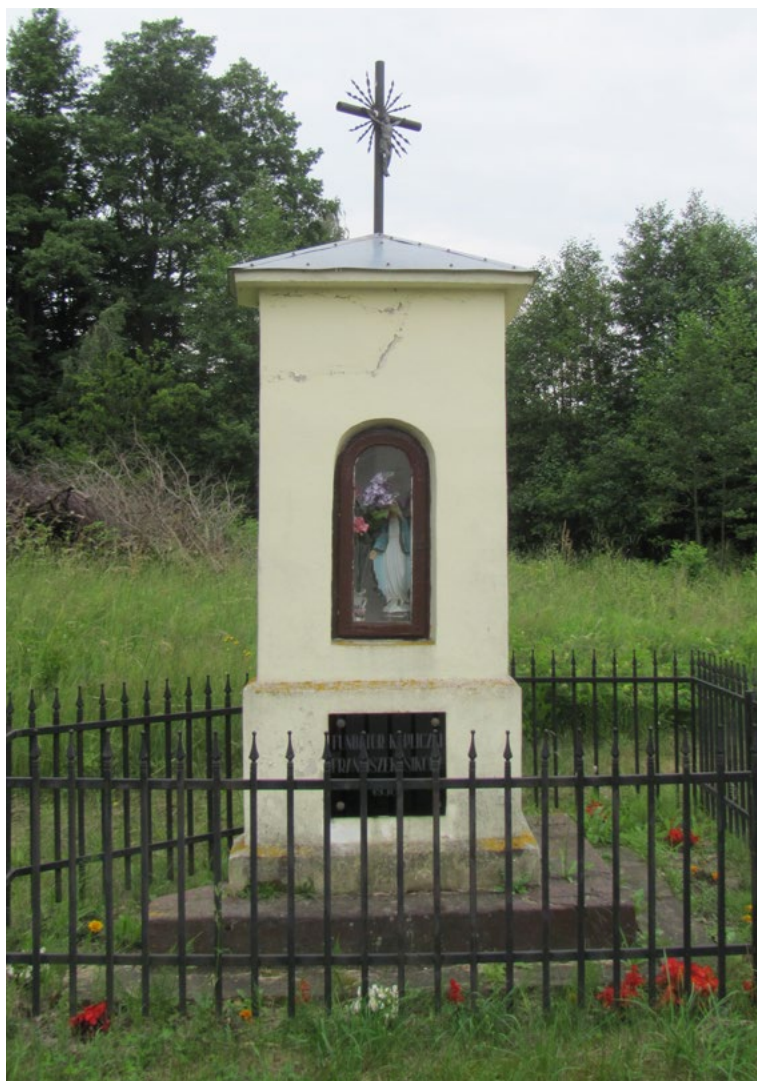
Lokalizacja: Dręszew, ul. Zakole; Czas powstania: 1930 r.