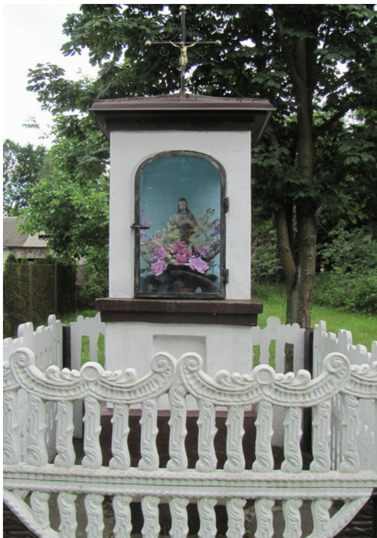
Lokalizacja: Dręszew; Czas powstania: ok. I połowa XX w.

K apliczka murowana, wnekowa, dwupoziomowa, otynkowana. Blaszany daszek zwieńczony krzyżem żelaznym z figurą Chrystusa. Krzyż gałkowy z ornamentami wokół ramion. Wnęka na pierwszym od ziemi poziomie pusta. Wnęka na drugim poziomie półokrągła, zamknięta szybą. Wewnątrz figura Najświętszego Serca Jezusa. Kapliczka ogrodzona betonowym płotkiem.