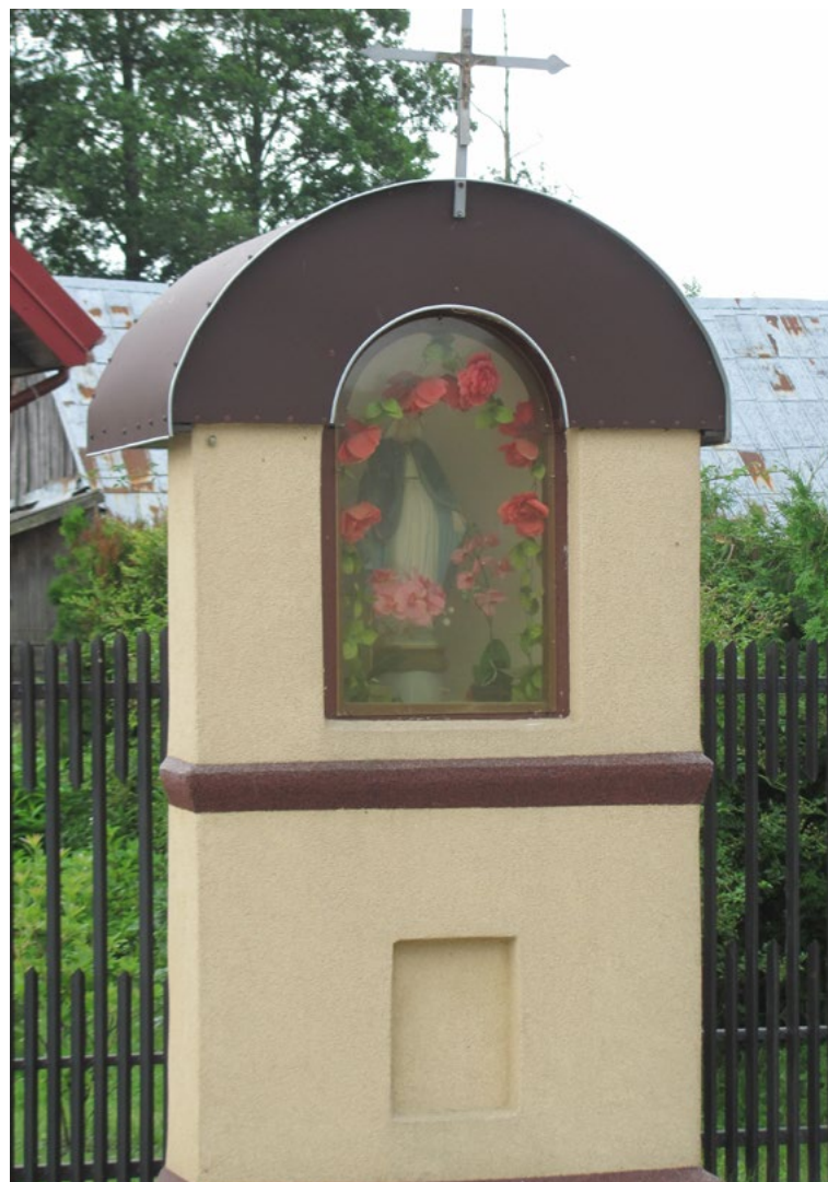
Lokalizacja: Cisie; Czas powstania: ok. I połowa XX w.

K apliczka żelazna w typie przeszklonej latarni, zwieńczona półokrągłym daszkiem. We wnętrzu figura Najświętszej Maryi Panny. Ustawiona na murowanym cokole.