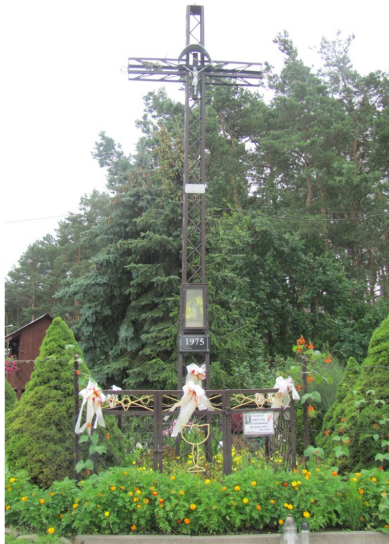
Lokalizacja: Chajęty; Czas powstania: 1914 - 1975 r.