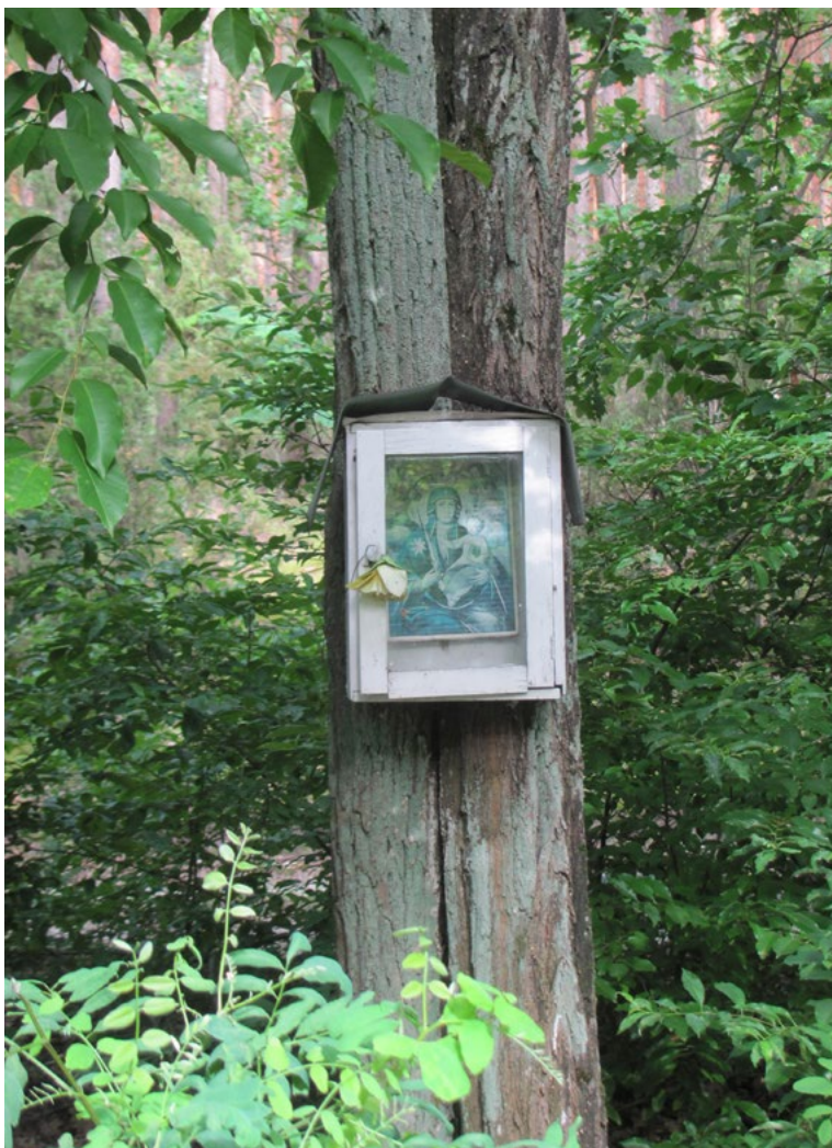
Lokalizacja: Dręszew, przy drodze do Dąbrówki, tzw. Dręszew Górki, Ul. Nadbużańska; Czas powstania: ok. I połowa XX w.

N adrzewna kapliczka drewniana, skrzynkowa. W zamkniętej szybką wewnątrz reprodukcja obrazu z wizerunkiem Matki Bożej z Dzieciątkiem.