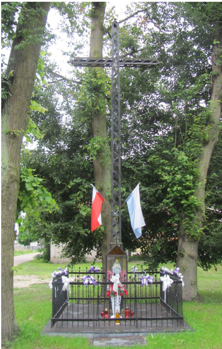
Lokalizacja: Ostrówek; Czas powstania: ok. II połowa XX w.

K rzyż żelazny z kapliczką. Krzyż z figurą Chrystusa, gałkowy, konstrukcji szkieletowej. W dolnej części pionowej belki kapliczka w typie przeszklonej latarni z daszkiem czterospadowym, z figurą Matki Bożej Różańcowej. Ustawiony na betonowym podłożu, ogrodzony żelaznym płotkiem.