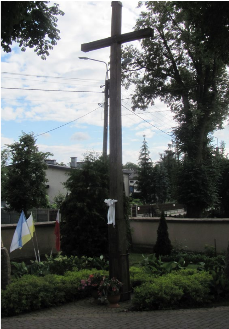
Lokalizacja: Dąbrówka, na terenie przy kościele; Czas powstania: 1951 - 1994 r.

Krzyż drewniany na podłożu z kostki betonowej. Na pionowej belce data: „3-11-III 1951 r.” poniżej płaskorzeźba przedstawiająca Ostatnią Wieczerzę. Pod nią data: „27 XI - XII 1994”.