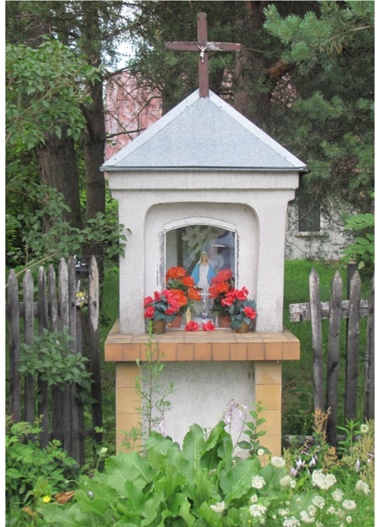
Lokalizacja: Wszebory; Czas powstania: ok. połowa XX w.

Krzyż żelazny z kapliczką. Krzyż z figurą Chrystusa szkieletowej konstrukcji. Kapliczka żelazna zamknięta szybką, wewnątrz figura Najświętszej Maryi Panny. Poniżej dwie reprodukcje obrazów Matki Bożej Częstochowskiej. Ustawiony na betonowym podłożu, ogrodzony żelaznym płotkiem.