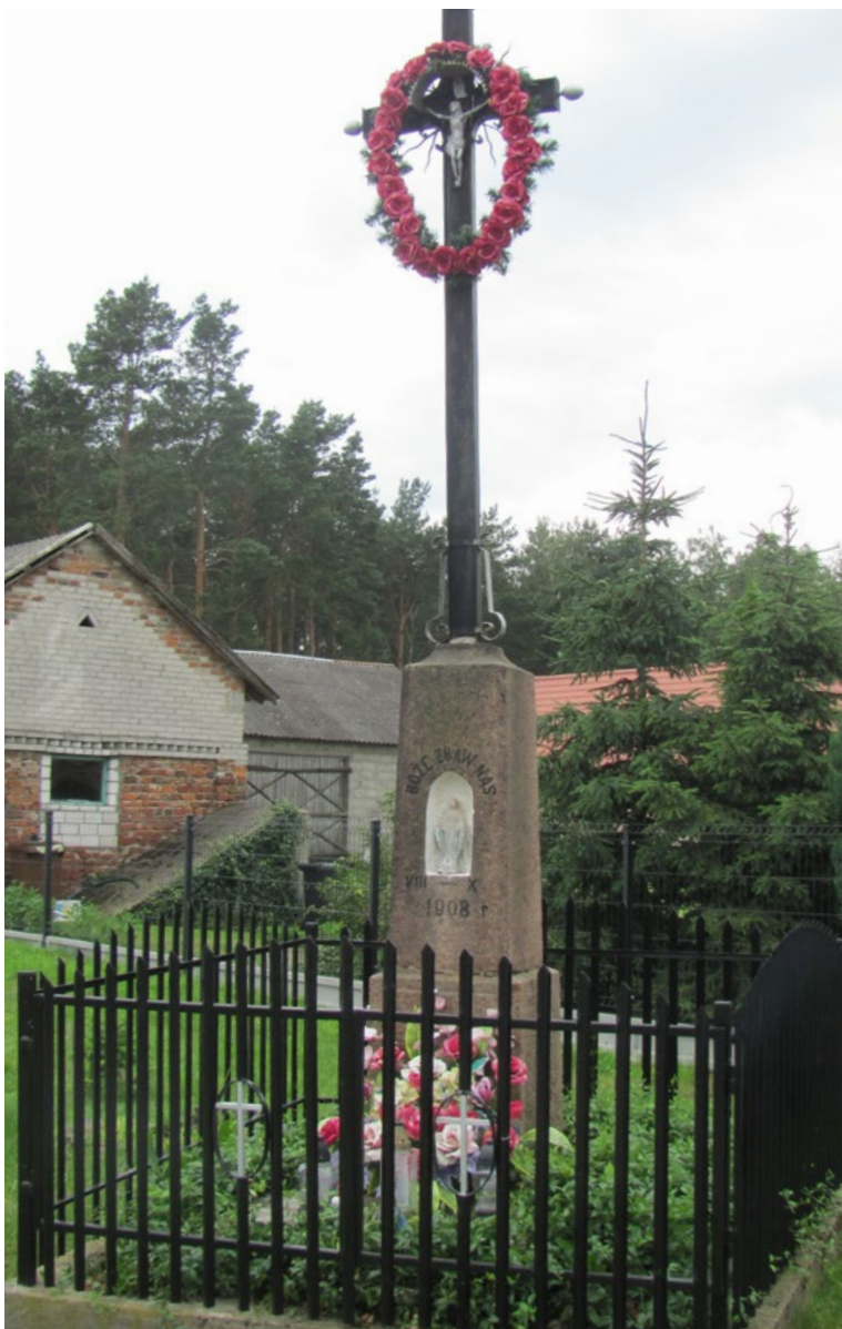
Lokalizacja: Kowalicha; Czas powstania: 1908 r.

K rzyż żelazny na kamiennym cokole z wnęką. Krzyż gałkowy, promienisty, z figurą Chrystusa osłoniętą blaszanym daszkiem. Cokół dwustopniowy, zwężający się ku górze. W półokrągłej wnęce figura Najświętszej Maryi Panny. Nad wnęką oraz poniżej napis: „BOŻE ZBAW NAS VIII – X 1908 R.” Ustawiony na betonowym podłożu, ogrodzony żelaznym płotkiem.