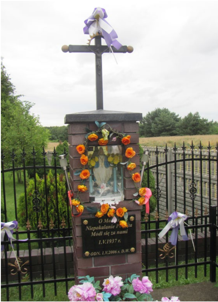
Lokalizacja: Kołaków; Czas powstania: 1937 - 2006 r.

K rzyż żelazny gałkowy z figurą Chrystusa na murowanym cokole z przeszkloną wnęką. We wnęce figura Najświętszej Maryi Panny. Pod wnęką tablica z napisem: „O MARYJO NIEPOKALANIE POCZĘTA MÓDL SIĘ ZA NAMI I.V.1937 R. ODN. I.V.2006 R. D.W.”