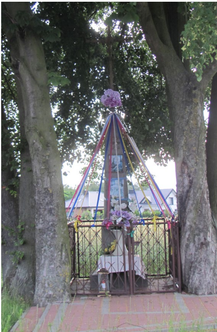
Lokalizacja: Wszebory, ul. Graniczna; Czas powstania: 1908 r.

K rzyż żelazny na kamiennym cokole. Krzyż kowalskiej roboty, gałkowy, promienisty, z figurą Chrystusa. Wzdłuż obydwu belek krzyża ażurowe ornamenty. Cokół dwustopniowy, zwężający się ku górze. Na drugim od ziemi stopniu, od frontu napis: „BOŻE ZBAW NAS” oraz we wnękach reprodukcje obrazów Matki Bożej i św. Jana Pawła II. Poniżej data „1908 R.” Ustawiony na podłożu z kostki betonowej, ogrodzony żelaznym płotkiem.