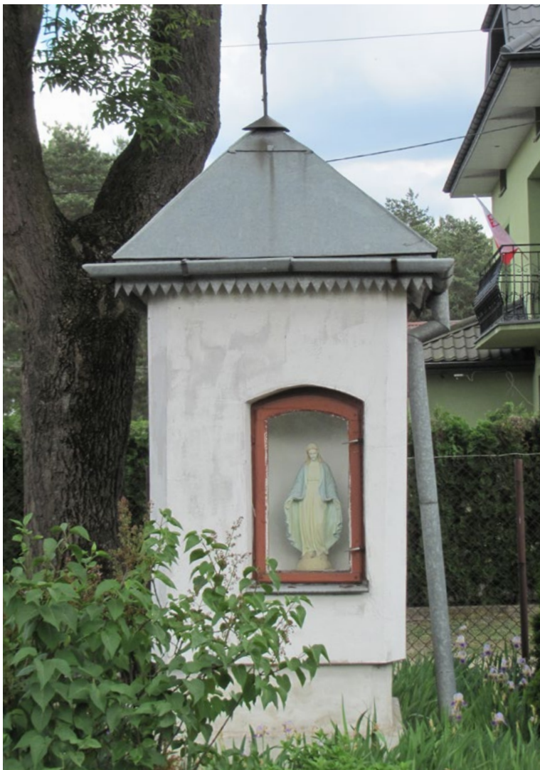
Lokalizacja: Chajety, ul. Wspólna; Czas powstania: ok. I połowa XX w.

K apliczka murowana, otynkowana, dwupoziomowa, wnękowa, z daszkiem blaszanym czterospadowym zwieńczonym krzyżem żelaznym promienistym kowalskiej roboty. We wnęce od frontu zamkniętej szybą figura Pana Jezusa, w bocznej wnęce zamkniętej szybą figura Najświętszej Maryi Panny.