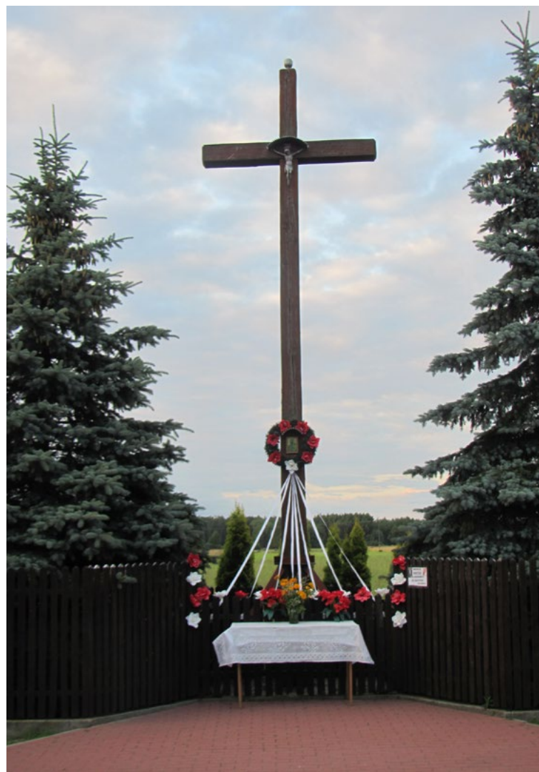
Lokalizacja: Zaścienie; Czas powstania: ok. II połowa XX w.

K rzyż z tzw. lastrico z figurą Chrystusa. Przy pionowej belce tablica z napisem: „JEZU UFAM TOBIE 1999 R. FUND. P. MARCINKIEWICZ”. Ustawiony na betonowej wylewce. Ogrodzony żelaznym płotkiem.