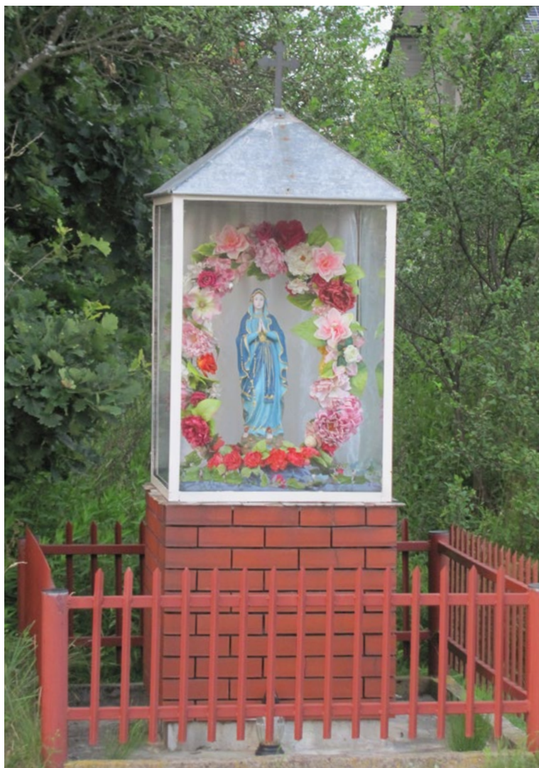
Lokalizacja: Karolew; Czas powstania: 1960 r.

K apliczka murowana, węgkowa, dwupoziomowa, z daszkiem dwuspadowym. W półokrągłej wnęce figura Najświętszej Maryi Panny. Nad wnątką w szczycie data „1960 R.” Na pierwszym od ziemi poziomie mało czytelny napis: „MARYJO KRÓLOWO POLSKI MÓDL SIĘ ZA NAMI”.