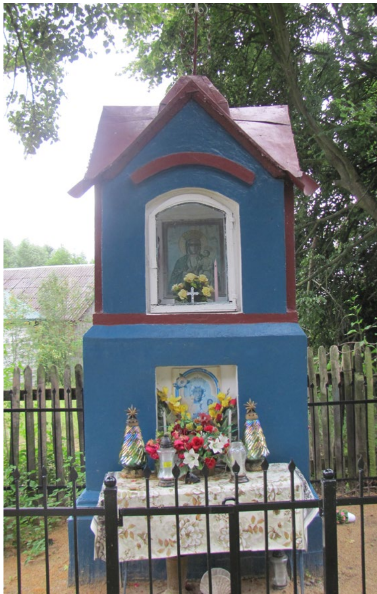
Lokalizacja: Działy Czarnowskie; Czas powstania: ok. I połowa XX w.

K apliczka murowana, wnekowa, dwupoziomowa, otynkowana. Daszek łamany zwieńczony krzyżem żelaznym. W półokrągłej wnęcie zamkniętej szybą na drugim od ziemi poziomie od frontu reprodukcja obrazu Matki Bożej. Dolna wnęka pusta. W bocznej wnęcie zamkniętej szybą figura Najświętszej Maryi Panny. Ogrodzona drewnianym płotkiem.