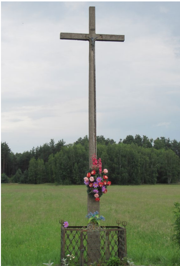
Lokalizacja: Ludwinów; Czas powstania: ok. II połowa XX w.

K rzyż betonowy z figurą Chrystusa ustawiony na podłożu z kostki betonowej, ogrodzony żelaznym płotkiem.