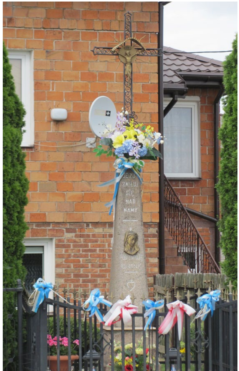
Lokalizacja: Karpin, ul. Lipowa; Czas powstania: 1900 r.

K rzyż żelazny na kamiennym, zwężającym się do góry cokole. Krzyż z figurą Chrystusa osłoniętą blaszanym daszkiem, szkieletowej konstrukcji, z ażurowymi zdobieniami. Na cokole od frontu u nasady krzyża napis: „JEZU ZMIŁUJ SIĘ NAD NAMY”. Poniżej płaskorzeźba z wizerunkiem Najświętszej Maryi Panny, pod nią napis: „POD TWOJĄ OBRONĘ”. Poniżej data: „1900 R.” Ogrodzony żelaznym płotkiem.