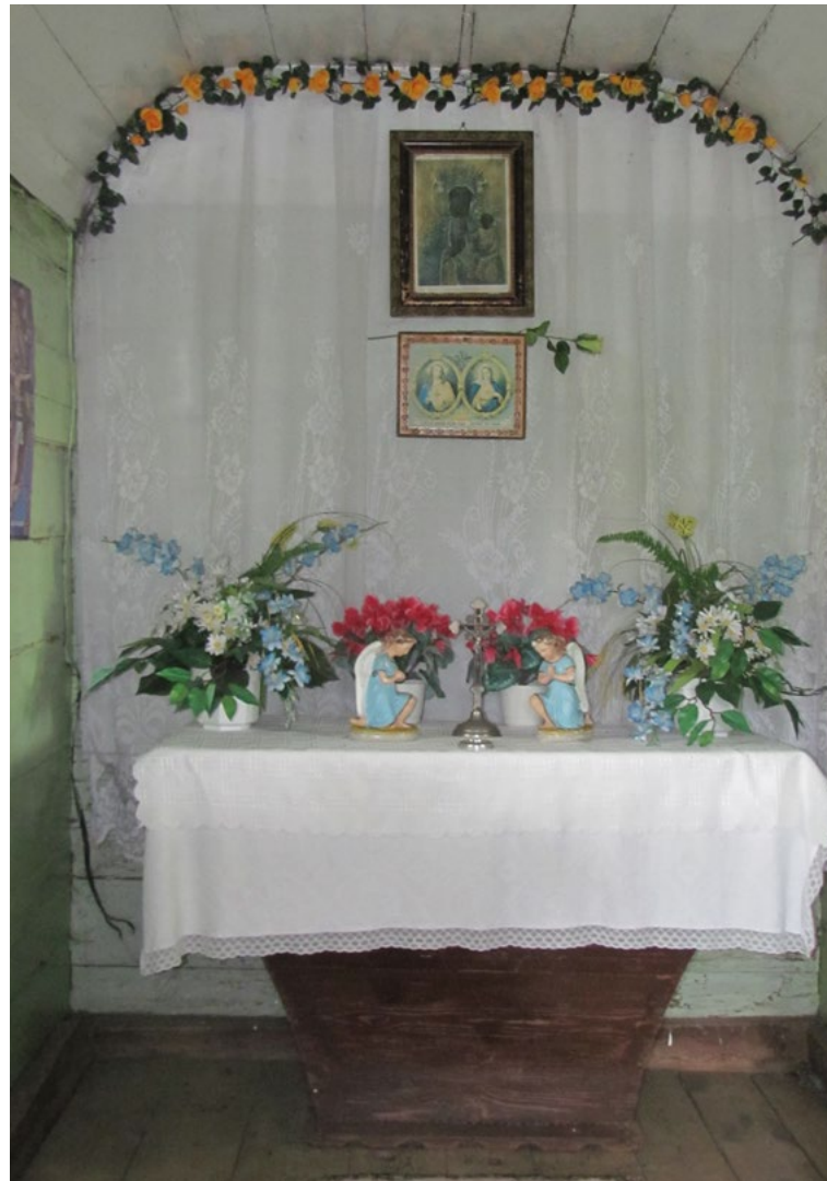
Lokalizacja: Marianów; Czas powstania: ok. I połowa XX w.

Drewniana kapliczka domkowa kryta dachem dwuspadowym z centralną wieżyczką krytą dachem czterospadowym zwieńczoną krzyżem żelaznym kowalskiej roboty. Budynek konstrukcji szkieletowej oszalowany pionowymi deskami. Szyty dachu zdobione rzeźbionymi listwami. Wejście do budynku w ścianie szczytowej. W ścianach bocznych okna czteroszybowe o półkolistym zwieńczeniu. Wewnątrz, na ścianie głównej reprodukcje obrazów Matki Bożej Częstochowskiej oraz Najświętszego Serca Jezusa i Serca Maryi. Na stole, pomiędzy figurkami aniołów krzyż żelazny z figurą Chrystusa. Na ścianach bocznych obrazy np. Pamiętka Chrztu Świętego.