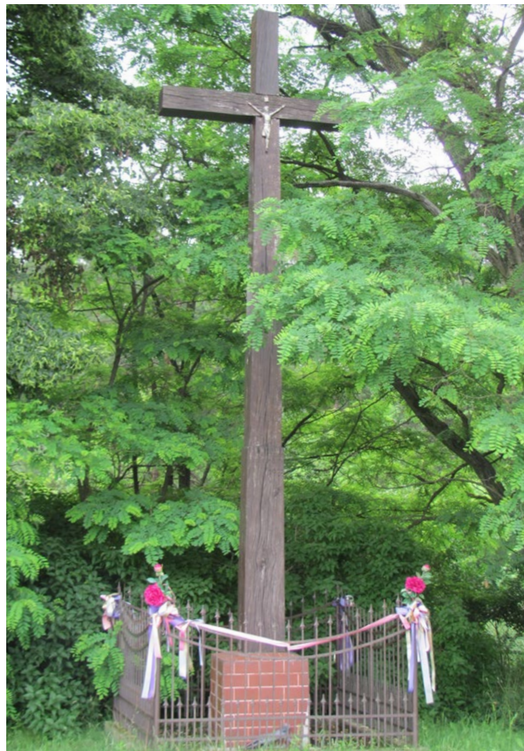
Lokalizacja: Dręszew; Czas powstania: 1998 r.

K apliczka murowana, wnekowa, dwupoziomowa, otynkowana. Blaszany daszek zwieńczony krzyżem żelaznym z figurą Chrystusa. Krzyż gałkowy z ornamentami wokół ramion. Wnęka na pierwszym od ziemi poziomie pusta. Wnęka na drugim poziomie półokrągła, zamknięta szybą. Wewnątrz figura Najświętszego Serca Jezusa. Kapliczka ogrodzona betonowym płotkiem.