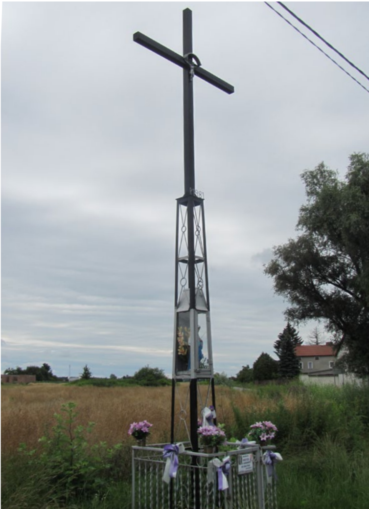
Lokalizacja: Małopole; Czas powstania: 1981 r.

K rzyż żelazny z kapliczką. Krzyż z figurą Chrystusa osłonięty blaszanym daszkiem. Dolna część pionowej belki konstrukcji szkieletowej. U nasady krzyża wykonana z żelaza data: „R 1981”. Kapliczka żelazna, zwieńczona daszkiem blaszanym czterospadowym. W zamkniętej szybkiej wnęce figura Niepokalanego Serca Najświętszej Maryi Panny. Ogródzony żelaznym płotkiem z furtką od frontu. Na furtce tabliczka z napisem: „BRONCIE KRZYŻA OD GIEWONTU DO BAŁTYKU JAN PAWEŁ II”.