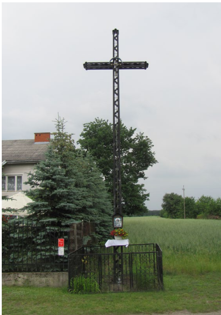
Lokalizacja: Kuligów; Czas powstania: ok. II połowa XX w.

Krzyż żelazny szkieletowej konstrukcji z figurą Chrystusa osłoniętą blaszanym daszkiem. W dolnej części pionowej belki reprodukcja obrazu Matki Bożej Częstochowskiej. Ogradzony żelaznym płotkiem.