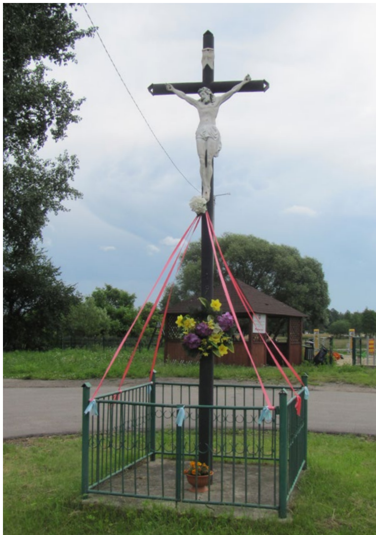
Lokalizacja: Sokołówek; Czas powstania: ok. II połowa XX w.

K rzyż żelazny z figurą Chrystusa. Ustawiony na betonowym podłożu, ogrodzony żelaznym płotkiem. Od frontu na płotku tabliczka z napisem: „BRONICIE KRZYŻA OD GIEWONTU DO BAŁTYKU JAN PAWEŁ II”.