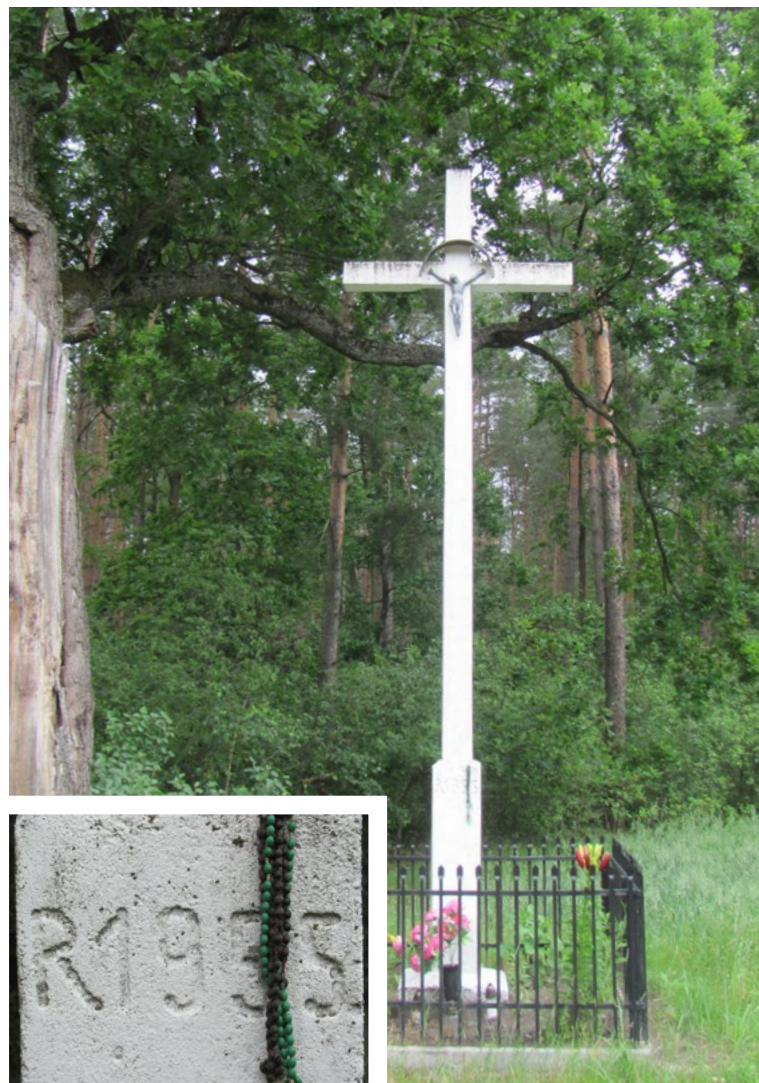
Lokalizacja: Cisie; Czas powstania: 1955 r.

K apliczka murowana, wnąkowa z daszkiem blaszanym czterospadowym, zwieńczonym krzyżem prostym żelaznym. We wnęce na drugim od ziemi poziomie figura Jezusa Chrystusa. Poniżej, tabliczka z napisem: „SŁODKIE SERCE JEZUSA ZMIŁUJ SIĘ NAD NAMI DN. 27 (miesiąc nieczytelny) 1996 R”.