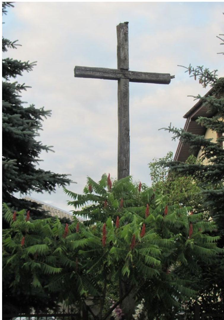
Lokalizacja: Zaścienie; Czas powstania: 1952 r.

K rzyż drewniany. Na poziomej belce napis: „JEZU UFAM TOBIE”, na belce pionowej: „ROK PAŃSKI 1995”. BŁOGOSŁAW NAM”. Ustawiony na podłożu z kostki betonowej.