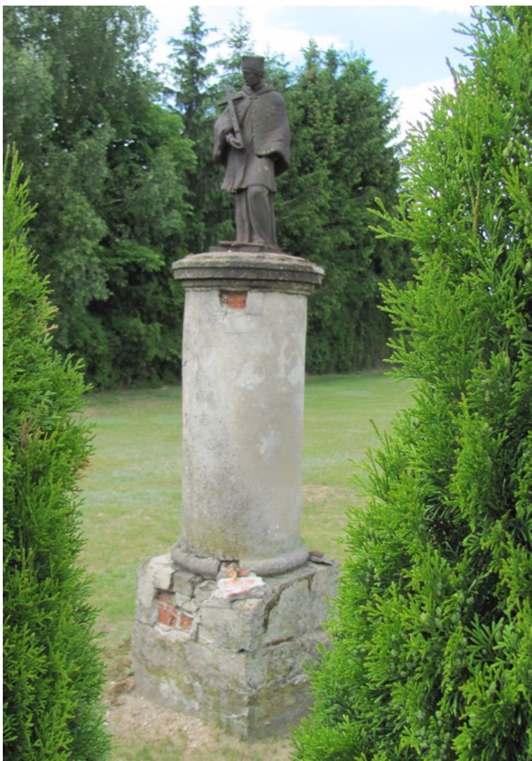
Lokalizacja: Chajęty, ul. Wspólna; Czas powstania: według Katalogu Zabytków Sztuki w Polsce, kapliczka datowana na I poł. XIX w.

M urowana kapliczka kolumnowa z figurą św. Jana Nepomucena. Fundament murowany na planie kwadratu. Kolumna o przekroju okrągłym. Figura niekompletna - brak lewej dłoni.