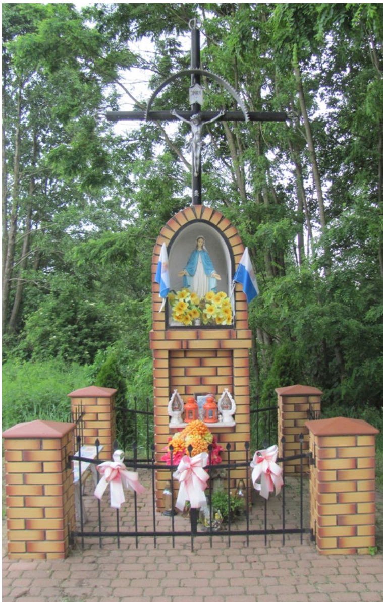
Lokalizacja: Czarnów; Czas powstania: ok. początek XXI w.

K apliczka murowana z cegły, wnekowa, zwieńczona krzyżem żelaznym. Krzyż gałkowy z figurą Chrystusa osłoniętą blaszanym daszkiem. W górnej półokrągłej, zamkniętej szybie wnęce figura Najświętszej Maryi Panny. Dolna wnęka pusta. Ustawiona na podłożu z kostki betonowej. Ogrodzona żelaznym płotkiem rozdzielonym murowanymi z cegły kolumnami.