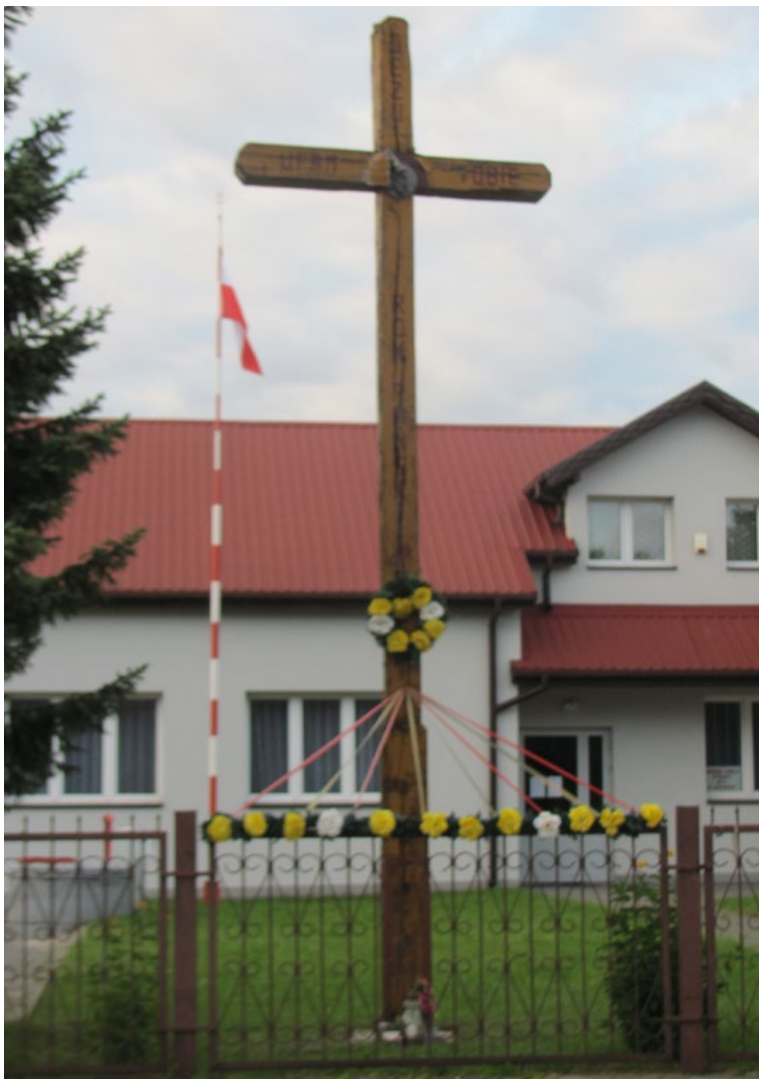
Lokalizacja: Zaścienie, przy budynku OSP; Czas powstania: 1995 r.

K rzyż drewniany. Na poziomej belce napis: „JEZU UFAM TOBIE”, na belce pionowej: „ROK PAŃSKI 1995”. BŁOGOSŁAW NAM”. Ustawiony na podłożu z kostki betonowej.