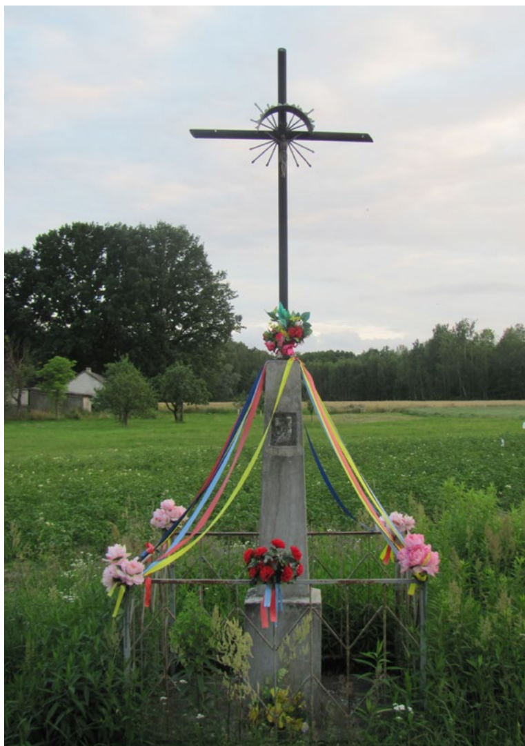
Lokalizacja: Wszebory; Czas powstania: ok. I połowa XX w.

K rzyż żelazny, promienisty, z figurą Chrystusa osłoniętą blaszanym daszkiem. Krzyż na kamiennym, dwustopniowym, zwężającym się do góry cokole. Na drugim od ziemi stopniu pusta wnęka. Ogrodzony żelaznym płotkiem.