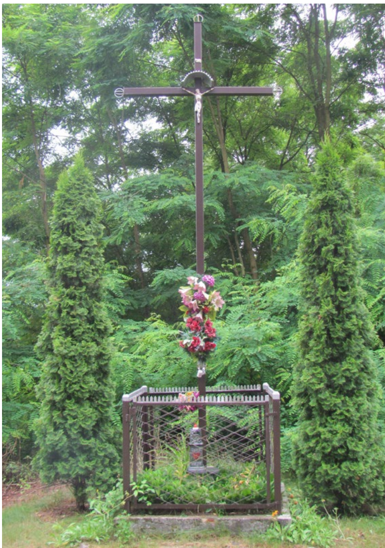
Lokalizacja: Działy Czarnowskie; Czas powstania: ok. II połowa XX w.

K rzyż żelazny prosty z figurą Chrystusa osłoniętą blaszanym daszkiem. Ustawiony na betonowym podłożu, ogrodzony żelaznym płotkiem.