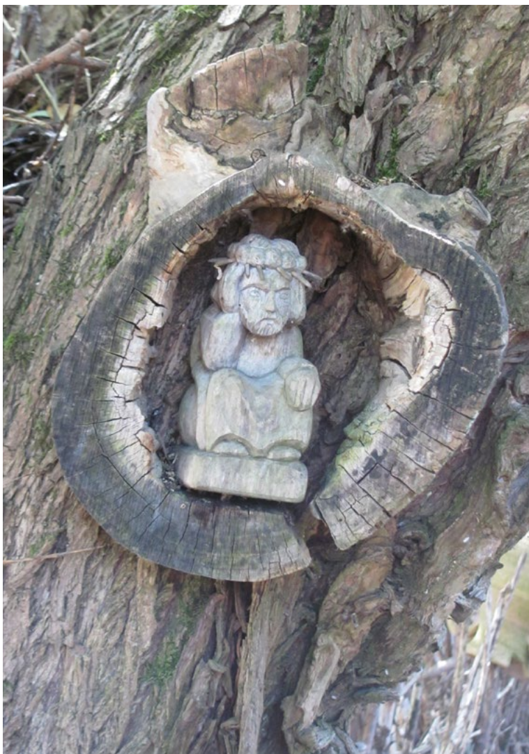
Lokalizacja: Kuligów, ul. Kręta, na terenie Skansenu; Czas powstania: brak danych

F igurka Chrystusa Frasobliwego w zaimprovizowanym uchwycie w pniu drzewa.