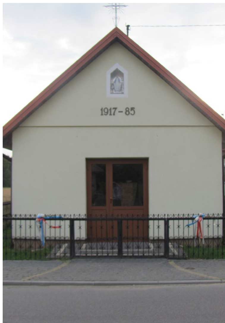
Lokalizacja: Chruściele; Czas powstania: 1917 - 1985 r.