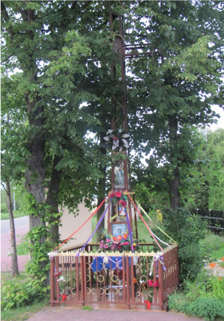
Lokalizacja: Wszebory, Trakt Napoleoński / ul. Wąska; Czas powstania: ok. II połowa XX w.

Krzyż żelazny z kapliczką. Krzyż z figurą Chrystusa szkieletowej konstrukcji. Kapliczka żelazna zamknięta szybką, wewnątrz figura Najświętszej Maryi Panny. Poniżej dwie reprodukcje obrazów Matki Bożej Częstochowskiej. Ustawiony na betonowym podłożu, ogrodzony żelaznym płotkiem.