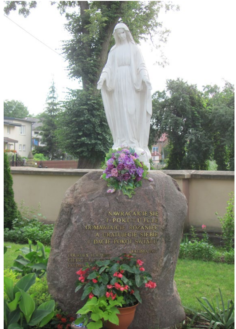
Lokalizacja: Dąbrówka, na terenie przy kościele; Czas powstania: ok. początek XXI w.

Krzyż drewniany na podłożu z kostki betonowej. Na pionowej belce data: „3-11-III 1951 r.” poniżej płaskorzeźba przedstawiająca Ostatnią Wieczerzę. Pod nią data: „27 XI - XII 1994”.