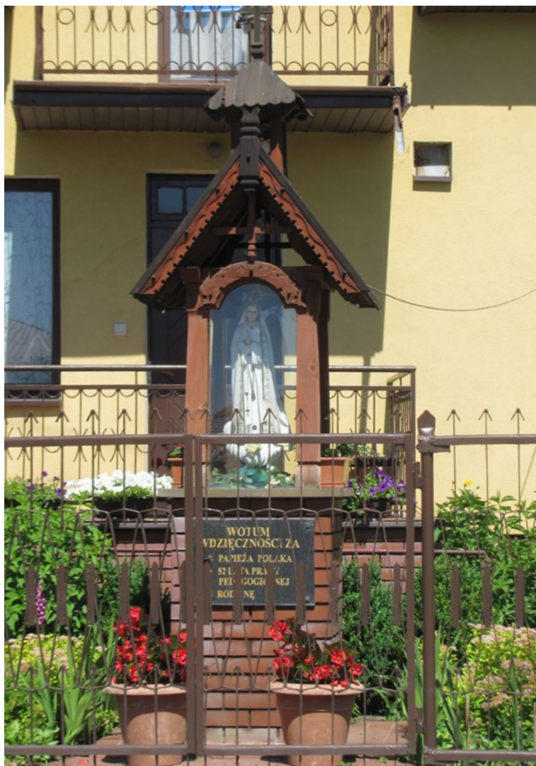
Lokalizacja: Ludwinów; Czas powstania: ok. początek XXI w.

K apliczka drewniana w typie przeszklonej latarni z figurą Matki Bożej Fatimskiej na murowanym cokole. Daszek dwuspadowy drewniany zwieńczony krzyżem. Na cokole od frontu napis: „WOTUM Wdzięczności za PAMIĘĆ POLAKA 52 LATA PRACY PEDAGOGICZNEJ RODZINĘ”. Ustawiona na betonowym podłożu.